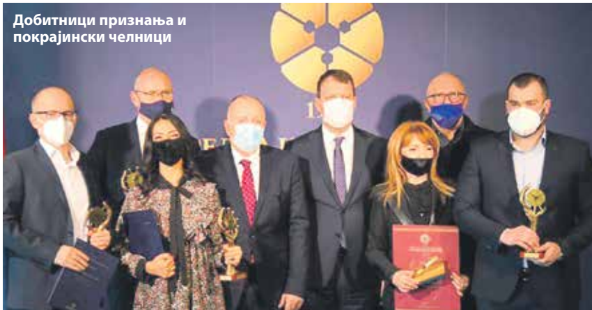
Добитници признања и покрајински челници