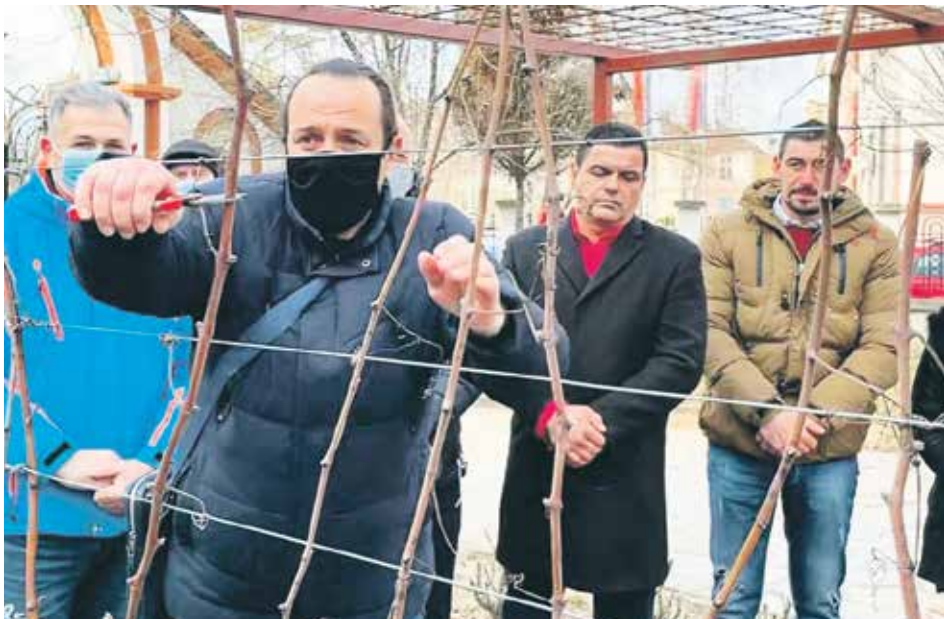
Резивање лозе са Хиландара

У Туристичку организацију општине донето је укупно 107 узорка вина, 36 розе, 39 белог и 32 узорка црвеног вина. Шесточлана комисија доделила је златну медаљу