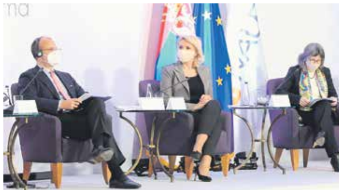
Са 13. годишње конференције о економским реформама у Србији, министарка Дарија Кисић Тепавчевић, у средини

Кисић Тепавчевић је у оквиру панела „Заједно за дигиталну економију“ нагласила да је Министарство за рад, запошљавање, борачка и социјална питања, вођено dobrim резултатима поједностављеног начина пријављивања сезонских радника у области пољопривреде, препознало потребу да се тај начин пријављивања прошири и на области грађевинарства, туризма, угоститељства и помоћи у кући. Она је подсетила да се на основу тог закона 27.000 радника у области пољопривреде пријавило и на тај начин изашло из „сиве зоне“, а да је у буџет Републике Србије на име њихових доприноса уплаћено 245 милиона динара.