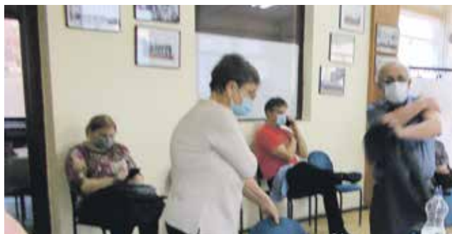
Пункт за вакцинасање у кикиндском Дому пензионера

Овај простор је на располагању и за масовне радне скупове чланова садашњег Градског