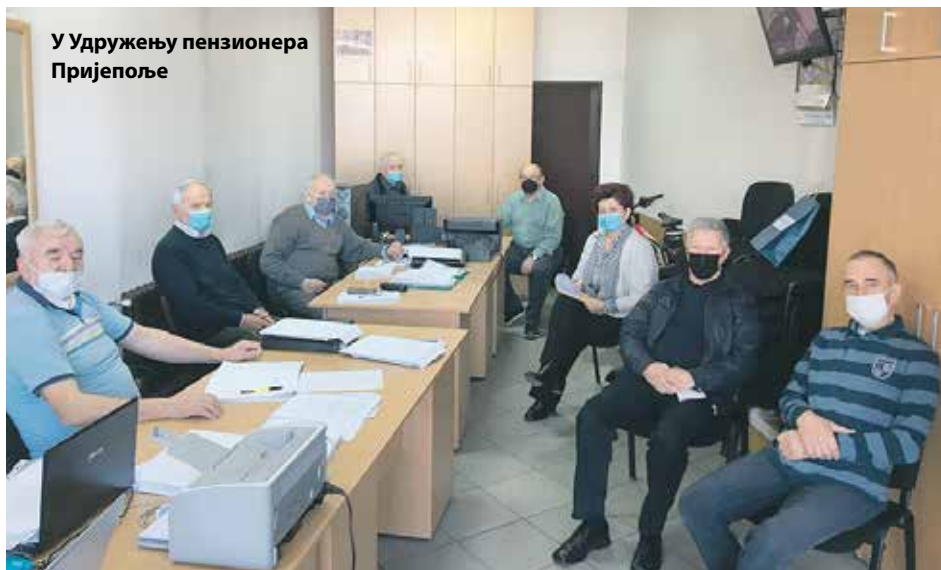
У Удружењу пензионера Пријеполје

У таквој ситуацији удружење се окренуло социјалној димензији рада. Наиме, од укупно 8.200 пензионера у општини Пријеполје, њих 2.300 има најниже пензије (до 15.100 динара). Неке су изузетно мале, свега 3.500-8.000 динара. До 27.700 динара прима 74 одсто пензионера општине. Стога је руководство удружења нормативно регулисало критеријуме и обезбедило помоћ у основним животним намирницама, греву, хигијенским пакетима и средствима за заштиту од вируса, за укупно 790 пензионера, без обзира на то да ли су чланови удружења. За ове намене од донатора је обезбеђено више од милион динара док је