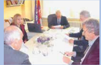
Последњи сусрет са вршњацима из Македоније

Лесковачко удружење старосних пензионера пре почетка пандемије имало је око 17.000 чланова. После годину дана присуства овог вируса, у Лесковцу и Јабланичком управном округу прилично су заустављене активности овог удружења најстаријих, а један број чланова је, нажалост, и преминуо.