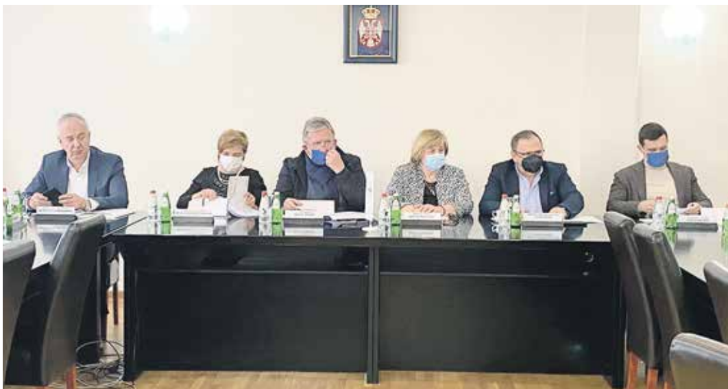
Са седнице Управног одбора Републичког фонда за пензијско и инвалидско осигурање

Чланови УО такође су усвојили и Стратешки план РФ ПИО за период 2021-2023. године. Фонд као институција која обавља веома важну делатност и на коју су усмерени практично сви грађани Србије, мора да има документ у коме су садржани и јасно дефинисани циљеви и оперативне активности, као основни оријентир за рад и даљи развој. Стратешки план за наредни трогодишњи период базиран је на одређењу Фонда за даљу технолошку модернизацију и подизање квалитета услуга које се пружају грађанима, приближа-