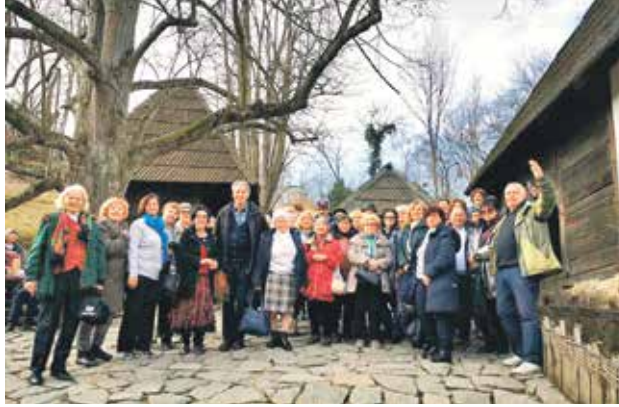
Са излета у Тршић у јануару 2020.