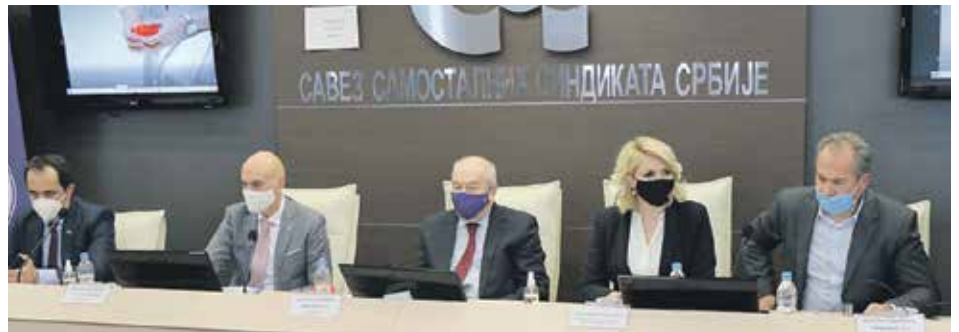
Министарка Дарија Кисић Тепавчевић на округлом столу о синдикалном покрету

Како је нагласила, пред Министарством за рад, запошљавање, борачка и социјална