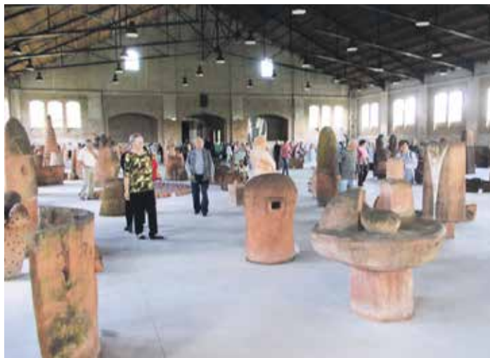
Кикиндско, а светски значајно: галерија скулптура у теракоти извајаних у атељеу Интернационалног симпозијума „Тера“

Овдашње Удружење пензионера већ деценијама успешно промовише завичајне знаменитости, у складу са својим могућностима и богатим искуством. Удружење је редован организатор групних посета исписника из Србије и из Темишвара. Поред тога што за њих организује колективне обиласке историјских и културних споменика и препоручује их за разгледање, Градско удружење је