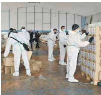
Паковање пакета за најугроженије Лесковчане

Пакети су најпре подељени у подручјима погођеним поплавама, односно у Великом Трњану, Рудару, Паликући, Шаиновцу, Турековцу, Бибишту, Синковцу, Винарцу, Прибо-