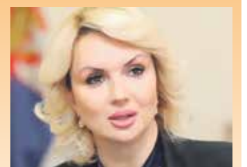
Министарка рада Дарија Кисић Тепавчевић

– Држава и те како мисли на најугроженије категорије становништва, на све који су годинама имали неповољан положај на тржишту рада. И у овим тешким околностима епиде-