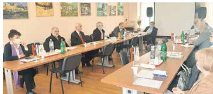
Основан Књижевни клуб Покрета трећег доба

Председник Извршног одбора Покрета трећег доба Срби-