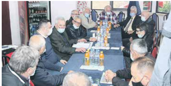
Са оснивачке скупштине Савеза пензионера КиМ

Удруживањем у Савез више од 36.000 српских пензионера на Косову и Метохији отвара себи