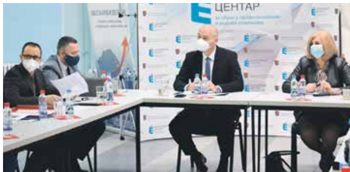
Са Конститутивне седнице Покрајинског савета за запошљавање

Савет је основан као привремено радно тело Покрајинске владе ради давања мишљења и препорука у вези са питањима од интереса за унапређење запошљавања у АП Војводини, и то о плановима запошљавања, програмима и мерама активне политике запошљавања, прописима из области запошљавања и другим питањима из ове области. Савет чине чланови Покрајинске владе, представници синдиката, послодавца и институција, односно, сви релевантни социјални партнери чија је намера да се на најбољи могући начин, а сходно националној стратегији запошљавања, заједно са Националном и Покрајинском службом