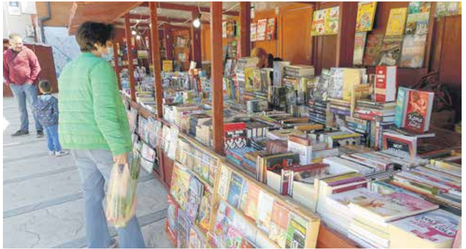
Сајам књига и графике окупио 15 излагача из више градова Србије