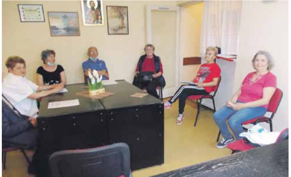
Свих пет председница месних организација пензионера