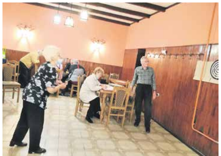
Такмичење у пикаду

– Свим учесницима додељене су захвалнице, јер победнике нисмо посебно проглашавали,