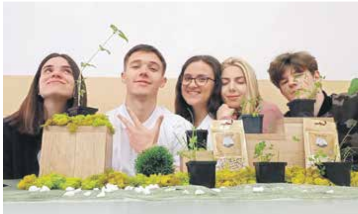
Чланови ученичке компаније „БиоФилтер“

Ови ученици кажу да се само у Србији дневно одбаци око 27 милиона опушача, док је то на годишњем нивоу 26,5 милијарди. У свету тај број је знатно већи. Истраживања показују да