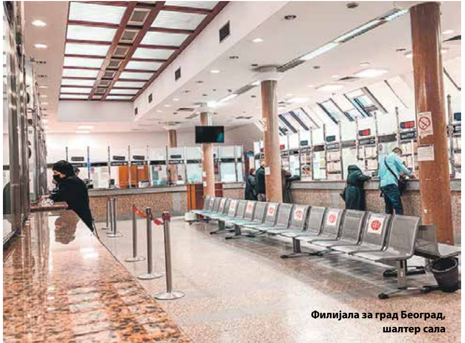
Филијала за град Београд, шалтер сала

Имајући у виду да подносиоци пријава већ поседују квалификоване електронске сертификате, Фонд ПИО, почев од 1. 7. 2021. године више неће подносити преко портала ЦРОСО пријаве за обвезника подношења пријаве које су поднете у законом прописаном року. Изузетно, Фонд ће наставити подношење пријаве и након овог датума