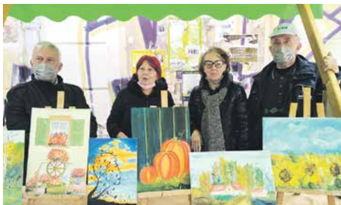
Инвалиди рада Панчева изложили своја уметничка дела на Базару