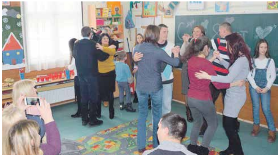
Осмомартовска приредба у Дневном бораку „Зрачак“

Током дводеценијског рада све активности су осмишљаване и реализоване руководећи се, пре свега, људским правима, посебно правима припадника такозваних рањивих друштвених група. Од 2001. Удружење је реализовало више од 40 пројеката, уз подршку домаћих и страних донатора, и у сарадњи са бројним организацијама и институцијама из локалне заједнице и шире. Учествовали су у припреми и изради свих локалних стратешких докумената, иницирали и покретали формирање бројних скупштинских тела. Успели су у намери да повежу све релевантне локалне институције и организације у решавању положаја припадника рањивих социјалних група. „Златиборски круг“ је посебно препознатљив по хуманитарним акцијама кроз које