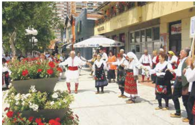
Коло ветерана на последњем фестивалу фолклора