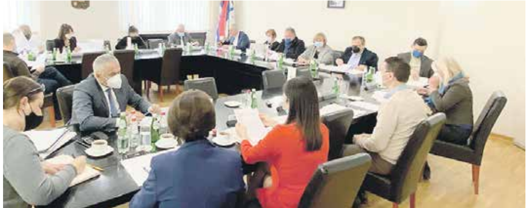
Са једне од претходних седница Управног одбора РФ ПИО

Н а седници Управног одбора Републичког фонда ПИО, одржаној 26. маја ове године, усвојени су Извештај о раду РФ ПИО за 2020. годину и Извештај о финансијском пословању Фонда за 2020. годину.