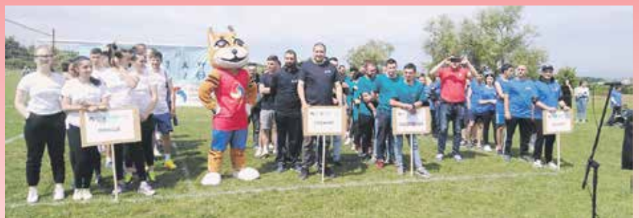
Учесници надметања у селу Ладовица

Младе такмичаре из седам села (Ладовица, Бољаре, Стајковце, Гложане, Орашје, Кукавица и Доња Ломница) који су се пласирали за финално општинско такмичење поздравили су председник Спортског