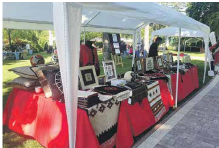
Репрезентативна изложба, сведочанство умећа српских жена