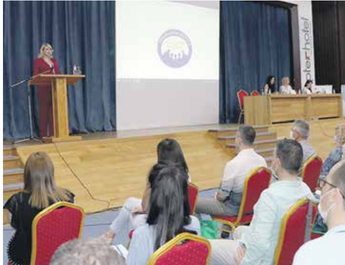
Министарка Кисић Тепавчевић на конференцији у Врњачкој Бањи

Због свега тога, како је истакла, приоритет када су у питању установе социјалне заштите биће јачање кадровских капа-