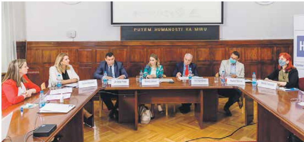
Са завршне конференције у оквиру пројекта „Јачање међугенерациске солидарности“, одржане у Црвеном крсту Србије