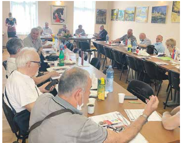
На Скупштини ПТДС највише се говорило о програму и организацији предстојеће Олимпијаде

Централној манифестацији у Врњачкој Бањи претходиће низ