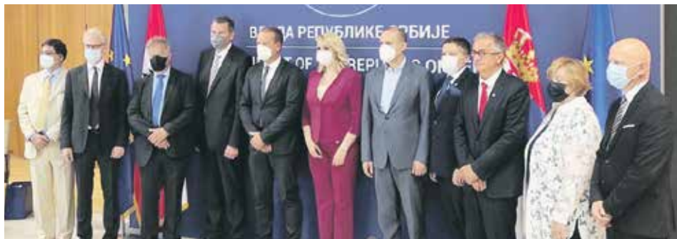
Са потписивања уговора

Министарка Кисић Тепавчевић је нагласила да је ово први пут да један рехабилитациони центар у Србији потписује уговор са иностраним државним пензијским фондом