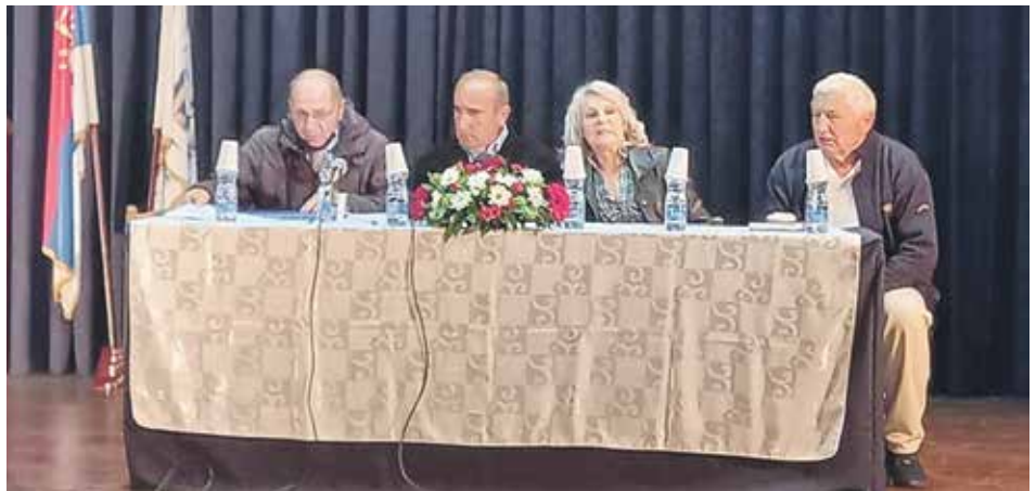
Редовна годишња Скупштина ариљских пензионера

За овогодишњу рехабилитацију у бањама Србије о трошку Фонда ПИО ариљском удружењу пензионера пријавило се 362 кандидата, а њих 53 је остварило то право, каже Крчевинац.