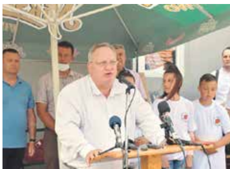
Градоначелник Лесковца Горан Цветановић