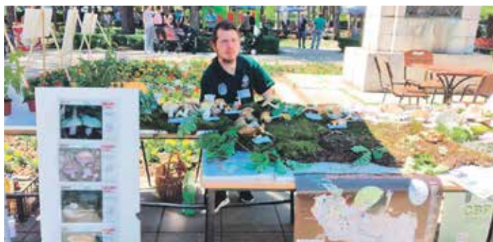
Поред гљива, изложено и око 200 фотографија биљака овог краја

Све је красила и изложба са око 200 фотографија биљака карактеристичних за овај предео – то је било посебно интересантно за госте из других крајева Србије – а поред кулинар-