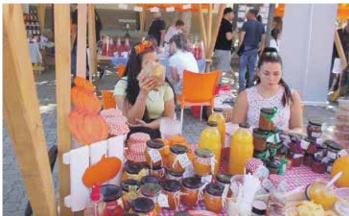
Нико не одолева изазову примамљивог залагаја

Занимљивост овогодишње светковине представља и податак да је традиционални „банатски фруштук“ (доручак) плануо већ првог дана сервирања на Градском тргу. Другог дана је такође тражено репете специјалитета не само од бундеве, већ и од других слатких и сланих надева. Поред већ