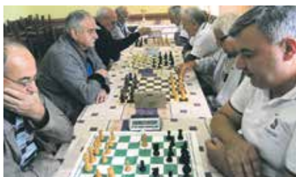
Меморијални турнир „Душан Алексић“

Руководство Удружења пензионера општине Велика Плана до сада је својим члановима испоручило 1.200 тона угља, док ће у наредном периоду бити испоручено и 400 кубних