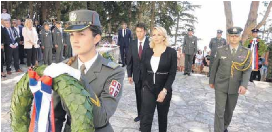
Министарка Дарија Кисић Тепавчевић предводила државну комеморативну свечаност на острвима Крф и Видо

Обележавању годишњице искрцавања српске војске на острву Видо присуствовала је и положила венце и председница Републике Српске Жељка Цвијановић,