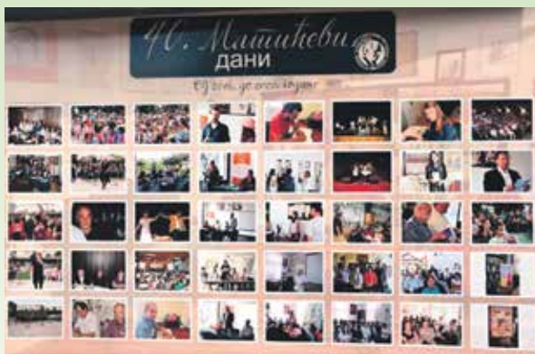
Изложба фотографија „Сећање“