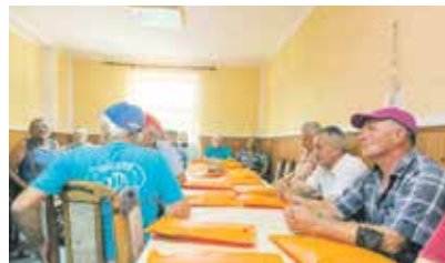
Уручење комплета за бицикл пензионерима у Башаиду

Локална самоуправа у Кикинди обезбедила је 450 комплета – пакета са флуоресцентним прслуцима и сетовима лампи за бицикле, које је поклонила пензионерима на свом подручју. Први контингент од 66 комада