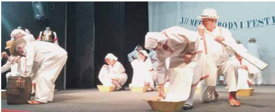
Гости из Куманова извели перформанс „Биљана платно белеше“

Дефиле искусних фолклораша и појаца изворних песама прошао је улицама