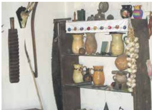
На салашима нису имали струју па су у ћуповима држали млеко у шпајзу

Иако на овом и сличним салашима има могућности да се школска деца