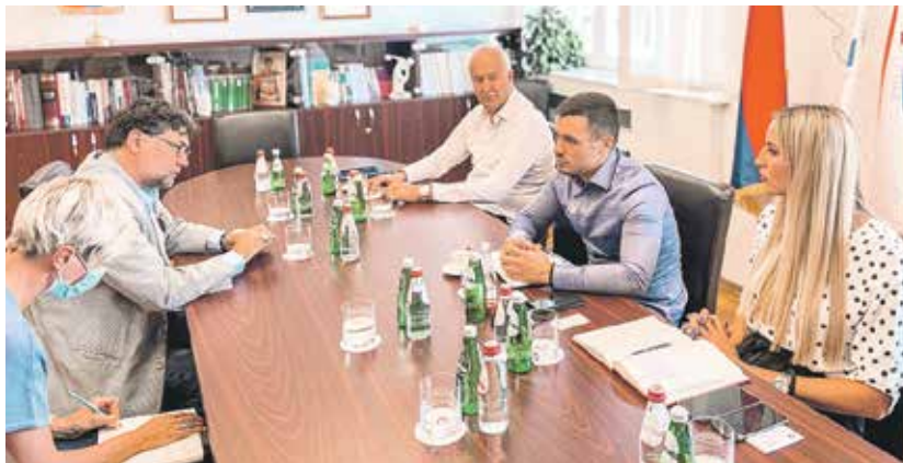
Конструктиван састанак у Дирекцији Фонда ПИО