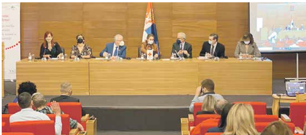
Са конференције у организацији Црвеног крста Србије посвећене спречавању насиља над женама

О значају и резултатима пројекта говорили су амбасадори Аустрије и Аустралије у Београду, представници међународних институција и аустријског Црвеног крста. Догађај је обухватио и неколико панела на којима су учествовали представници јавног и цивилног сектора, независних регулаторних институција, као и панелисти из различитих држава и различитих сфера рада на превенцији насиља над старијим женама.