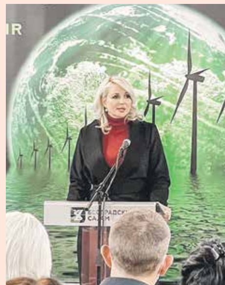
Министарка за рад, запошљавање, борачка и социјална питања проф. др Дарија Кисић Тепавчевић

директно на шалтеру, али је због новонастале епидемиолошке ситуације и Фонд морао да пронађе начин да олакша коришћење својих услуга.