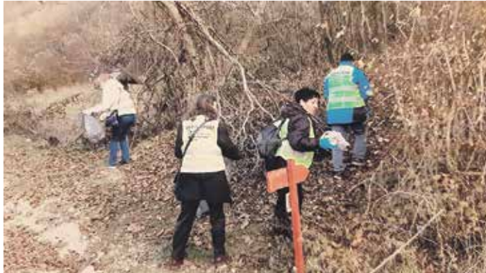
Еко патрола на задатку

Еко патрола ГОП-а организовала је недељу дана касније акцију „Чисто из љубави“ коју је подржао Лидл Србија. На истом задатку еколошке савести и свети нашли су се пензионери и средњошколци, чишћен је терен уз обалу Јерме од Суковског до Погановског манастира, а била је то и прилика да се обиђу светишта. У вечерњим часовима приређена је седенћа са књижевно-музичким садржајем за становнике села Извор.