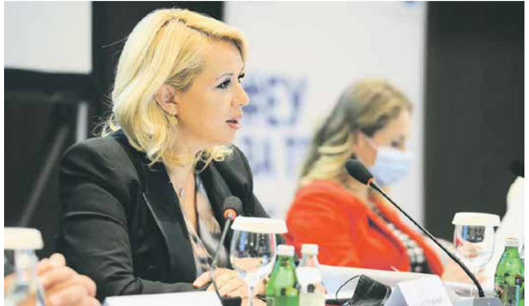
Министарка Дарија Кисић Тепавчевић на конференцији пројекта „ЕУ и Србија – За приступачне јавне установе”

М исија Министарства за рад, запошљавање, борачка и социјална питања је Србија једнаких могућности за све њене грађане, Србија без баријера, рекла је министарка за рад, запошљавање, борачка и социјална питања, проф. др Дарија Кисић Тепавчевић, на завршној конференцији пројекта „ЕУ и Србија – За приступачне јавне установе”. Циљ овог пројекта је да се особама са инвалидитетом олакша кретање и пут до остваривања права.