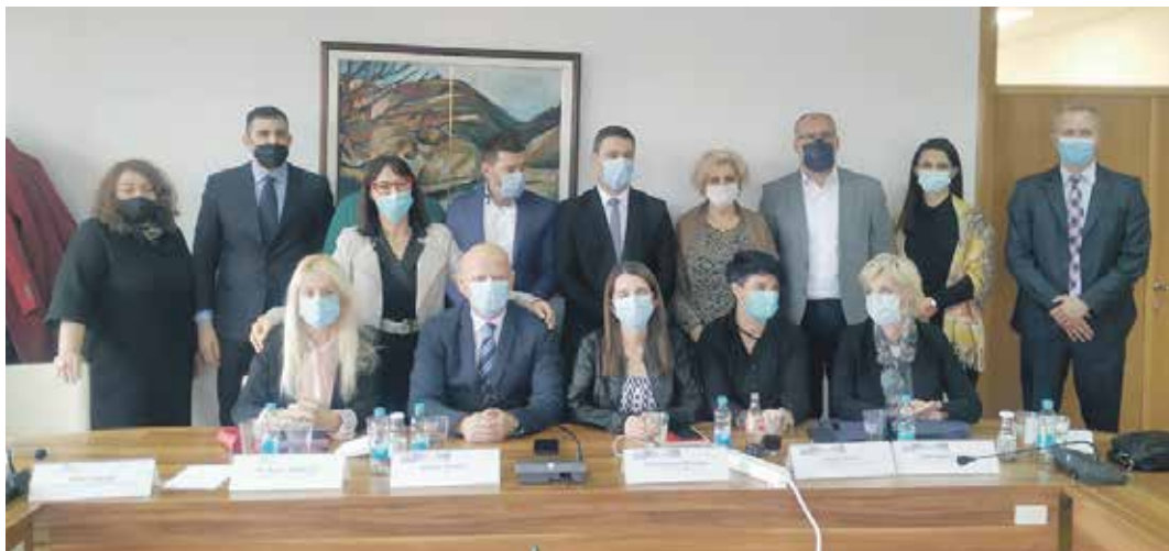
Са разговора у Бањалуци у новембру 2021.

– Имајући у виду да 1. фебруара 2022. ступа на снагу Уговор о социјалној сигурности између Владе Републике Србије и Владе Квебека, у 2021. се интензивно радило на коначном утврђивању двојезичних образаца у области социјалног осигурања, а како би се створили услови да се уговор по ступању на снагу несметано спроводи, са колегама из Квебека одржано је више видео конференција. Важно је истаћи и пројекат EDAS – електронску размену података у области ПИО и здравственог осигурања и здравствене заштите између Аустрије и Србије – чија ће реализација убрзати размену података између институција социјалног осигурања Србије и Аустрије и омогућити бржу обраду појединачних предмета и ефикасније остваривање права. Закључивање тог споразума замениће постојећи начин размене који се заснива на достави докумената у папирном облику, и омогућиће бржу, лакшу и сигурнију размену информација. У вези са реализацијом EDAS пројекта формирано је пет радних група које чине представници свих институција социјалног осигурања, као и управљачка група надлежна за координацију рада радних група и доношење кључних одлука. Одржано је неколико састанака управљачке и појединих радних група, на којима су разматрана бројна питања, а у плану је интензивирање рада током 2022. како би од почетка 2023. могло да се започне са пилот пројектом који ће претходити увођењу