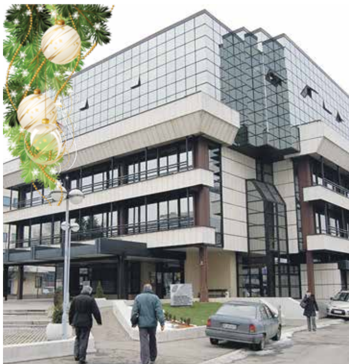
Служба Филијале за град Београд I на Новом Београду

Од укупних расхода и издака за 2022. годину, за исплату пензија и других права из обавезног социјалног осигурања планирано је 771,63 милијарде динара, док средства издвојена за нето пензије износе 631,43 милијарде динара, што пред-