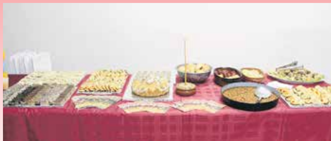
Специјалитети посне српске славске трпезе

У власотиначком селу Конопница, трећег дана манифестације, после литургије у цркви Успења Пресвете Бого-