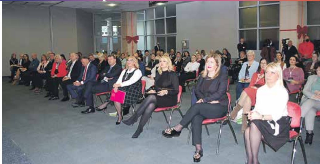
Учесници конференције у Новом Саду посвећене женском предузетништву

У НОВОМ САДУ КОНФЕРЕНЦИЈА О ЖЕНСКОМ ПРЕДУЗЕТНИШТВУ