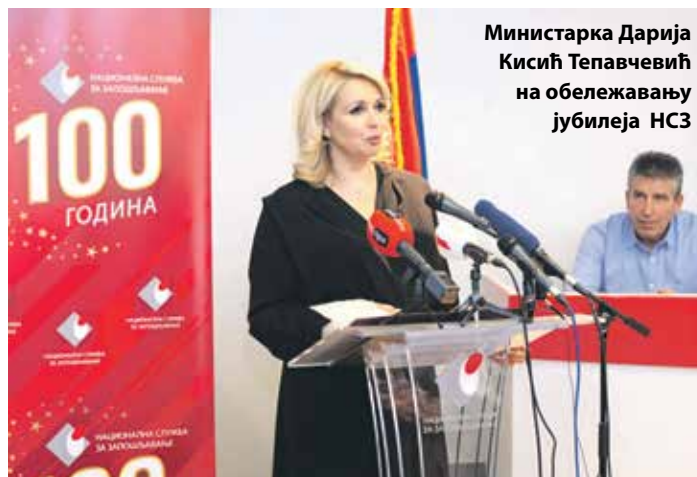
Министарка Дарија Кисић Тепавчевић на обележавању јубилеја НСЗ

– Имамо чиме да се похвалимо за време ових пандемијских година. Једна смо од ретких земаља која је успела да значајно побољша услове на тржишту рада. Сваки месец се бележе бољи резултати у односу на претходни када је у пита-