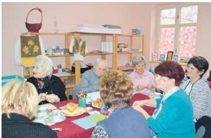
Креативни кутак пружа могућност за дружења