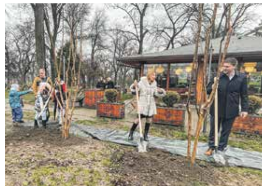
Акција „Међугенерациска подршка природи“ започела у Карађорђевом парку у Београду, настављена у Панчеву, Бору и Смедереву