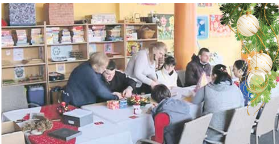
Бројним активностима доказују да су равноправни чланови друштва

– Ми спроводимо програмске активности које су по плану Савеза МНРО Србије. Савез ове године обележава 60 година постојања. Тим поводом смо летос организовали акције на отвореном, али смо сада Дан ОСИ обележили у нашим просторија-