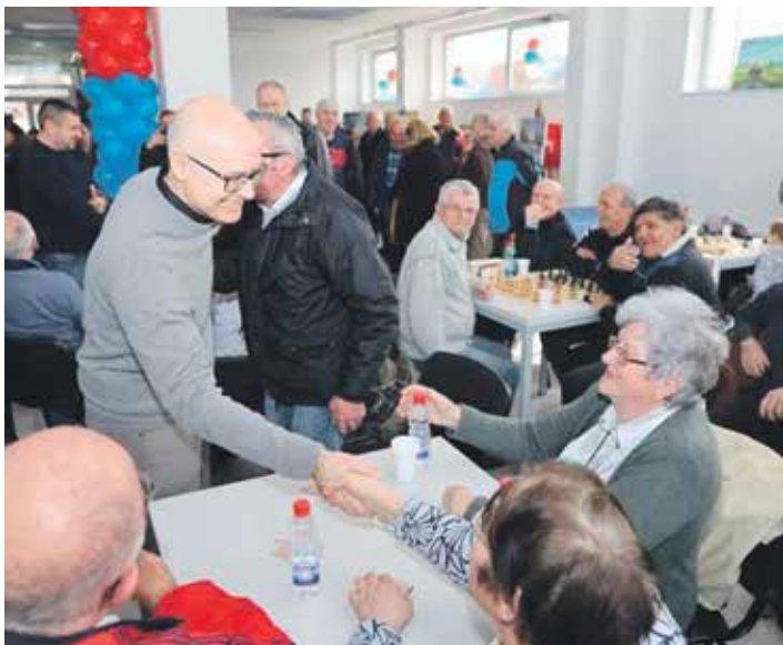
ФОТО: Град Нови Сад