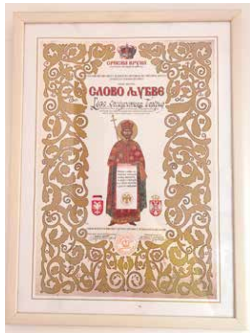
Једно од признања „Гласу осигураника“ за неговање српског језика и традиције

Иако се у причи о Ћирилу и Методију често мешају историја и легенда, не доводи се у питање њихов допринос стварању словенске писмености, чији почеци нису нестали у тмини времена, већ се сасвим јасно разазнају, па су познате чак и прве речи записане новим писмом: „искони бе слово“ – у почетку беше реч.