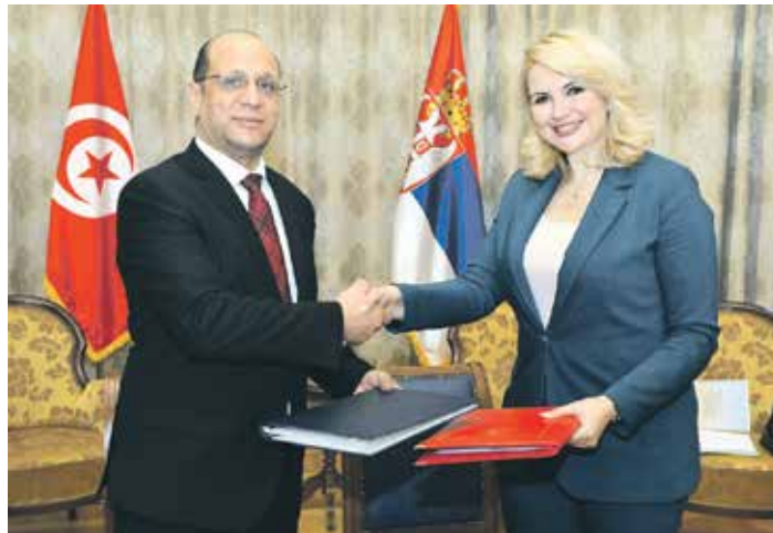
Споразум потписали министри Дарија Кисић и Малек Езахи

Кисић је нагласила да Споразум о социјалној сигурности између Србије и Туниса доноси многобројне бенефите за грађане обе земље, који ће бити