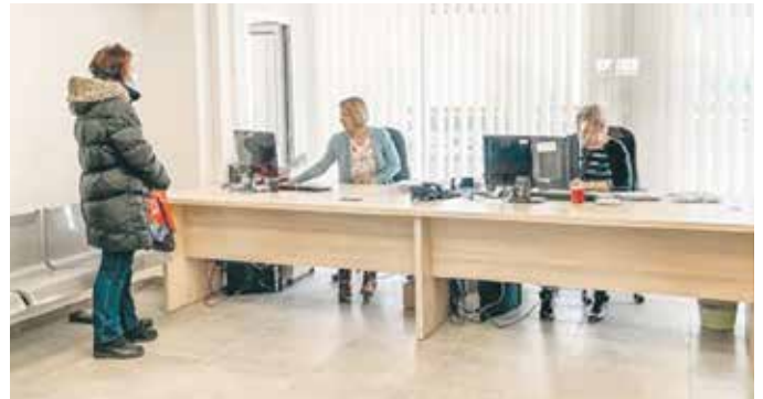
Шалтер сала отворена за странке сваког радног дана

корисника и осигураника које опслужује, једна је од већих служби Фонда ПИО. У њој раде 22 запослена који тренутно обављају послове за 29.314 осигураника и 12.061 корисника права, односно пензионера. Канцеларија у Инђији покрива 16.208 осигураника и 8.577 корисника. У Инђији се налазе