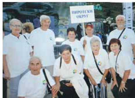
Успешни учесници Олимпијада трећег доба

Редовно за своје чланство набављају огрев по нешто нижим ценама. За оне са ниским примањима повремено обезбеђују пакете са намирницама и средствима за хигијену.