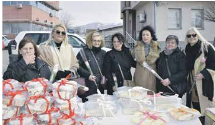
Чланице Удружења „Авенија”, хуманитарни базар почетком марта 2022. у Грачаници

– Када сам остала без посла, без икаквих средстава за живот, ни једног тренутка нисам помишљала да напустим Косово и Метохију. Мој циљ је био да око себе окупим жене са сличним проблемима и да тако окупљене у Удружењу створимо услове за рад, да обезбедимо средства за покретање породичног бизниса, а све у циљу економског оснаживања жена и њихових породица, као и активног укључивања у остале сфере живота. Желели смо