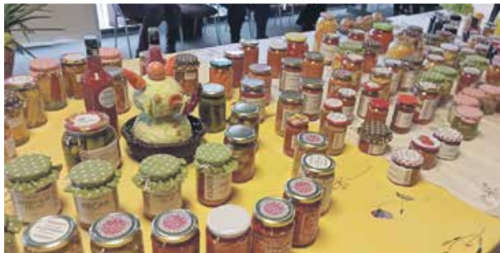
Циљ – очувати укус природе

Удружење за неговање традиције „Извор“ и Удружење произвођача поврћа „Укус природе“ из Књажевца потписали су меморандум о пословно-техничкој сарадњи. Идеја да се мали произвођачи удружују и пласирају своје производе настала је захваљујући великој потражњи здравих, домаћих производа, као и ручно рађених предмета.