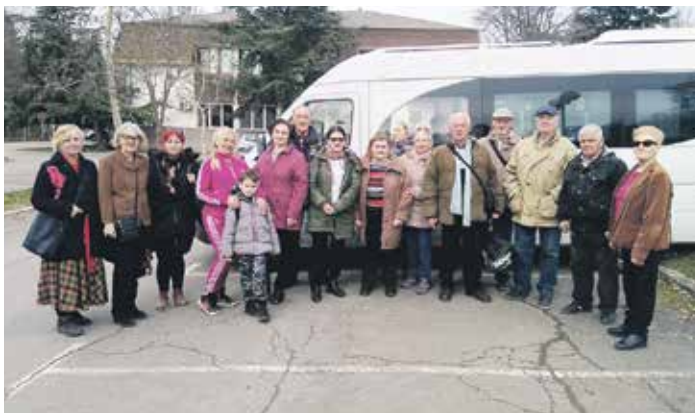
Панчевачки инвалиди рада на излету у Врднику

Министарка за рад, запошљавање, борачка и социјална питања, проф. др Дарија Кисић, посетила је јесенас Белу Цркву и са надлежнима из локалне самоуправе разговарала о унапређењу услуга социјалне заштите и побољшању положаја ОСИ у јужном Банату. Тада је обавестила и представнике удружења ОСИ из Панчева, Вршца, Пландишта, Опова, Ковачице, Алибунара, Ковина и Беле Цркве да је за унапре-