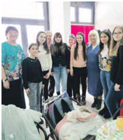
Ученице награђене на литерарном конкурс у поводом Осмог марта