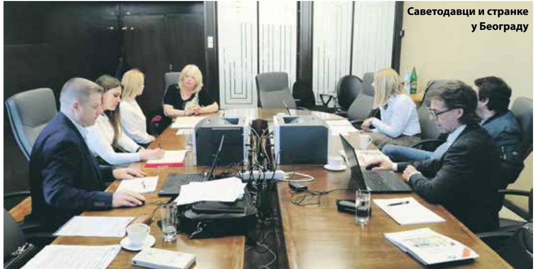
Саветодавци и странке у Београду

– Најчешћа питања која су грађани постављали односила су се на услове за остваривање права на пензију, затим на потврде о стажу, односно, обавештења о периодима осигурања и трајању осигурања у Аустрији код оних који ће услов за пензију испунити у наредним годинама. Две странке су у Новом Саду на лицу места попуниле и захтев за остваривање права на пензију а колеге из аустријског Завода су их примиле. Дани разговора су значајни не само за странке, већ и за нас јер су нам пружи-