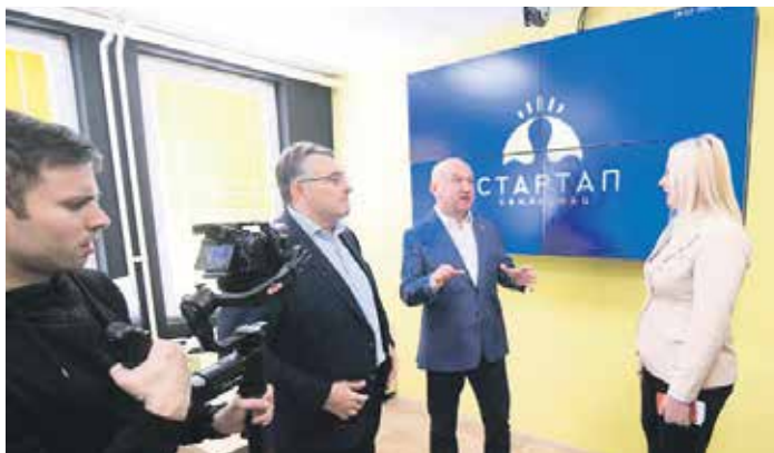
Са отварања Регионалног стартап центра

– Влада Републике Србије подржала је овај пројекат са 46 милиона динара. Сви који желе