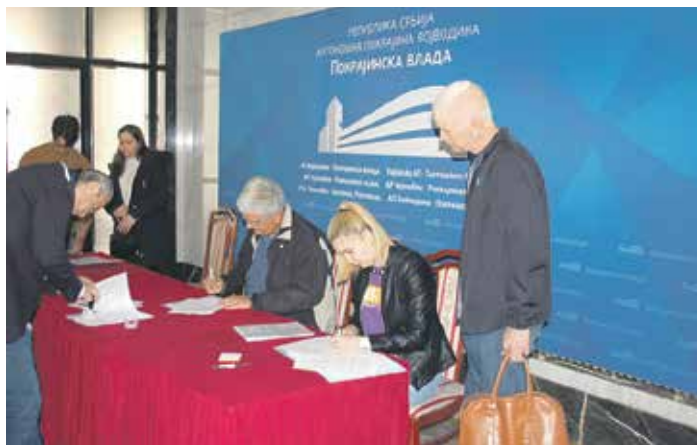
Корисници субвенција потписују уговоре

– Позивам пољопривреднике да аплицирају за средства која смо определили путем овогодишњих конкурсних линија.