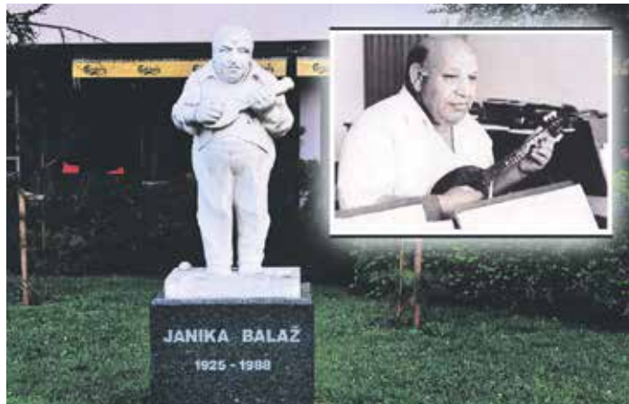
Нови Сад подигао споменик легендарном тамбурашу с Петроварадина