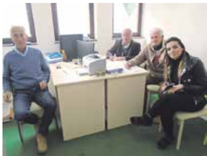
Део руководства Удружења пензионера

На седници Скупштине Удружења пензионера у Сјеници, одржаној 7. априла, поред разматрања извештаја о раду и материјално-финансијском пословању, посебно је истакнуто повећање броја чланова тако да је тренутно у Општинску организацију учлањено 1.554 корисника пензија. По основу чланарине, Општинска организација је остварила приход од 785.000 динара, док су највећа ставка у расходима били пакети солидарне помоћи у износу од 302.845 динара.