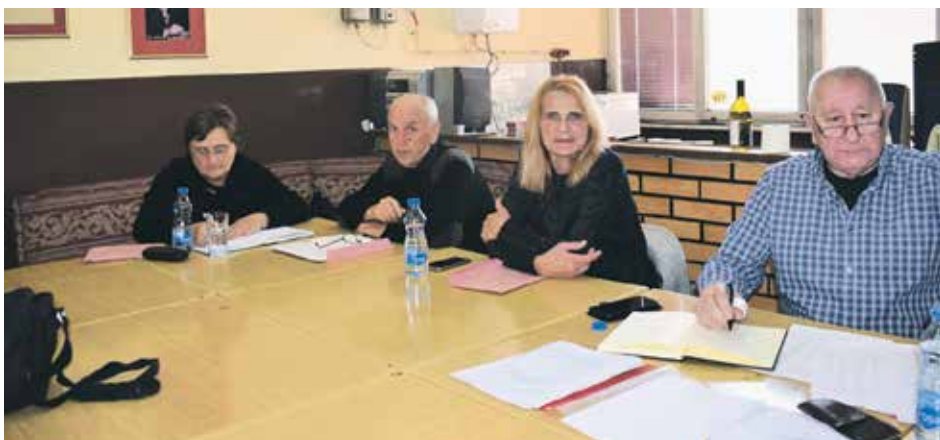
Радно председништво Скупштине Удружења пензионера Бајина Башта

Доста активности било је и у спортским и рекреативним областима. Учешће у