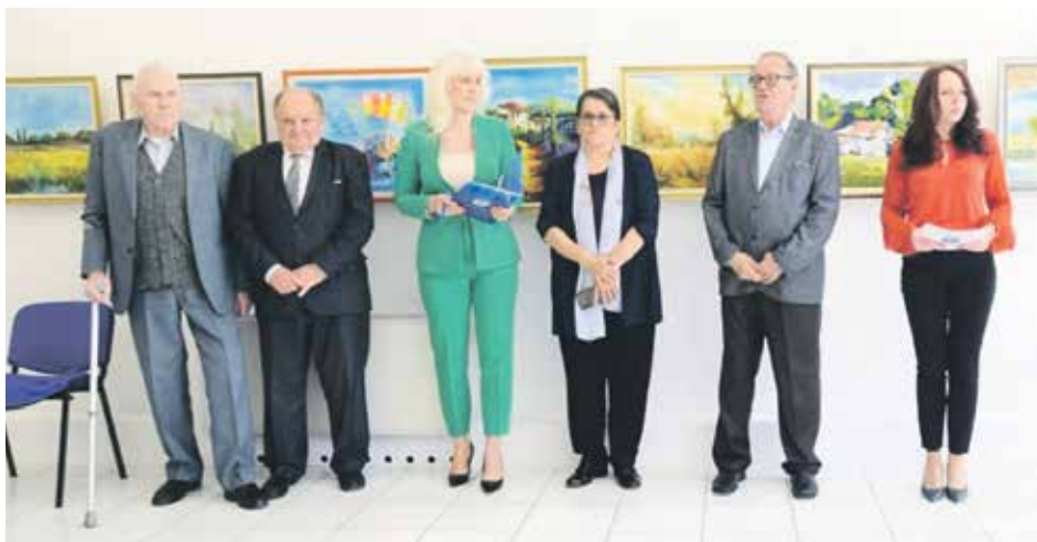
Руководство СИР Војводине и гости на изложби