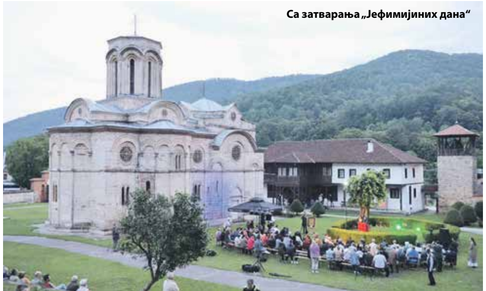
Са затварања „Јефимијиних дана“