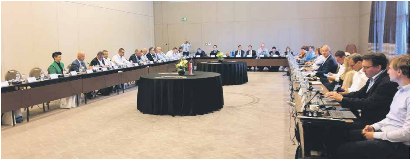
Са састанка директора фондова држава са простора некадашње СФРЈ

Традиционални 12. Сусрети директора фондова/завода за пензијско и инвалидско осигурање држава насталих на простору СФРЈ ове године одржани су у Републици Хрватској, у Дубровнику, од 8. до 10. јуна. Састанак директора носилаца обавезног пензијског осигурања тематски је био фокусиран на међусобно упознавање са изменама у законима којима је регулисана материја пензијског и инвалидског осигурања, праћење промена у окружењу и решавање актуелних питања која се односе на спровођење међународних споразума о социјалном осигурању, као и размену података о ефектима билатералне електронске размене података. Основна тема састанка била је „Рад и коришћење пензије“, односно законски основи за могућности пензионера да се радно ангажују.