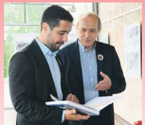
Министар Томислав Момировић присуствовао свечаности

је добровољним радом. Четвртину од укупне трасе чинили су тунели, укупно 254, а неприступачан терен премошћен је са 234 моста. Кроз рад уједињена је сва омладина – школска, студентска, радничка и сеоска. Пионири су били водоноше. Учествовало је 12.345 бригадира подељених у 234 јединице. Први воз који се у правцу приморја упутио био је Титов „Плави воз“, 1976. године.