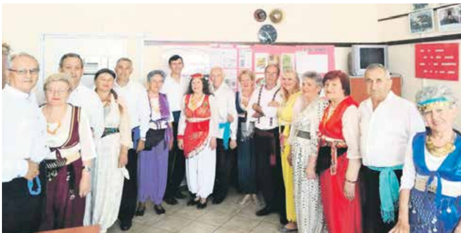
Најбољи – Фолклорна секција Удружења пензионера Лесковац