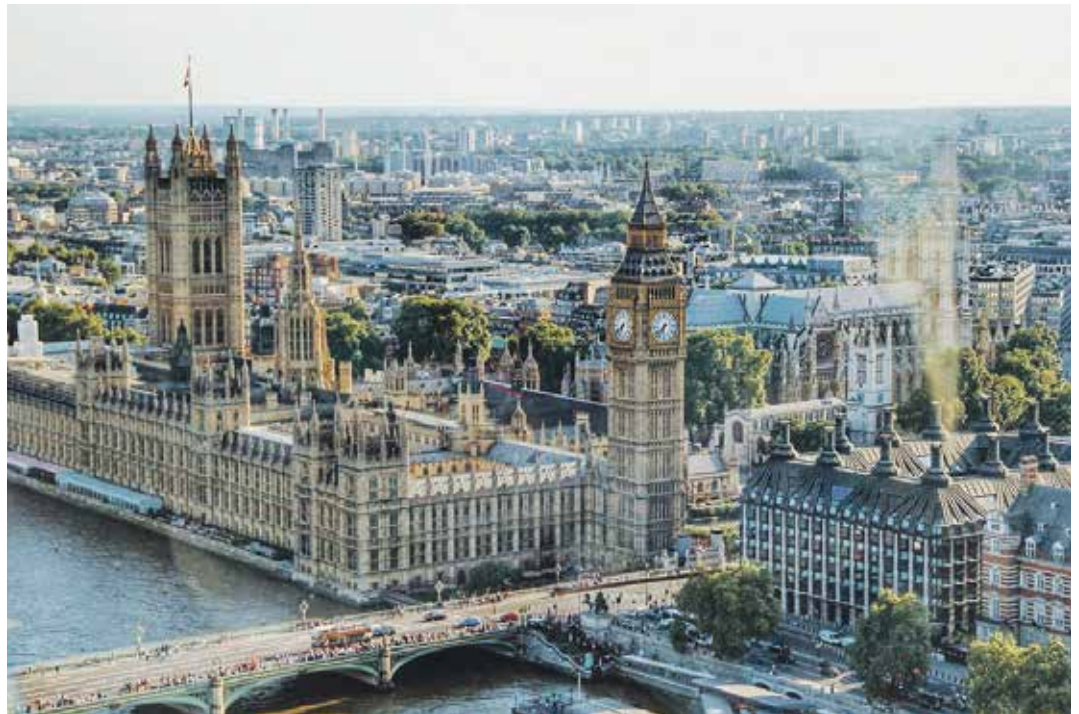
У Великој Британији хиљаде радника тестирају 32-часовну радну недељу

Највећи експеримент који је довео и до најшире примене