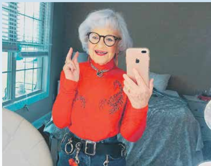
Хелен Рут Елам, познатија као baddiewinkle, има „скромних“ 3,8 милиона пратилаца на Инстаграму

располагању и има и најстарију структуру корисника – чак 41 проценат оних који га користе старији су од 65 година. Јесте, међутим, донекле изненађење да Јутјуб користи око 60 одсто оних са 56 и више година, те да и Инстаграм, „мрежа младих“, има све више присталица међу најстаријима који, испоставило се, такође радо каче своје слике са одмора или дружења са пријатељима. Постоји чак и нови тренд „гранфлуенсера“ – једна таква Инстаграм инфлуенсерка има 94 године и 3,8 милиона пратилаца.