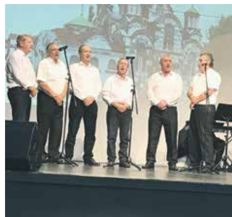
Певачка група пензионера „Младост“ из Штрпца

И овогодишњи грачанички фестивал успео је да од заборава отргне неке од најлепших песама са Косова и Метохије, које данас радо и успешно изводе и познати естрадни уметници и извођачи, што је такође био један од циљева покретања и оснивања ове јединствене културне манифестације. Фестивал је и својеврсни доказ успешне међугенерациске сарадње