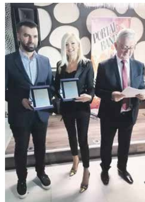
Пензионери Рашке обележили свој дан