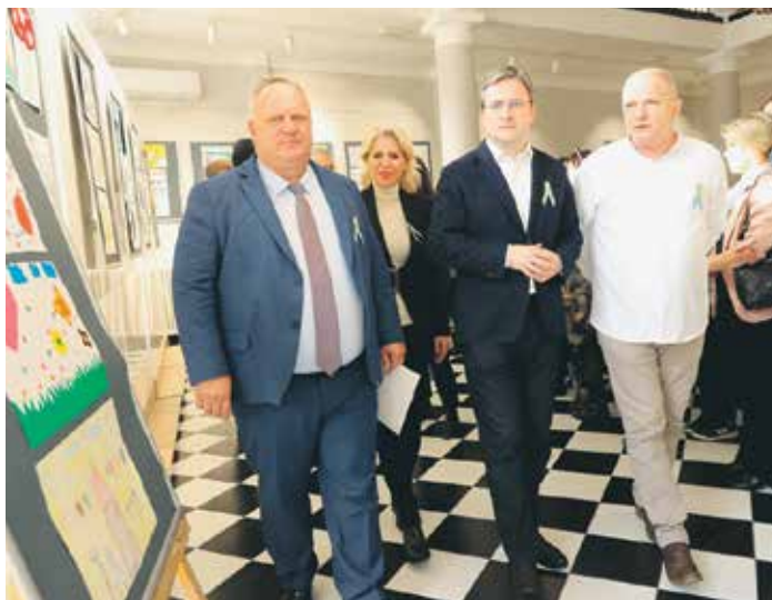
Министар Никола Селаковић у Лесковцу обишао изложбу радова ОСИ

Селаковић је у Лесковцу обишао Спортско-рекреативни центар „Дубочица“ који је, уз подршку Министарства, први пут од оснивања 1983. године постао доступан особама са инвалидитетом захваљујући уградњи лифта и столице за базен. Министар је захвалио представницима Удружења оболелих од мултипле склерозе Лесковца који су иницирали решавање питања приступачности те установе чиме су својим члановима, али и другим особама са инвалидитетом, омогућили да несметано користе садржаје Центра. Никола Селаковић је нагласио да само одговорним присту-