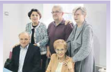
Г. О. Учесници свечане седнице

Након радног дела састанка организовано је пригодна дружење уз музику.