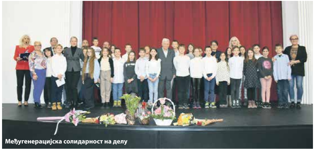
Међугенерациска солидарност на делу