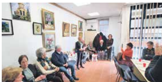
Прва изложба слика уметника Удружења

Овај „простор са душом“ тај дан нису красиле само слике, већ и смех, шале, разговори и планови за будућност. Присутни, сви млади духом, показали су још једном да су године само број и да се живот може живети пуним плућима и у трећем добу. Г. О.