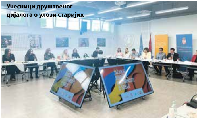
Учесници друштвеног дијалога о улози старијих

шку Популационог фонда УН у Србији, о улози компанија у заштити и промоцији људских права и социјалној инклузији у нашој земљи разговарали су, поред представника владе, и представници приватног и невладиног сектора.