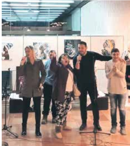
Са отварања изложбе радова ОСИ

– Имали смо различите трибине у којима сам са задовољством учествовала и на којима сам разне теме обрадила како бих нашим члановима удружења приближила оне које се тичу психосоцијалне подршке, али и са медицинског аспекта и нових видова терапије мултипле склерозе. То је болест са хиљаду лица и терапијски је још увек у фази откривања нових опција, са акцентом последњих година на имуномодулаторну терапију. Чланови удружења су корисни чланови друштва, без обзира на ову реч