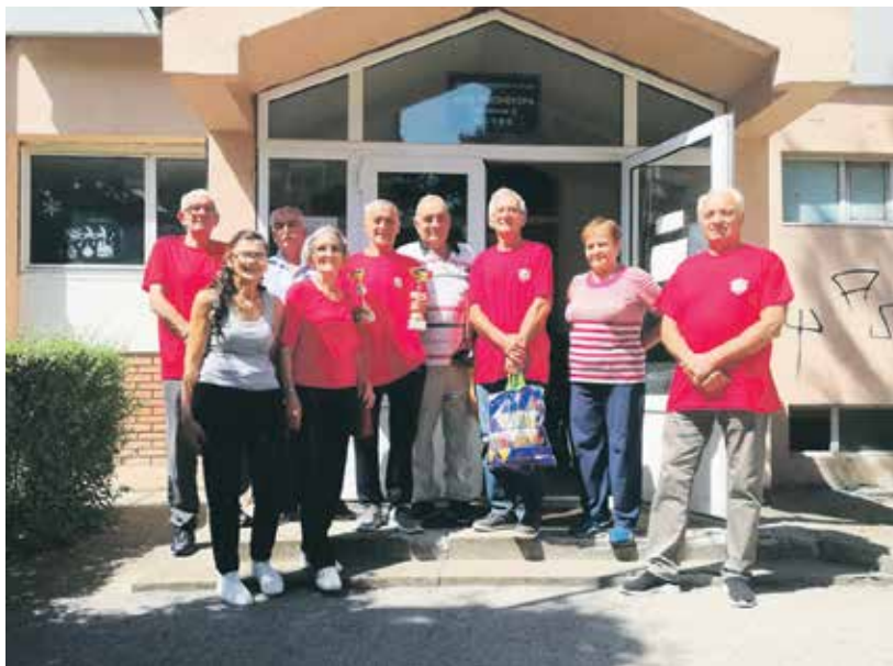
На регионалном такмичењу у Чачку Ивањичани заузели друго место

– Интересовање за овај вид помоћи је било велико, као и прошле године. На располагању смо имали 360.000 динара и купили смо 267 хуманитарних пакета вредности око 1.200 динара. Из нашег фонда солидарности издвајамо средства за помоћ најугроженијима у виду намирница. Помоћ је првенствено