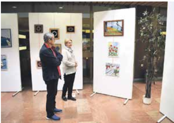
Изложени сликарски радови