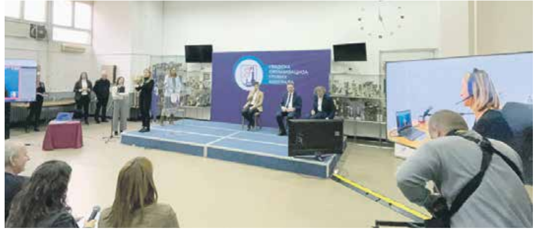
Презентацији апликације присуствовала и премијерка Ана Брнабић