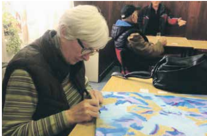
Потписивање јер слике воли и да поклони