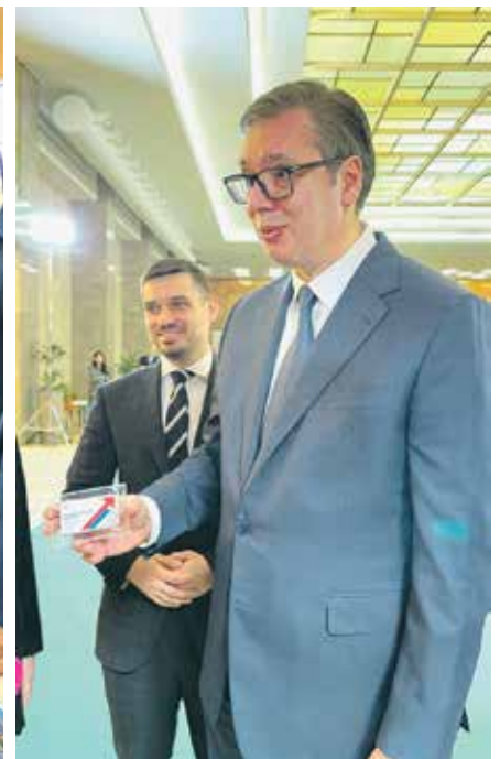
Александар Вучић и Реља Огъеновић представљају медијима Пензионерску картицу