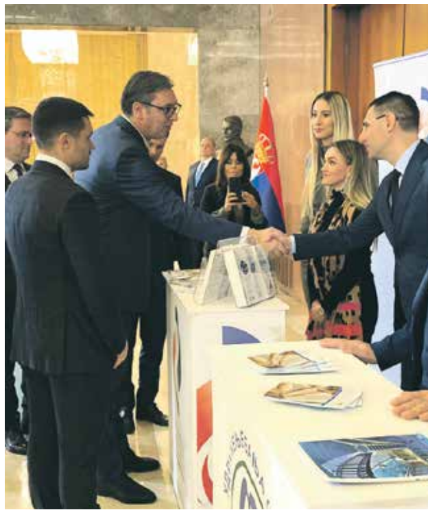
Председник Вучић на штанду Фонда ПИО

Држава ће, како је нагласио, настојати да обезбеди што више фирми које ће на своје услуге давати попусте уз Пензионерску картицу. Председник је најавио и да ће се интензивније радити на превенцији болести, додавши да разуме да