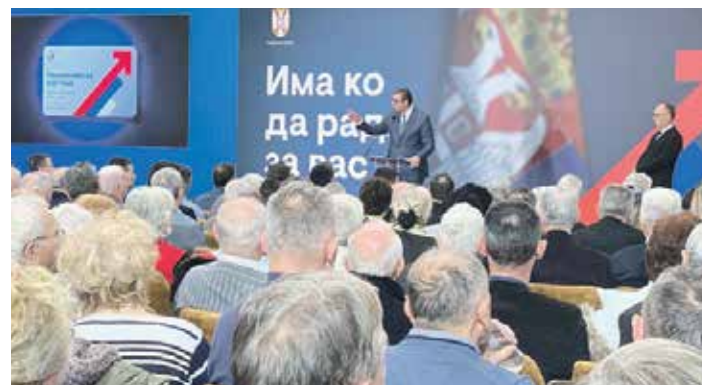
Председник Александар Вучић говори о погодностима које ће пензионери моћи да користе у наредном периоду

већина људи иде у Дом здравља обично у последњи час, те да ће баш из тог разлога у 50