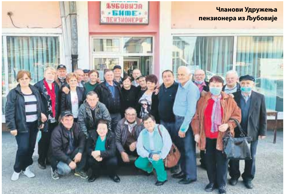
Чланови Удружења пензионера из Љубовије

– Обележили смо новогодишње и божићне празнике, а за православну Нову годину дошли су нам гости из Пецке и Осечине. Традиционално организујемо Светосавски турнир у шаху, са 60 учесника, на коме су играла и четири велемајстора. Презадовољан сам бројношћу наших чланова и испољеном енергијом, а у томе посебно предњаче жене. Свакодневно зову, интересују се за