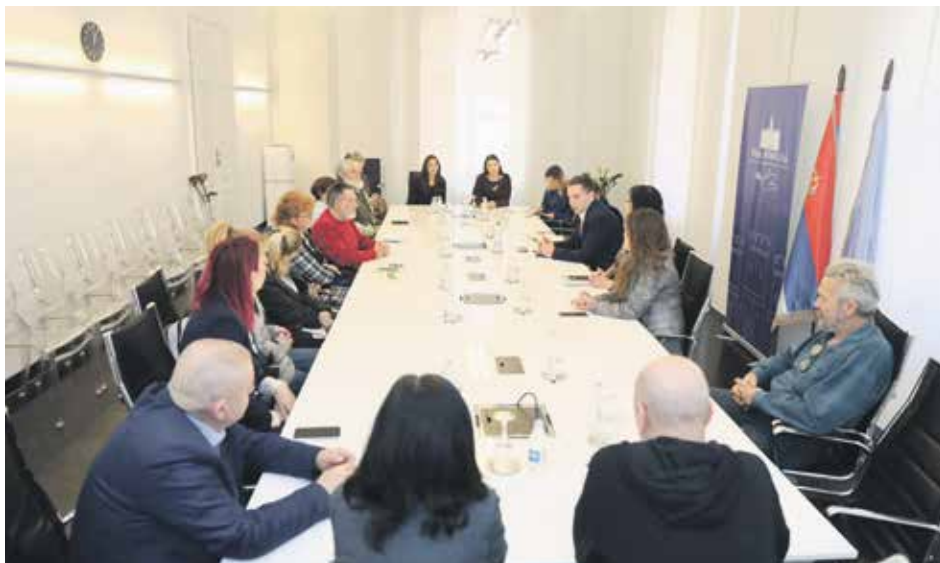
Представници ОСИ на састанку у Градској кући

Црнобарац је подсетио на то да је Заштитник грађана прошле године Новом Саду