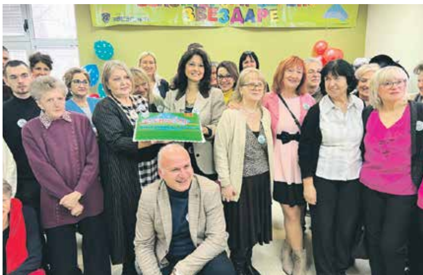
Дванаести рођендан Волонтерског сервиса

ПРЕДСТАВНИЦИ ГОП-А СА ПРЕДСЕДНИКОМ ИО БАНКЕ ПОШТАНСКА ШТЕДИОНИЦА