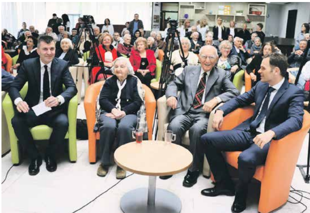
Министри Синиша Мали и Зоран Ђорђевић са корисницима дома Бежанијска коса

– Намера нам је да модификујемо ту формулу и да пензије буду још веће. Циљ нам је 2025. година и зато је важно да наставимо да се одговорно понашамо према нашим јавним финансијама, да нам долазе нови инвеститори, да градимо нове аутопутеве и нове фабрике, а све то како бисмо имали више новца у буџету. Циљ нам је да 2025. године просечна пензија у Србији буде око 440