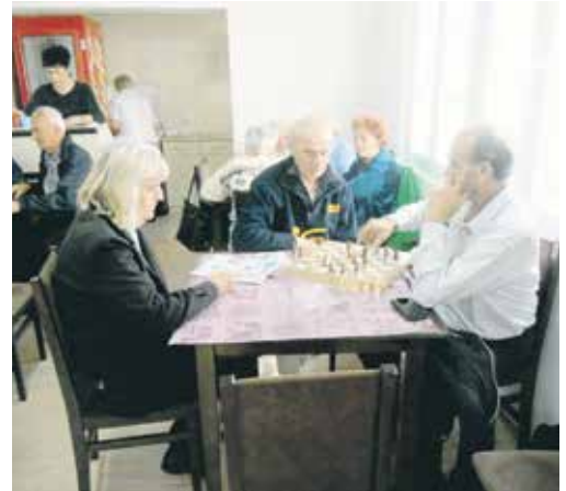
Средства за реализацију овог пројекта обезбеђена су у буџету града Ниша.

Град Ниш ће ове године финансирати и учествовати у пројекту „Да стари не буду сами“ који је намењен корисницима старијим од 60 година. Носилац пројекта, чија је вредност 1,8 милиона динара, јесте Геронтолошки центар, а циљ је да се код старих смањи осећај социјалне искључености, усамљености и да се подстакну на међусобно дружење. Пројекат ће бити реализован у наредних годину дана, у виду дневног боравка за старе особе у Геронтолошком центру и укључиваће бројне креативне, спортске и друге активности корисника, као и прегледе психолога и психотерапеута. Најважније од свега је дружење и боравак у окружењу са својом генерацијом, истичу у градској Скупштини. Наглашавају да је Геронтолошки центар у Нишу многе од ових активности и до сада успешно обављао, али је град желео да се укључи и све то подигне на виши ниво.