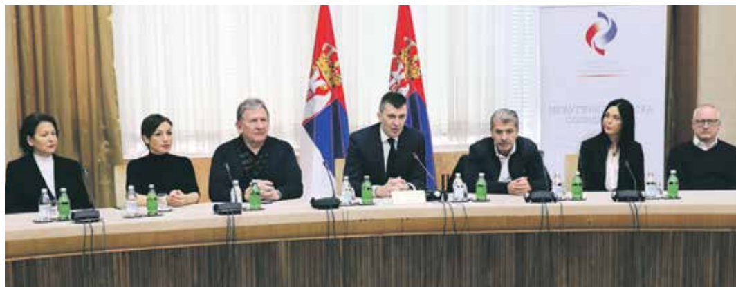
Министар Зоран Ђорђевић на представљању резултата пројекта о међугенерациској сарадњи

Он је захвалио Фонду ПИО и учесницима пројекта и истакао