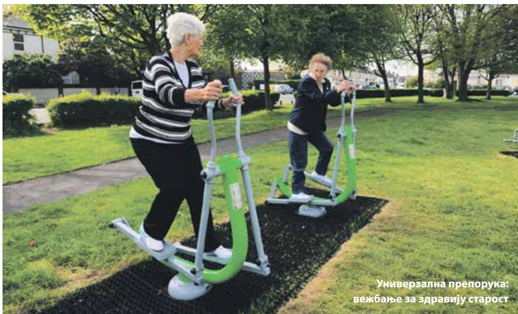
Универзална препорука: вежбање за здравију старост

Многа од тих стања повезана су и са условима живота, при чему до изражаја долази огромна неједнакост између појединих