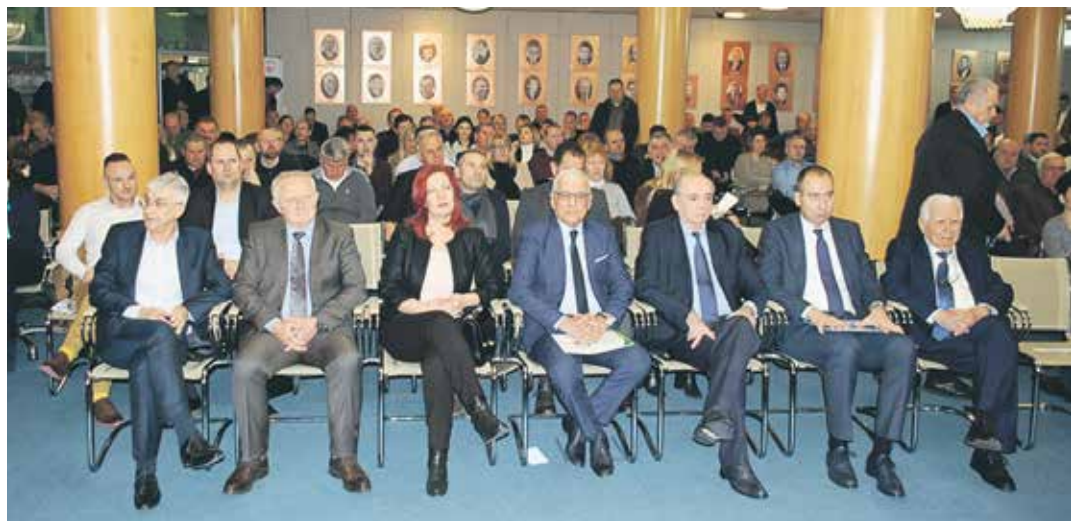
Учесници конференције о улагањима у задруге

– Сада први пут имамо бесповратна средства за улагање у задругарство. Задругарство није успутна носталгија, него императив времена. Данас задруге представљају репрезентативног партнера за локалне самоуправе, за покрајине и државу. Када је реч о корпорацијама, оне морају знати да на супротној страни имају добро организовану задругу – истакао је Кркобабић и додао да задругарство