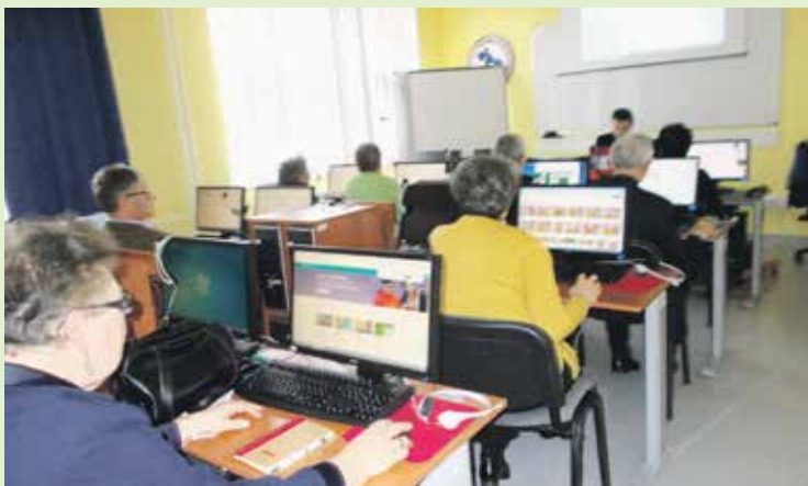
За обуку за рад на рачунарима пријавило се 80 пензионера