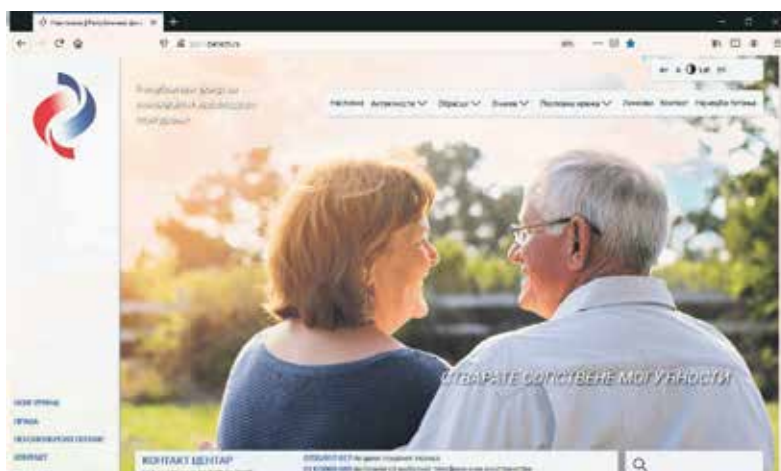
Насловна страница новог сајта РФ ПИО

Фонд је омогућио грађанима још 2010. године уз претходно издавање пин кода на шалтерима филијала Фонда. Новим веб