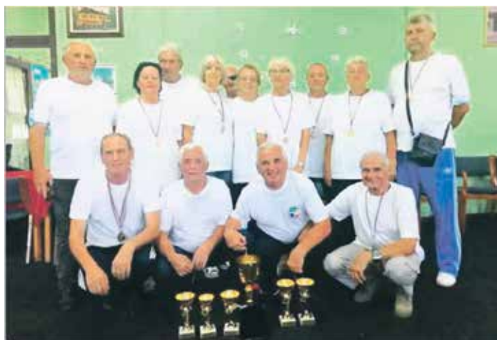
Победничка екипа Јагодине

У веома јакој конкуренцији Јагодинци су одбрали титулу освојену на првој мини олимпијади одржаној пре ковида, 2019. у Јагодини. Из овог Удружења пензионера нарочито истичу подршку јагодинске локалне самоуправе и Јагодинског спортског савеза ЈАССА, и напомињу да су Параћинци били изузетно добри домаћини.