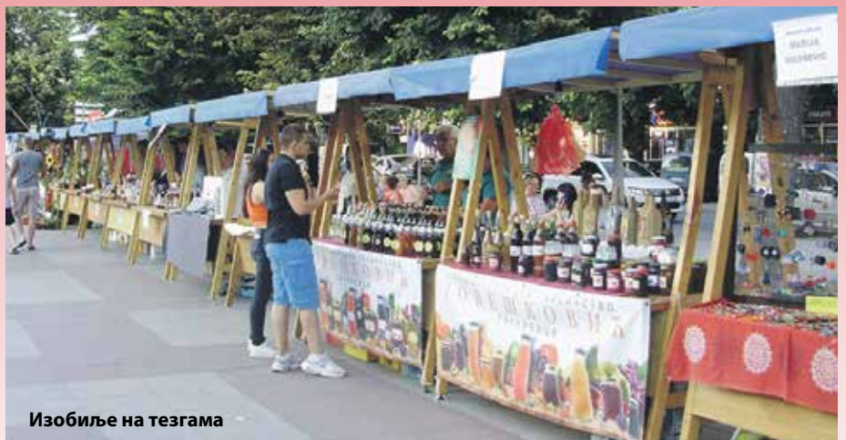
Изобиље на тезгама