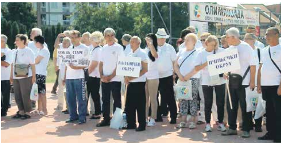
Регионална олимпијада у Нишу окупила око 400 такмичара

На олимпијади у Нишу учествовало је више од 60 спортских екипа са око 400 такмичара из Борског, Зајечарског, Нишавског, Пиротског, Топличког, Јабланичког, Пчињског, Поморавског, Моравичког, Златиборског, Јужнобанатског округа и са Косова и Метохије. Такмичари су се надметали у фудбалу, кошарци, штафети 4x100 метара брзог хода, затим у пикаду, шаху и риболову.