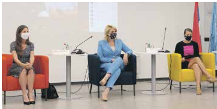
Министарка за рад, запошљавање, борачка и социјална питања, Дарија Кисић Тепавчевић (у средини) на обележавању примопредаје ИТ опреме за установе за старе

Кисић Тепавчевић је истакла да је пандемија ковида 19 показала колико је битно да сви буду технолошки писмени.