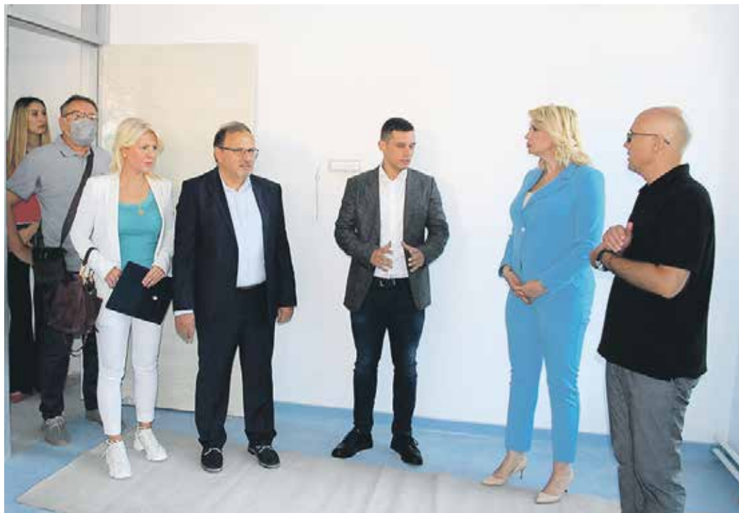
Радови на новој згради новосадске филијале теку према плану

– У мају 2020. године овде су били само ископи. Уз све проблеме које смо имали, и подземне воде и структуру земље, и ковид, ми смо успели да изградимо најлепшу зграду ПИО фонда и да је финансирамо из сопствених средстава, што је јасан показатељ финансијске стабилности Фонда, а све то не бисмо могли да приуштим без јасне политике Владе и отварања радних места. Од пре два месеца више не размишљамо о томе како ћемо исплатити пензије, јер смо пензије за кате-