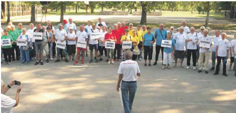
Смотра учесника Мини олимпијаде Баната у Зрењанину

– Данас, у прелепом амбијенту Спортско-рекреативног центра „Партизан“, први пут за удружења са територије Баната одржава се Мини олимпијада. Посебно ме радује да је одзив за данашњи догађај већи од очекиваног, јер је ово година када је Зрењанин