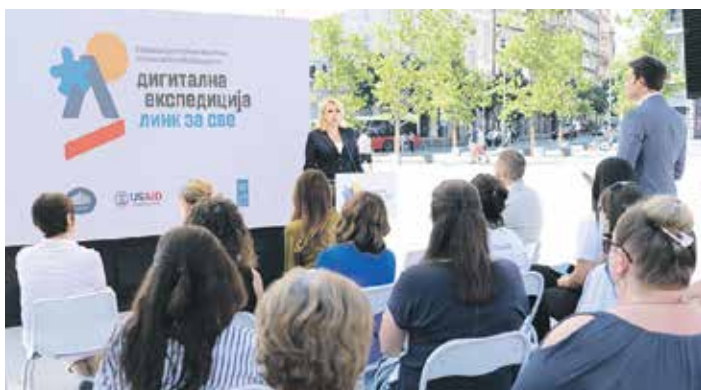
Обраћање министарке Дарије Кисић Тепавчевић на поласку каравана

Министарка трговине, туризма и телекомуникација, Татјана Матић, која је отворила караван, захвалила је министарки Кисић Тепавчевић што је имала слуха за најстарије грађане и подржала да и они буду део процеса дигитализације. Г. О.