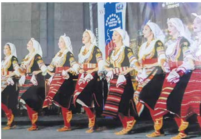
Игре из Македоније

Шеснаести међународни фестивал фолклора одржан је 7. и 8. августа а по броју ансамбала био је знатно сиромашнији него ранијих година. Изостали су реномирани фолклорни ансамбли из Боливије, Аргентине и других јужноамеричких држава, али и из Пољске, Украјине, Мађарске, Турске, Грчке,