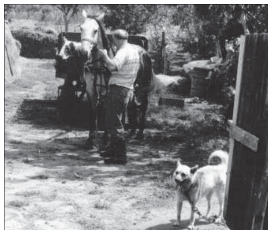
Пред полазак на њиву

Нас неколико будућих пензионера (ако будемо, у шта не верујем) имамо уплаћених 10, 12, 13 година стажа, и поднели смо захтев за мировања за период од 01. 01. 2000. године, јер до тада нам треба 15 година за услов. За 2003. пријавили смо мировање за сушу. За годину 2004, 2005, 2006, како ко навршава 60, односно 65 година, дали смо сагласност за примену члана 120. Међутим, после удруживања наших фондова, нисмо добили ниједно решење о мировањима које би спровела Пореска управа у Великој Плани. Такође, Пореска управа тражи да се уплати