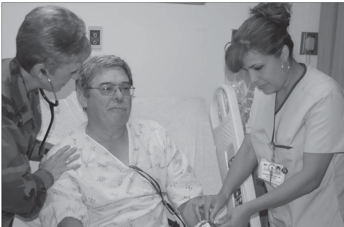
Проблеме не треба крити

– Карцином простате је најчешћа малигна болест у свету и код нас, други је узрочник смрти мушкараца, одмах после карцинома плућа.