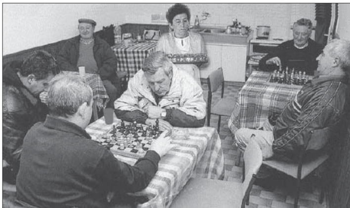
У клубу пензионера

На опоравак и рехабилитацију о трошку Фонда ПИО иде 84 књажевачких пензионера: са листе из радног односа 78, четири занатлије и са листе пољопривредника двоје.