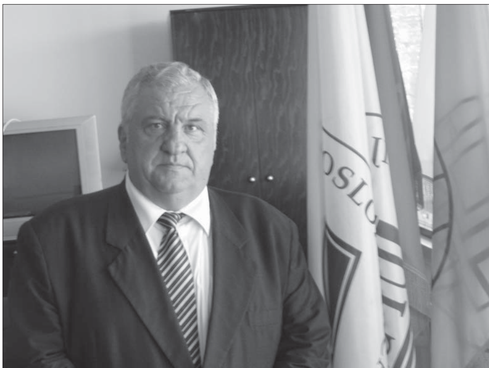
Питати оне који стварају

– Треба поштовати одређени економски редослед. Не може се од оних који привређују само узимати, треба