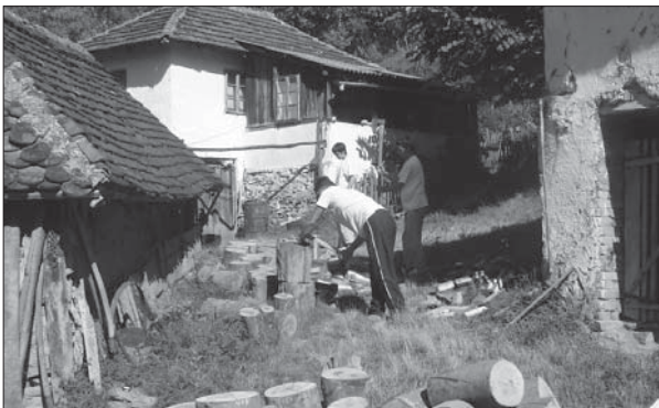
И помоћ и разговор: добровољци код баке Давине

2006. године почели смо активности у два најудаљенија села трстеничке општине Лободер и Рајинац, где у 38