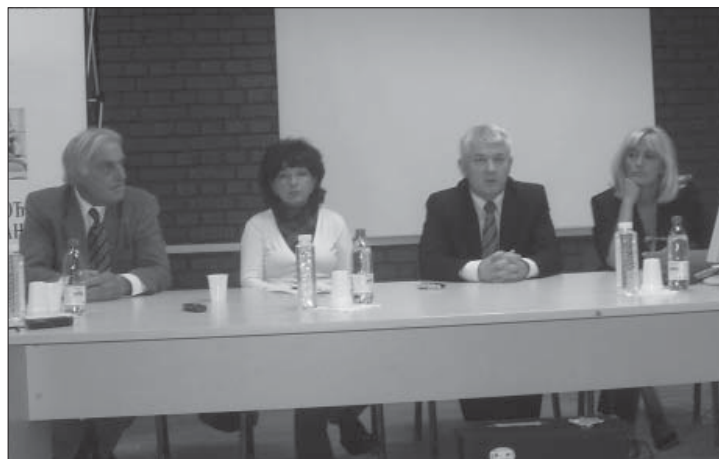
Представљање програма у Новосадској филијали НСЗ

– Наш задатак је да повећавамо способност