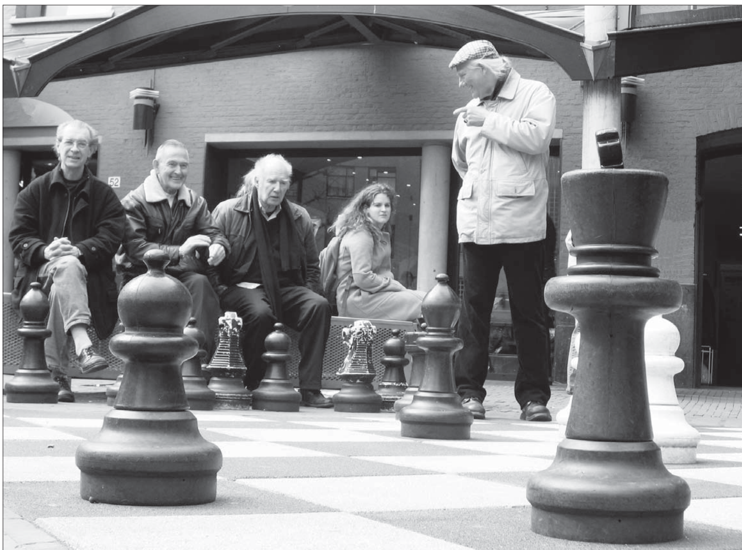
Почела прва олимпијада трећег доба: У Сокобањи надметање и у шаху

ГОДИНА XXXX • БРОЈ 18 • БЕОГРАД, 30. СЕПТЕМБАР 2008. • ИЗЛАЗИ ПЕТНАЕСТОДНЕВНО