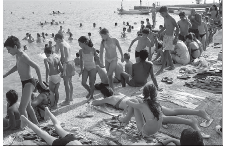
У летњој школи и на плажи

Током овог лета у децем одмаралишту Црвеног крста Србије «Криста Ђорђевић» у Баошићима боравило је 2.150 деце из целе Србије узраста од 8 до 14 година. На десетодневном опоравку било је 500 малишана из енклава са Косова и Метохије, за чији боравак је средства обезбедио Црвени крст Косова и Метохије; 94 деце ромске националности у оквиру пројекта «Отворени вртић за ромску и социјално угрожену децу» чији опоравак