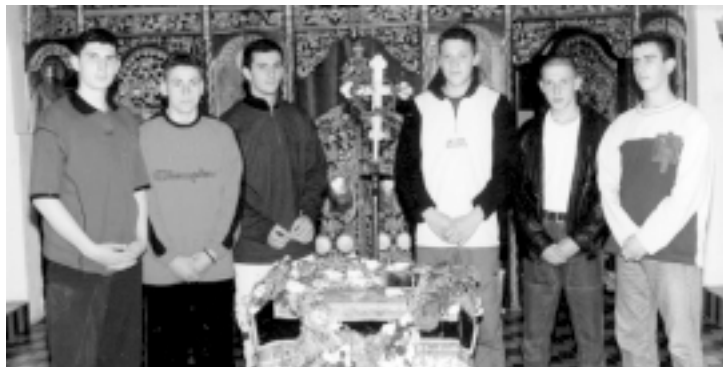
Некад било: чувари Христа у Церовачкој цркви

Чување Христа, прастари народни обичај, некада негован у многим православним црквама, данас се ретко где одржава. По њему, млади људи, у ставу мирно, по двојица, стоје у цркви крај замишљеног Христовог гроба, а стража се смењује на сваки сат. Обично најстарији из посаде чувара, као «командир» страже,