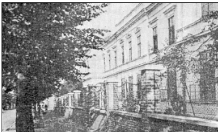
Занатска школа Дома сиротне деце