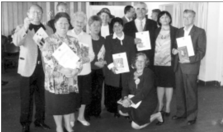
Награђени за десетогодишњицу

Пригодном свечаношћу обележена је, овог месеца, десетогодишњица постојања и рада Геронтолошког клуба шабачког Геронтолошког центра. То је била прилика да се заслужнима за рад Клуба уруче скромне награде, али и да се угосте представници сличних клубова из Врбаса, Зрењанина, Лазаревца и Београда, са којима се успешно сарађује.