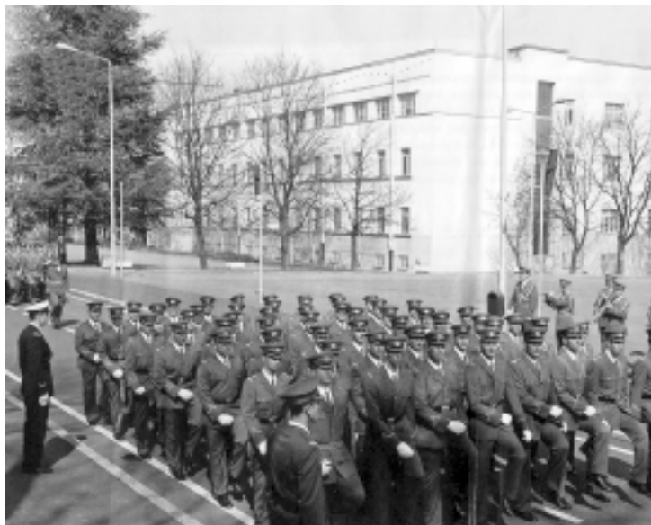
Ко ће остати у униформи