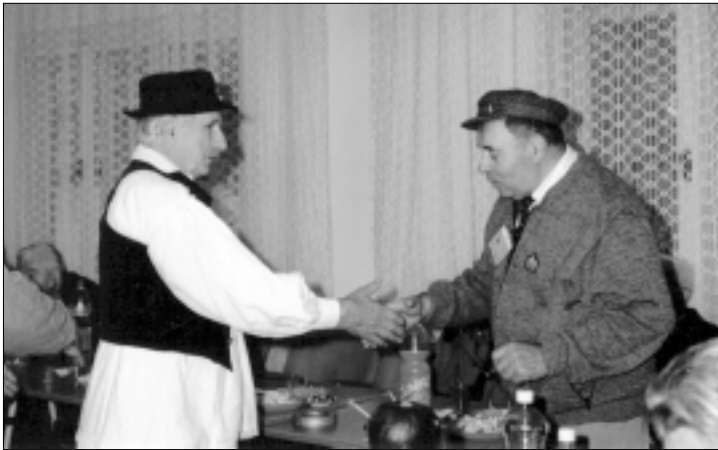
Срећно домаћине

С поштовањем, Мирослав М. Ђонић, Горњи Рипник