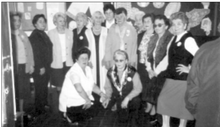
Секција креативног ручног рада на Цераку