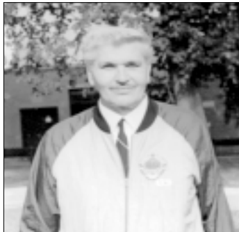
Много пута у дресу са државним грбом

пушке, да бих после месец дана прешао на војничку пушку. Захваљујући одличним резултатима, иако инвалид, уврштен сам у стрелачку репрезентацију Војводине –