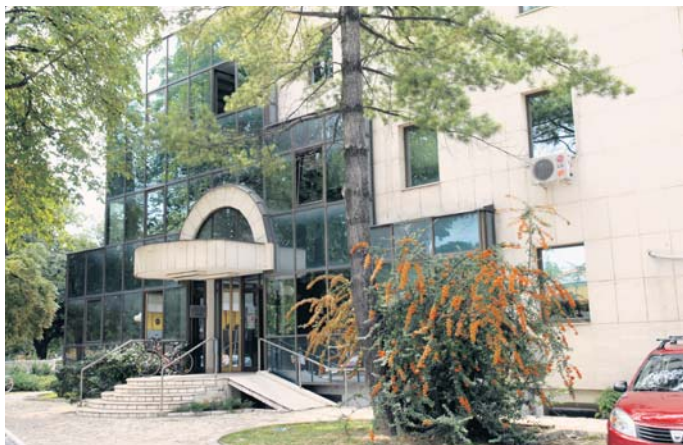
Деценију у својој згради