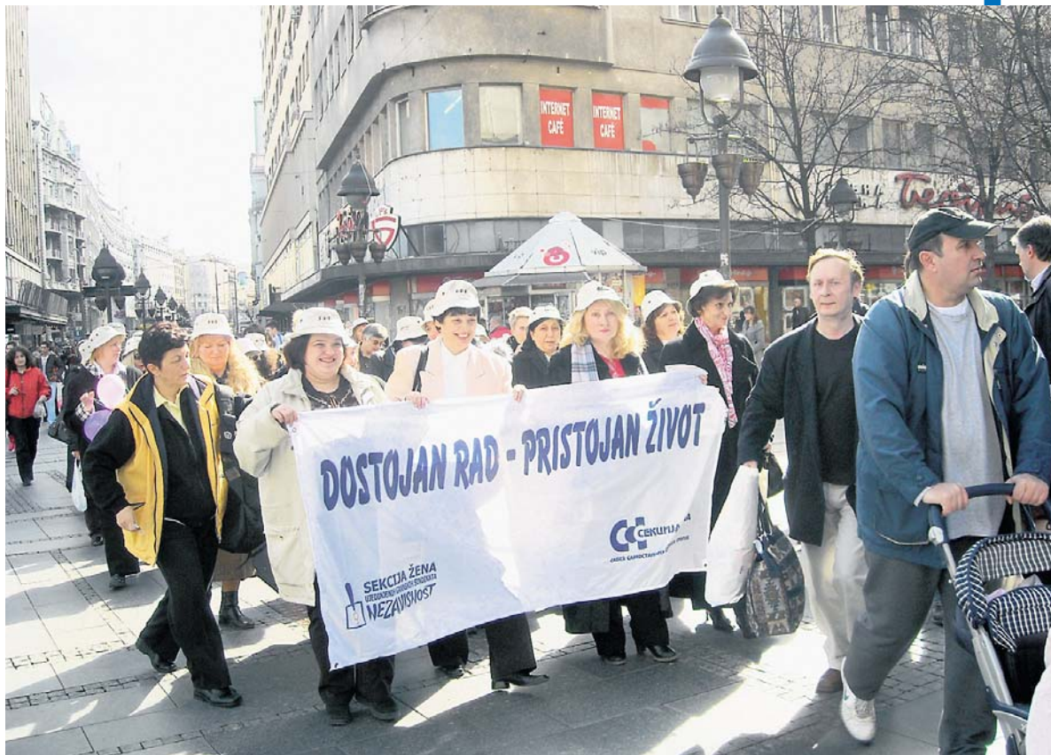
Један од пролећних протеста: да права више не траже на улицама

Рачуни ових фирми су блокирани, власници дугују огромне суме новца и нису у стању да испоштују уговорене обавезе, односно да инвестирају у развојне програме. Права радника су озбиљно угрожена, јер нови власници често не поштују социјални програм.