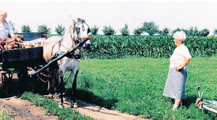
Свако својим превозом