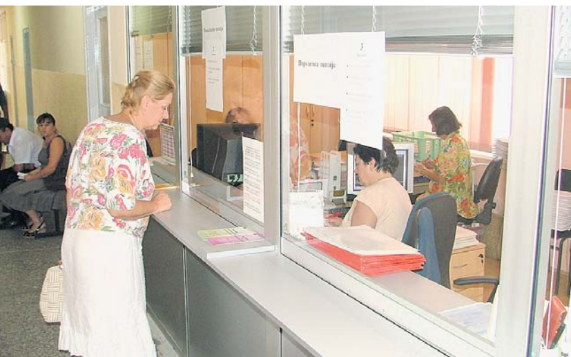
Све за љубазност и брже доношење решења

– На изради решења свакодневно ради шест референата, настојећи да испоштују дневну ажурност, а резултати се мере на крају сваког месеца. Пошто је база података матичне евиденције услов за остваривање права из ПИО, то је преузимање М4 образаца подигнуто на ниво организоване акције службе Матичне евиденције и послодаваца у свим могућим ситуацијама. Такође, Матична евиденција Дирекције Републичког фонда омогућила је прихват, штампу, ажурирање, архивирање и слање замолница електронским путем, као и аутоматску доделу микрофилмског броја приликом уноса пријава М4 у програму за масовни унос за осигуранике пољопривреднике, чиме се олакшава рад матичне евиденције, што ће свакако утицати на брзину доношења решења – каже за „Глас осигураника“ директор Пожаревачке филијале.