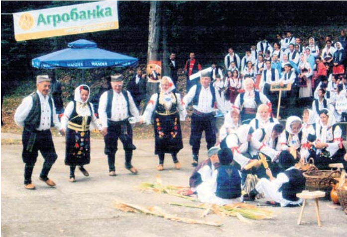
Део наступа КУД „Лепеница“

Пензионерима се даје и новчана позајмица коју враћају у дванаест рата без камате.