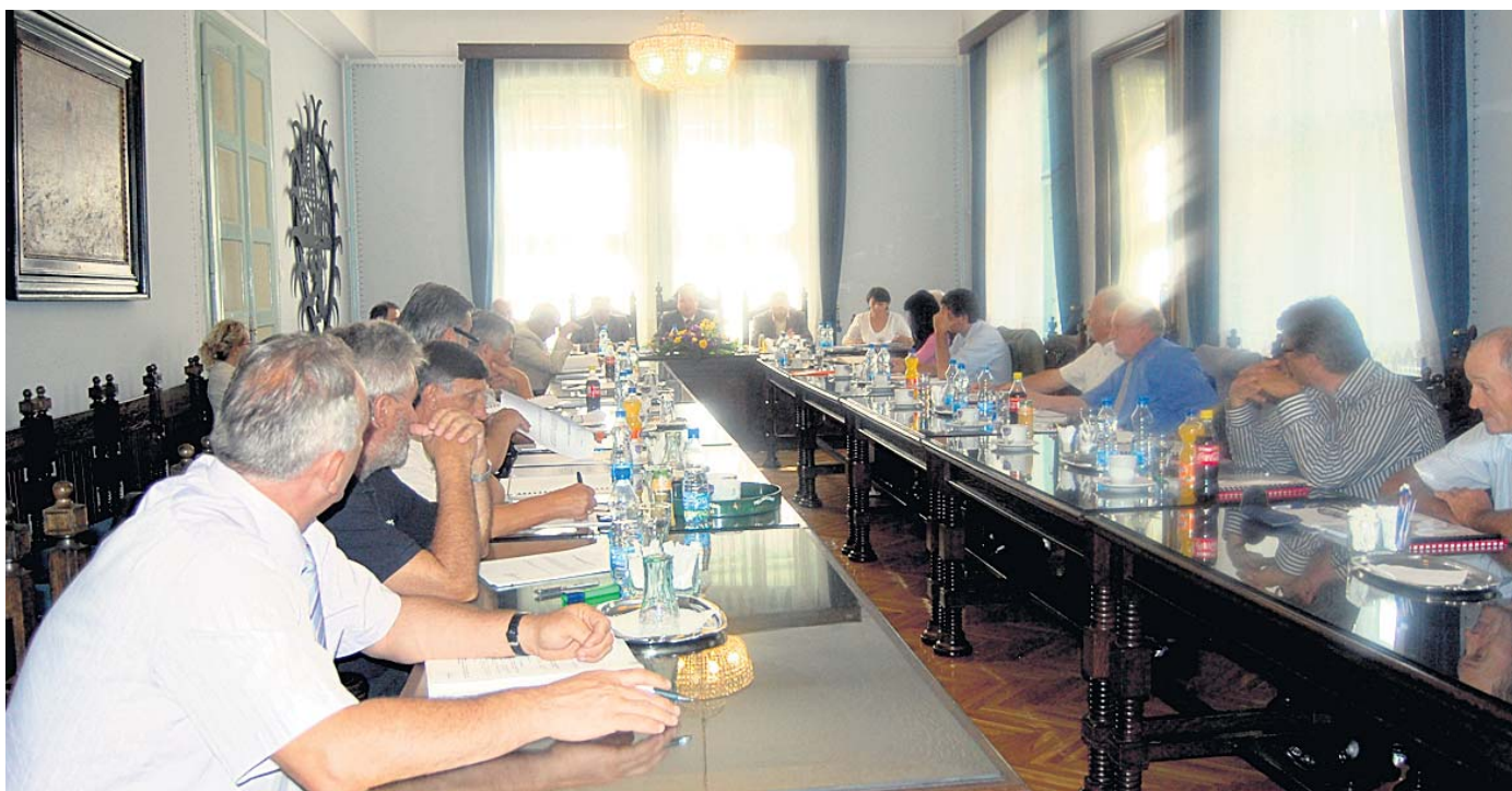
Дискусија у суботичкој Градској кући

Пут ка стварању модерне организације у којој обучени и љубазни запослени пружају квалитетну услугу грађанима за ефикасно остваривање права