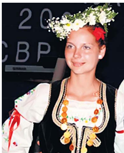
Прва по лепоти

Дводневна „Белмужијада“, одржана у Сврљигу средином августа, посвећена прастаром пастирском јелу које се справља од младог, једнодневног овчијег или крављег