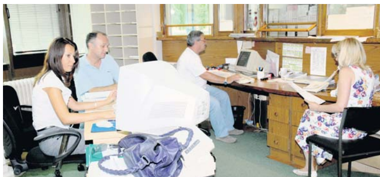
Посебна пажња проблематичним предметима

Један од проблема с којим се суочавају у овој филијали, поред наведеног малог броја штампача, јесте и чињеница да им се око 70 одсто архивираних предмета налази ван зграде Филијале, у просторијама службе Архива Ваљево. Засад је проблем