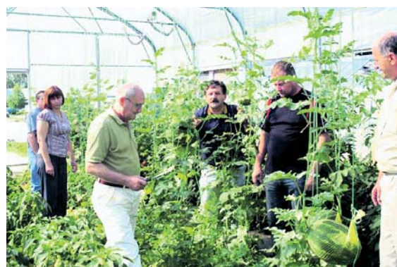
Ускраћени пољопривредници и предузетници

Наиме, овај Фонд одобрио је досад 22 кредита у динарској противвредности више од 130.000 евра. Позајмице су биле на три године, са једногодишњим грејс периодом и годишњом каматном стопом од три одсто (услови повољнији од банкарских). Међутим, изневерена је добра намера пошто многи корисници