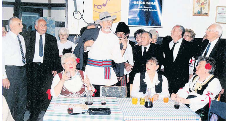
Са гостовања Књажевчана