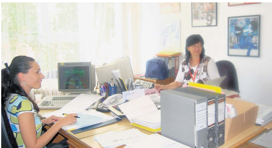
Пријем странака у канцеларијама

представник Владе Србије, замерио је што се у постојећој економској ситуацији запошљавају нови људи, посебно високообразовани правници за послове које у многим земљама обављају средњошколци. У Немачкој, у фонду надлежном за спровођење ме-