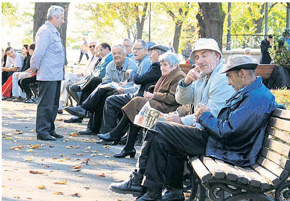
Стрепње најстаријих за судбину чека