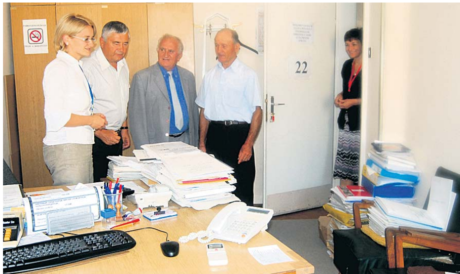
Чланови Управног одбора распитују се о раду филијале

У крајој дискусији, чланови Управног одбора подржали су како су оце-