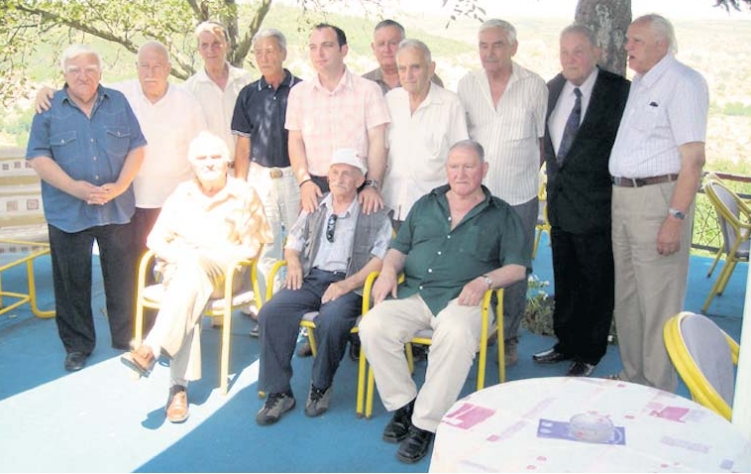
Добитници са председником општине