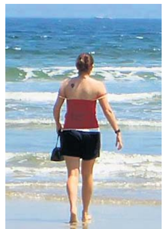
... ходајте кроз воду