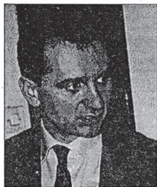
Бождар Ђелић Влада испунила обећања

● Око 700 хиљада пензионера и 250 хиљада наследника преминулих корисника биће обештећено у наредних 36 месеци