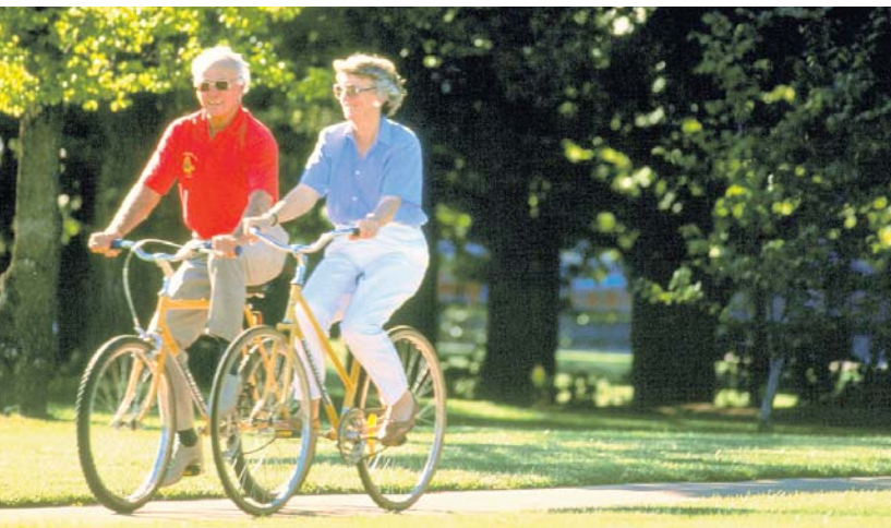
Савет: возите бицикл и...

Отворене ране на потколеници, као последица проширених вена, некада не зарастају годинама. Нарочито су им подложни људи који много времена проводе на ногама – физички радници и пољопривредници. А рана, да би зарасла, мора бити чиста,