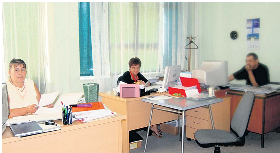
Највише посла у Матичној евиденцији

Чланови УО подржали су праксу организовања седница у филијалама као добру прилику да се непосредно упознају са стањем на терену, па је прихваћен позив руководства Филијале Краљево да буду домаћини њиховој наредној седници.