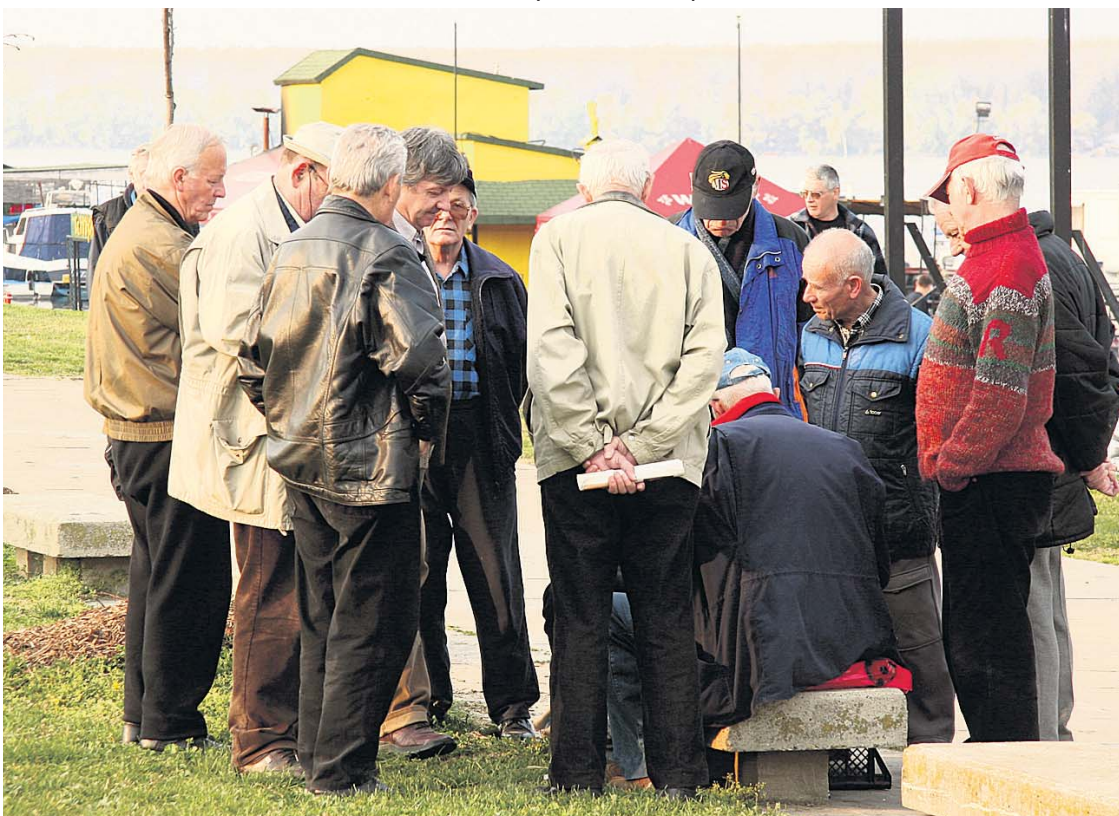
Многима ће ово бити улазница за пензију

тирати држава, као ни број радника којима ће држава решити велики проблем и комплетирати радни стаж. Министар Љајић је одмах после седнице владе проценивао да је таквих радника