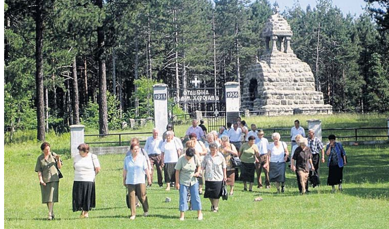
Пензионери на Мачковом камену