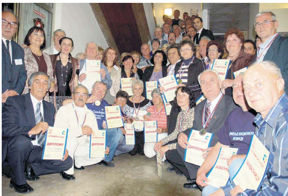
Сокобањски олимпијци: признања најуспешнијима

Повезивање стажа најкасније за месец дана