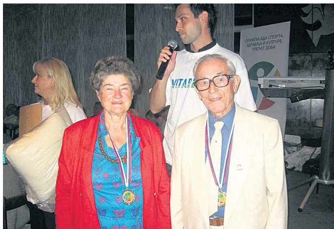
Злато у трци живота