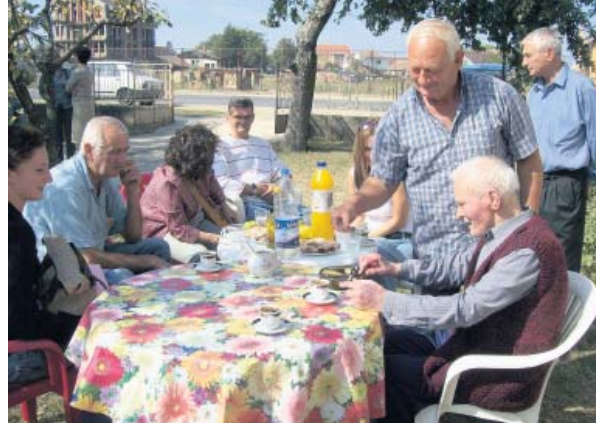
У друштву гостију