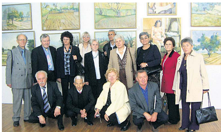
Са изложбе Саве Шумановића

На путу ка Вуковару, Шапчани су обишли изложбу Саве Шумановића у Шида и искористили јединствену прилику да виде 189 радова великог сликара.