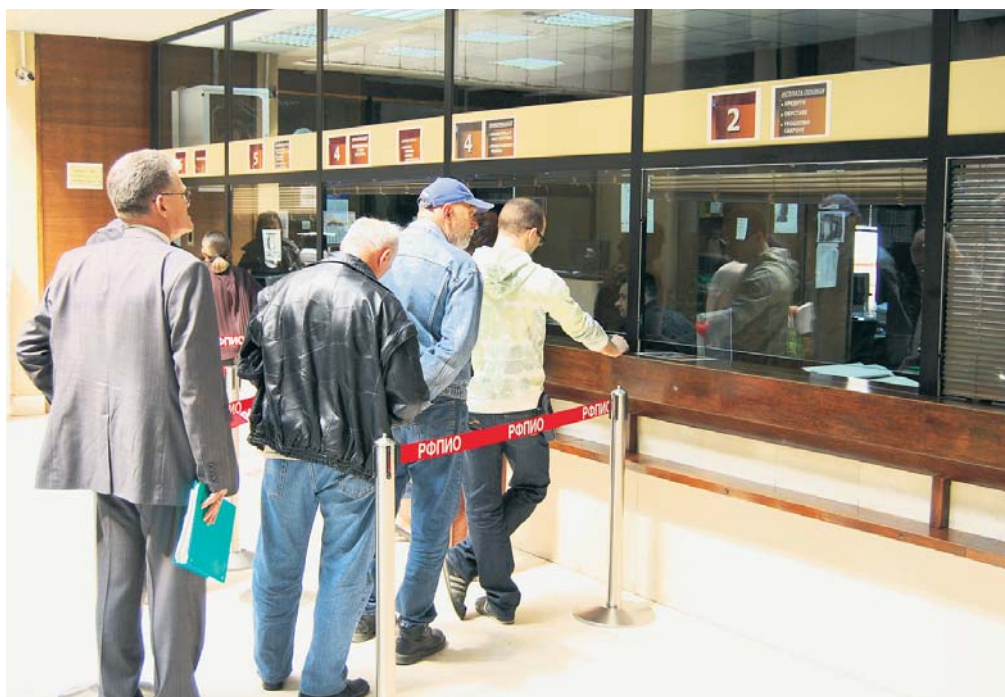
Држава обећала доприносе: у Фонд ПИО засад само по информације

ГОДИНА XLІ • БРОЈ 19 • БЕОГРАД, 15. ОКТОБАР 2009. • ИЗЛАЗИ ПЕТНАЕСТОДНЕВНО • БЕСПЛАТАН ПРИМЕРАК