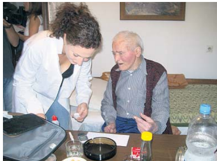
Здравље га добро служи