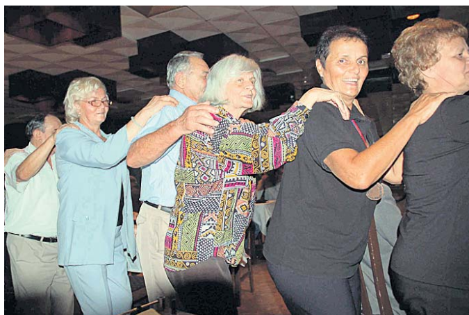
Забава до зоре