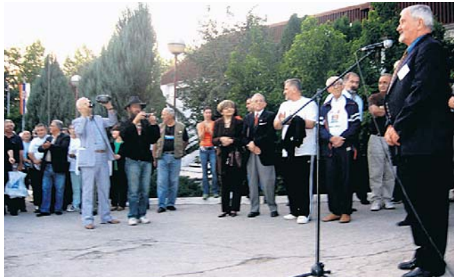
Василије Белобрковић отвара Олимпијаду