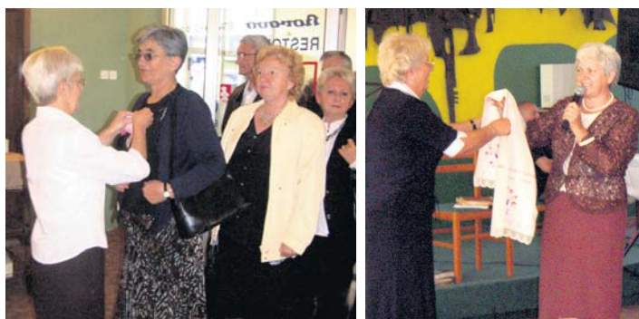
Дочек и предаја пешкира

Општинска организација инвалида рада из Шапца прихватила је позив удружења пензионера „Западни Сријем“ из Вуковара да присуствује Дану старих. Уз свих 12 организација ове регије и бројну групу Шапчана, скупу су присуствовале и делегације из Шида и Руме.