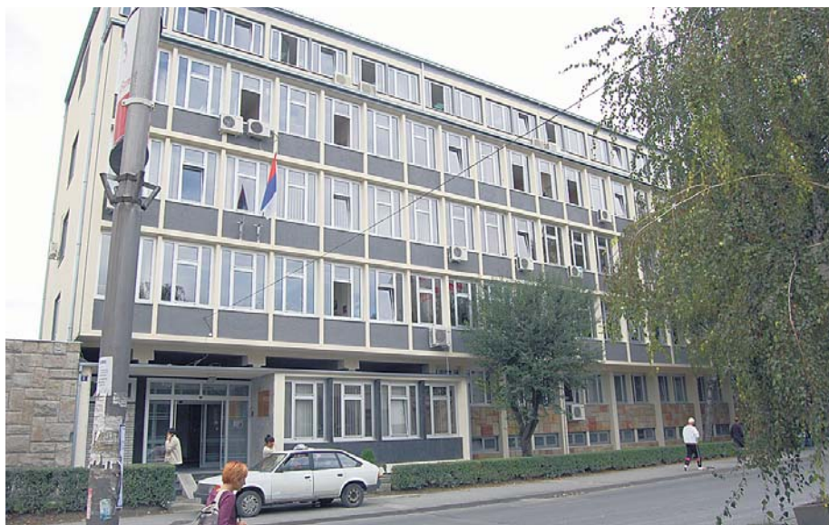
Зграда Дирекције Покрајинског фонда на Житном тргу у Новом Саду

за кориснике права. Контролу рада у филијалама ово одељење спроводи на исти начин као што се обавља и ревизија правоснажних првостепених решења. Трајан посао је и чишћење нетачних и непотпуних података из базе података матичне евиденције, и