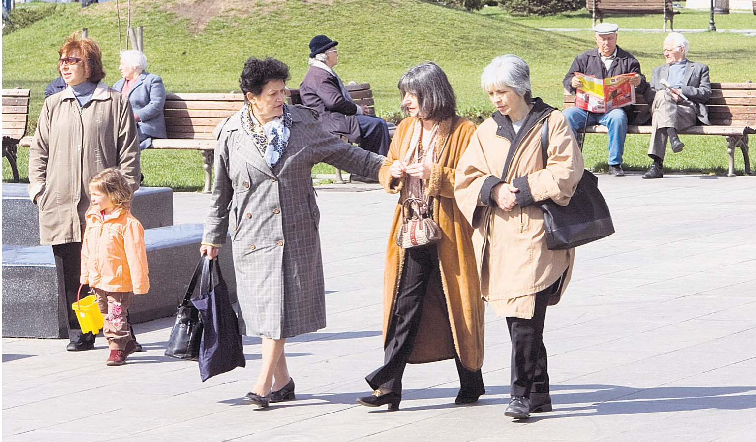
Надлежни најављују да треба имати још мало стрпљења, па ће се све знати