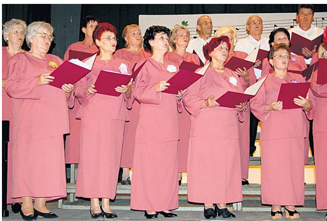
„Јесен живота“ за крај

не само су део репертоара којим су се публици представили апатински пензионери. Вршчани, које већ 24 године успешно води