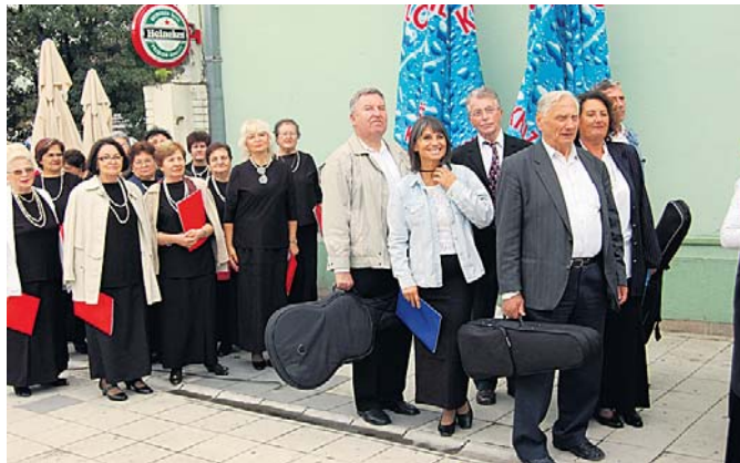
Долазак пред Културни центар

У милна, снажна, нежна – она која срце дира, рекли су за хорску песму млади водитељи Смотре хорова пензионера Војводине која је 2. октобра, уз подршку локалне власти и Савеза пензионера северне српске покрајине, а у организацији Општинског удружења пензионера Шид, одржана у Културном центру овог града. Сви који су имали прилику да чују песме у извођењу 12 хорова