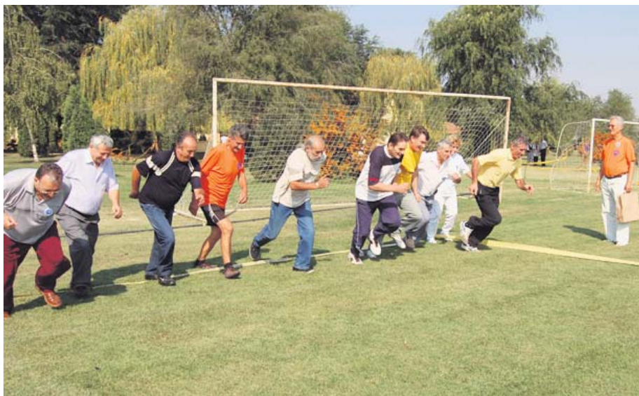
Инвалиди рада на спортским сусретима у Сомбору