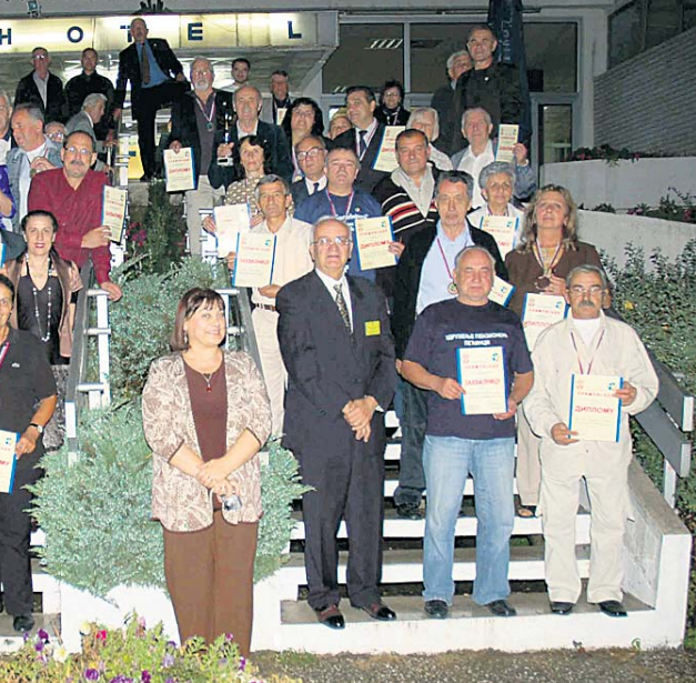
Испред хотела, за дуго сећање

да има нови закон о социјалној заштити који би, најавио је Љајић, требало да буде донет до краја године: њиме би се створили услови за бољи правни основ даљег унапређивања положаја старих.