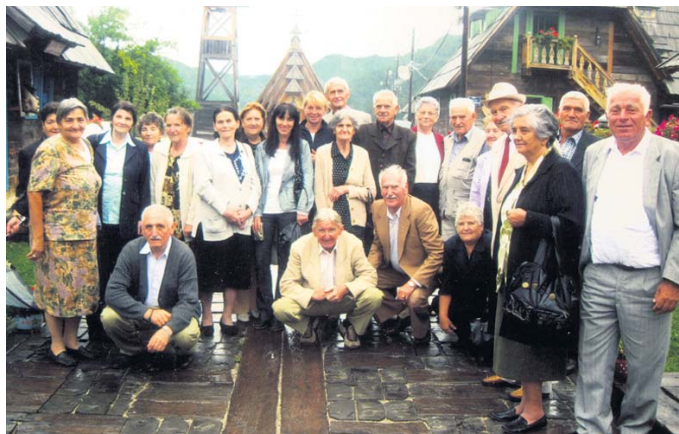
На недавном излету у Дрвенград

У овој години о трошку Фонда ПИО 48 пензионера ишло је на десетодневни одмор у неку од бања, а 150 чланова ове организације у јуну и септембру имали су бесплатно двочасовно коришћење базена у Прибојској бањи.