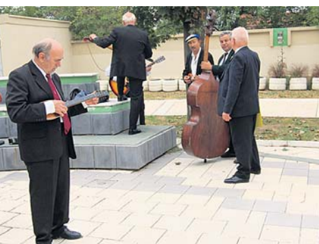
Уштивавање пред наступ