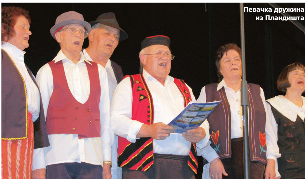
Певачка дружина из Пландишта