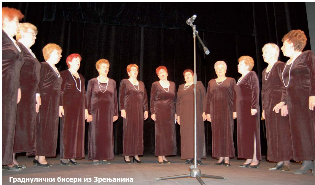
Граднулички бисери из Зрењанина

Хорови и певачке дружине инвалида рада из општинских организација Сремске Митровице, Сомбора, Пландишта, Шида и домаћина Зрењанина, приказали су