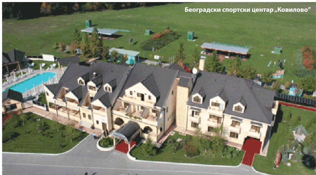
Београдски спортски центар „Ковилово”

У организацији Клуба привредника општине Палилула, Дома здравља „Др Милутин Ивковић”, а под покровитељством ове београдске општине и спортског центра „Ковилово”, крајем маја одржан је форум на тему „Привреда и здравље”.