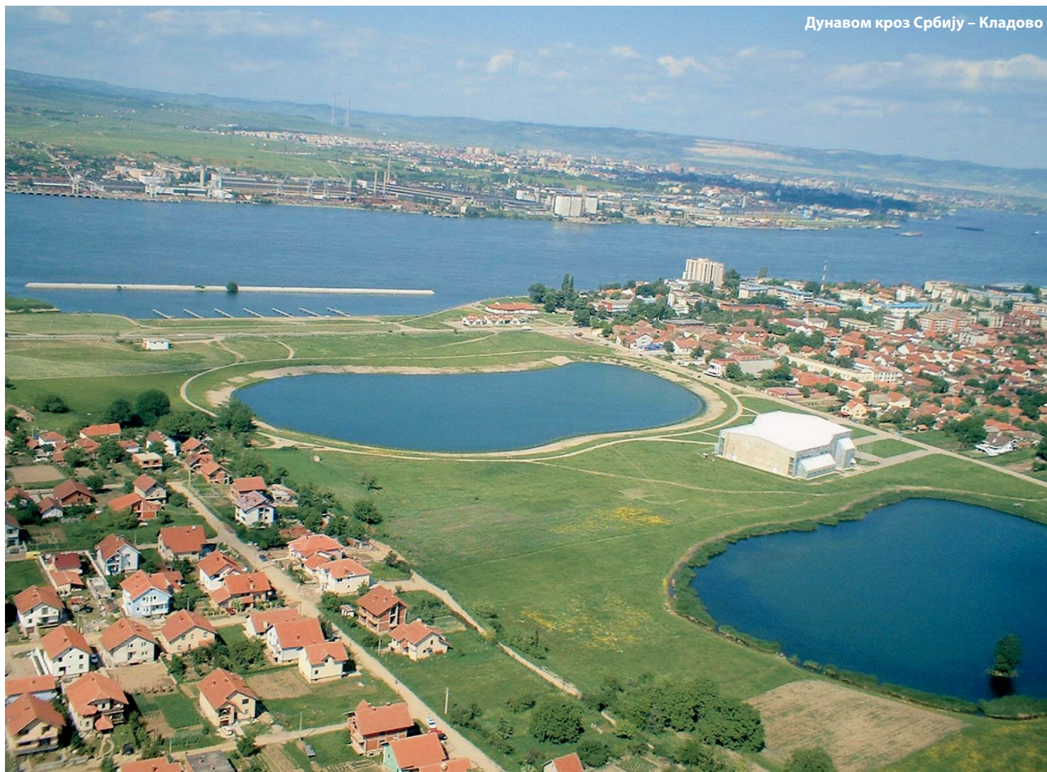
Дунавом кроз Србију – Кладово