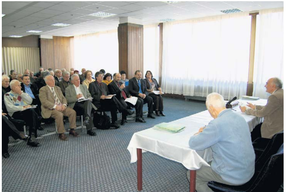
Са седнице Скупштине Савеза пензионера Војводине

Да подсетимо, уз поменуту меру, УО Фонда је предложио и пребацивање расхода за исплату новчане накнаде за туђу помоћ и негу, као и накнаде за инвалиде II и III категорије, у систем социјалне заштите. Предлог је, такође, и да се исплата пензија за породичне пензионере и оне који су пензионисани по посебним прописима стави у надлежност државе. Све ове мере и чврста фискална дисциплина, која подразумева увођење механизма обавезне наплате доприноса у тренутку исплате зарада, као и подизање степена наплативости доприноса, те стриктну примену прописа из свих области пореске политике и радних односа требало би, ако се прихвате, да сведу државне дотације Фонду ПИО на 32-33 одсто. Уз успостављање власништва над имовином, у коју је Фонд у претходном периоду улагао, као и уз темељне промене у привредном систему Србије у циљу стварања