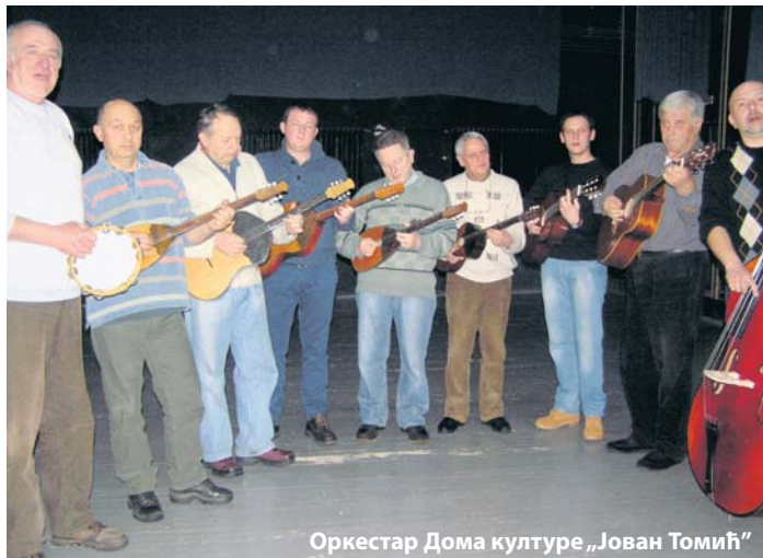
Оркестар Дома културе „Јован Томић“