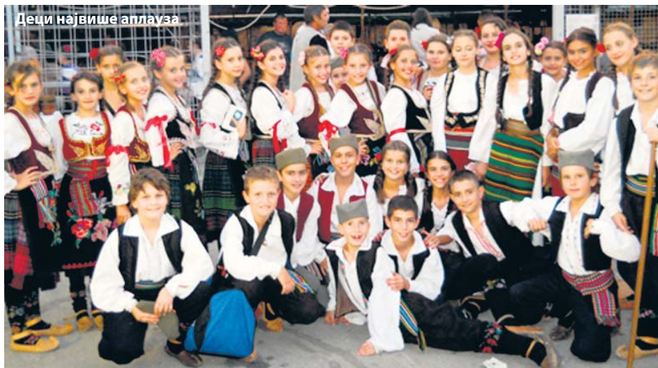
Дечи највише аплауза