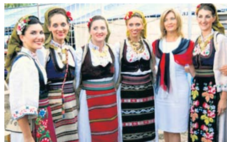
Најбоље изворно извођење

Село Прилике у Моравичком округу, раније познато по јединој сателитској станици у СФРЈ, деценијама је и центар различитих културно-туристичких манифестација. Фестивал српске изворне песме и Фестивал дечјих фолклорних ансамбала под називом „Светлост на брежуљку“ спадају у оне манифестације које имају за циљ гајење и чување изворног српског певања и играња. Организатори фестивала су Дом културе „Ивањица“, Месна заједница и Основна школа „Сретен Лазаревић“ у Приликама, КУД „Прилички кисељак“ и Ту-