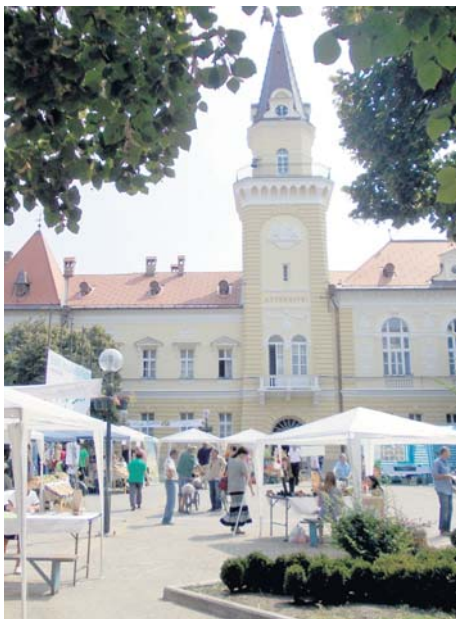
Штандови учесника манифестације „Моја башта” испред зграде Скупштине општине у Кикинди

На Данима пољопривреде у Кикинди одржана је по четврти пут манифестација „Моја башта” коју организује Удружење пољопривредних произвођача „Банатска ленија”. Овог пута је „Моја башта” приређена на Градском тргу, па се окупио и знатно већи број учесника – више од 50 фирми и самосталних пољопривредника,