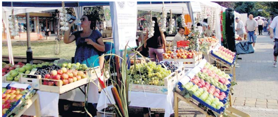
Изложено воће и поврће „као уписано”

што је привукло и масовнију посету. Догодине се очекује да буде завршена изградња пољопривредне зоне па ће тамо бити премештено реализовање пете манифестације „Моја башта”.