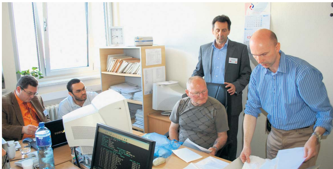
Саветодавци имали пуне руке посла у Новом Саду...