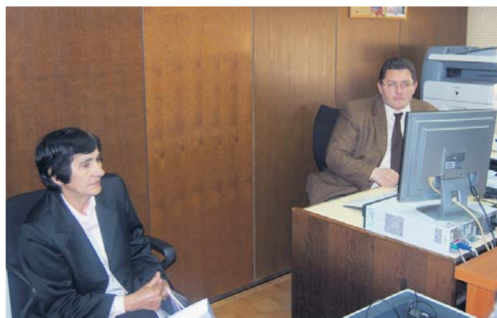
... и у Београду

Наши саветодавци кажу да су питања странака била стандардна – грађани су се интересовали о условима за остваривање пензије у Аустрији, о могућностима добијања накнада за незапосленост у Аустрији ако су незапослени овде, али се ипак