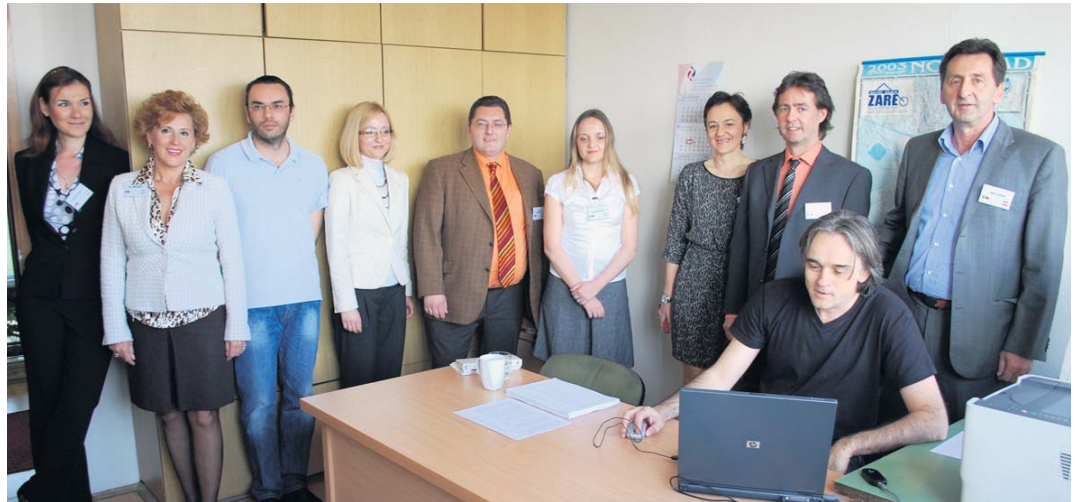
Српски и аустријски стручњаци учесници саветодавних дана

М еђународни саветодавни дани за све оне који су били запослени или још раде у Аустрији одржани су у Београду и Новом Саду 23. и 25. априла. Републички фонд за пензијско и инвалидско осигурање и Завод за социјално осигурање били су домаћини аустријском Заводу за пензијско и инвалидско осигурање, а ова пракса, уведена 2010. године, показала се као јако добра. Стручњаци из српског Фонда и аустријског Завода давали су савете о остваривању права из осигурања према Споразуму о социјалном осигурању закљученом између наше земље и Аустрије, и конкретне информације и правне савете у вези са предметима осигураника који имају периоде осигурања навршене у две државе и корисника који су већ остварили неко право по том основу. Осигураници и корисници, њих осамдесетак из целе Србије, унапред су се пријавили за долазак на саве-