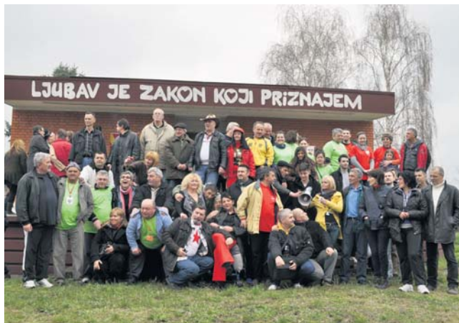
Пензионери, некадашњи акцијаши, испред бине у тадашњем омладинском насељу у Кикинди

И овог априла, шести пут узастопно, у Кикинди се састала велика група учесника некадашњих омладинских радних акција које су се организовале широм ондашње Југославије.