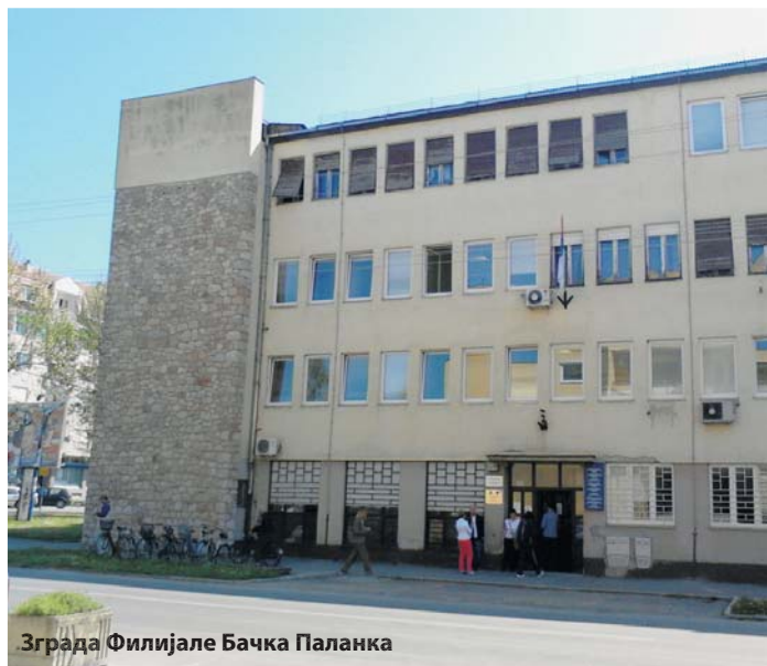
Зграда Филијале Бачка Паланка