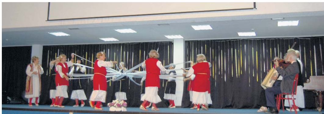
Фолклорни ансамбл „Савска зора“ изводи „Биљану“