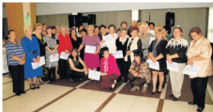
Учесници такмичарског дела