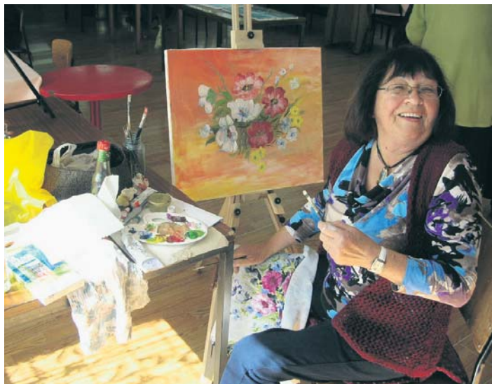
Једна од учесница