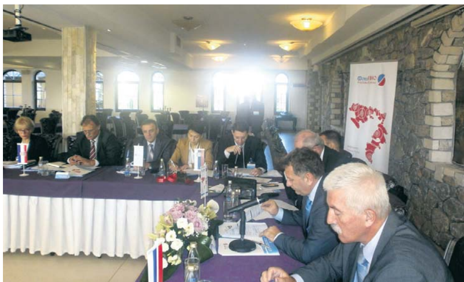
Са сусрета у Бијељини

ције и упознају се са новинама у пензијским системима држава из којих долазе.