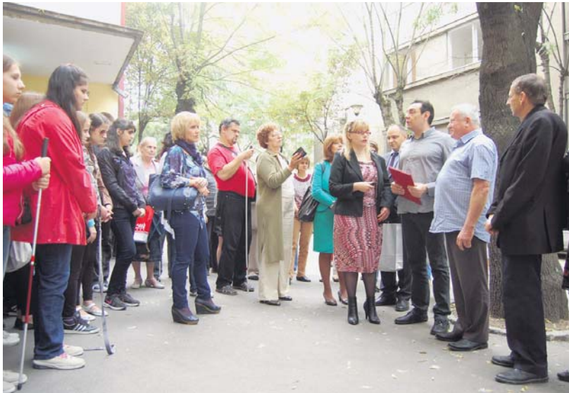
Министар Вулин током обиласка Градске организације слепих Београда

– Такав закон није донет са идејом да се прикупља новац, већ да се реши проблем особа са инвалидитетом, да они и њихове породице могу да живе од свог рада и да се осећају као корисни чланови друштва, што заиста и јесу – поручио је Вулин.