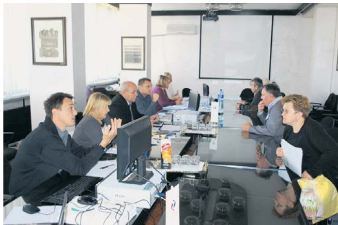
Хрватски и српски стручњаци у разговору са странкама

лефона и пријавила се за дане разговора. Задовољна сам добијеним информацијама. Мислим да су ови разговори корисни, јер најгоре је кад човек лута и не зна коме да се обрати, а ово је стварно пријатно изненађење