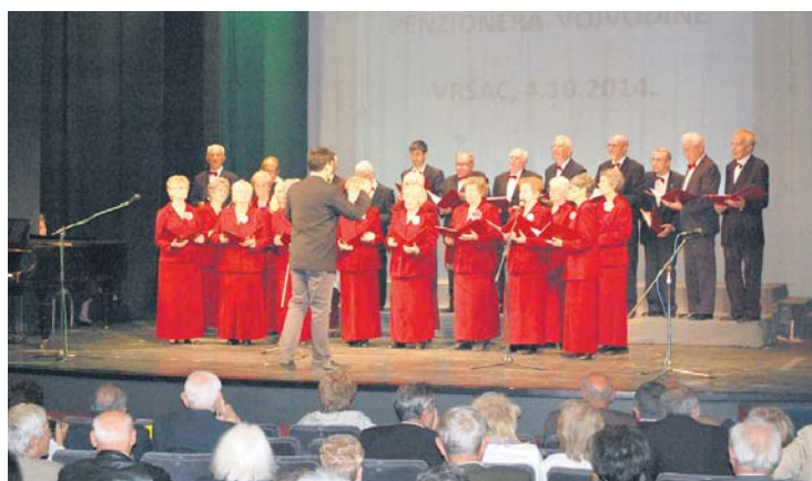
Мешовити хор КУД „Исидор Бајић“

ЗРЕЊАНИНСКИ ИНВАЛИДИ РАДА ОРГАНИЗОВАЛИ 13. ШТРУДЛИЈАДУ