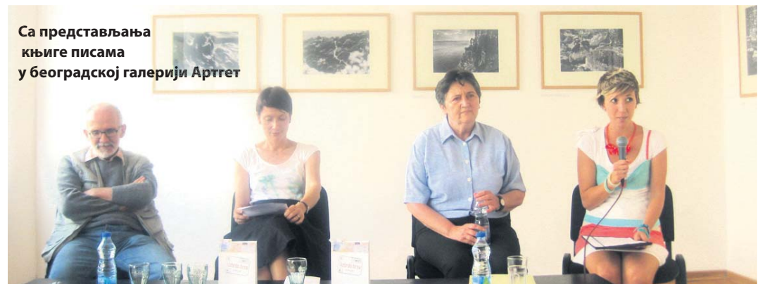
Са представљања књиге писама у београдској галерији Артгнет

објављиван конкурс за писање путописних прича из пера старијих људи, и то у четири категорије: најбоља женска прича, најбоља мушка прича, најбоља прича о путовању у Србији и најбоља прича о путовању по иностранству. Аутори побед-