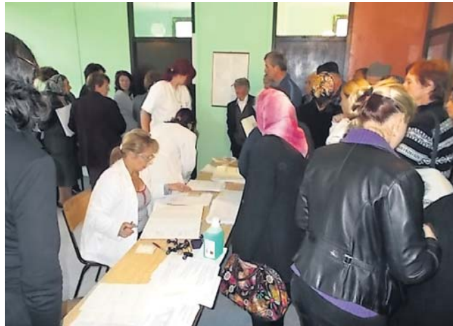
Прегледи у селу Бреково

У оним селима у којима не постоје амбуланте прегледи се организују у школама или објектима месних заједница. За пацијенте који због болести, старости или непокретности не