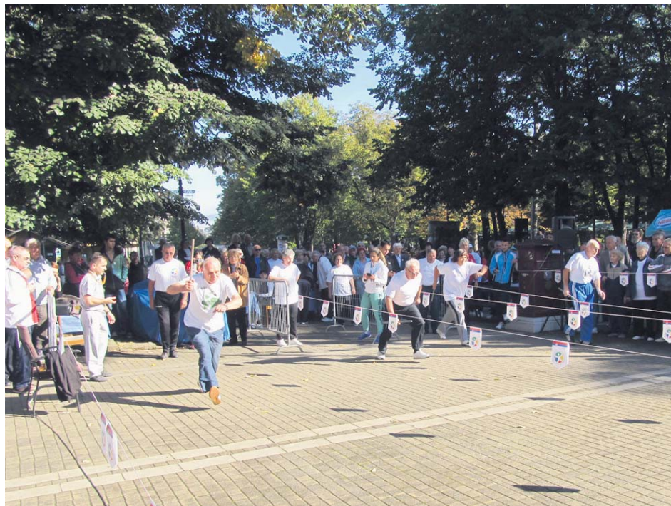
Са седме Олимпијаде спорта, здравља и културе трећег доба у Врњачкој Бањи

Активности као што су бициклизам, нордијско ходање и шетње 2-3 пута недељно, најмање 20 минута лаганим или средњим интензитетом, утичу позитивно на факторе ризика који доводе до обољења срца и крв-