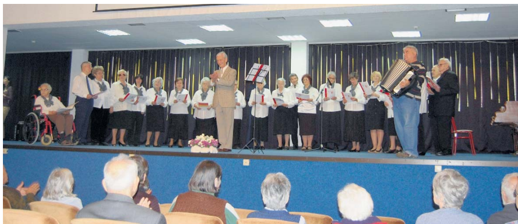
Хор Дома Бежанијска коса

та, доласка јесени, и то ме некако врати у млађе дане. Овде се сви познајемо, на неки начин смо као породица. Дођу те године када за све треба воља, некакав циљ и