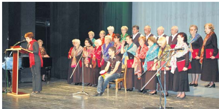
Са отварања Смотре