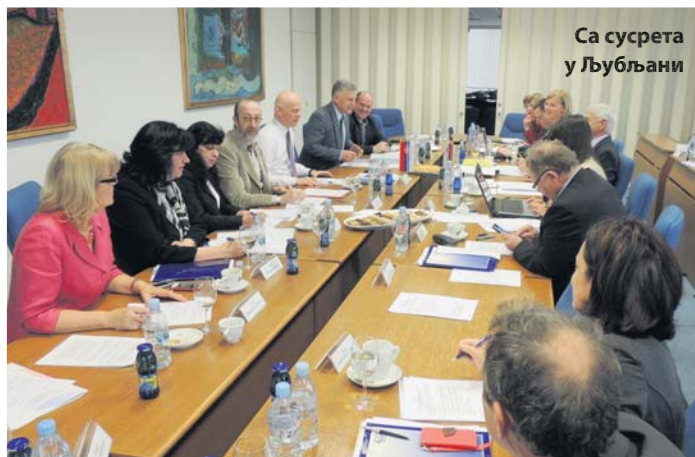
Са сусрета у Љубљани

јер им је право утврђено у периоду након изласка Словеније из СФРЈ, а пре почетка примене Споразума. Закључено је да су, у највећем броју, овакви поступци окончани и да се исплата пензија врши редовно. Посебна пажња посвећена је пензионерима за које је утврђено да су у периоду непостојања међудржавног споразума остварили пензије у обе државе при чему су обе пензије одређене на основу потпуно истих, или делимично истих периода осигурања. Како овакве ситуације нису у складу са прописима обе државе, разматрани су и начини њиховог разрешења.