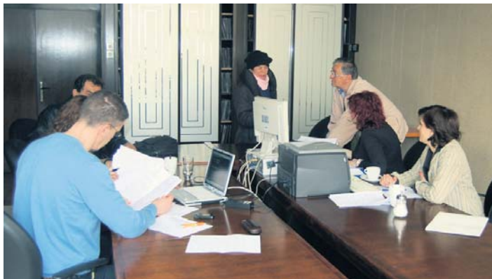
Разговори са Македонијом успешно организовани

решења о пензији и непотврђеног стажа који је стекла радећи у Нишу у фирми чије је седиште у Македонији.