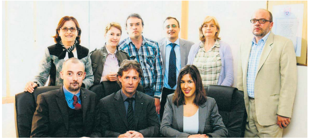
Аустријски и српски стручњаци одговорили на мноштво питања и у Шапцу