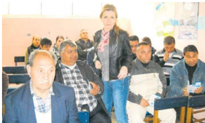
Учесници трибине у Дому културе Рома у Лесковцу

СУСРЕТ ПЕНЗИОНЕРА И ИНВАЛИДА РАДА ЗАЈЕЧАРСКОГ И БОРСКОГ ОКРУГА