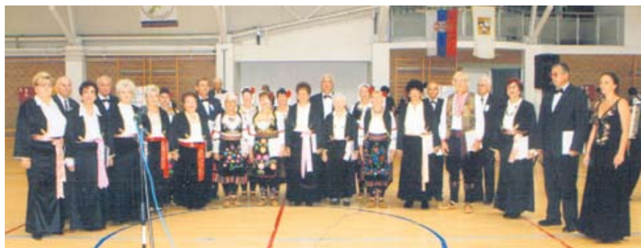
Такмичило се двеста пензионера

Ове године, у Сокобањи, учествовало је око 200 пензионера. Смотри је била такмичарског карактера а учесници су се надмемтали у хорском и соло певању, литерарном стваралаштву и фолклору. Књажевачки пензионери су укупни победници овог сусрета пошто су њихови такмичари победи-