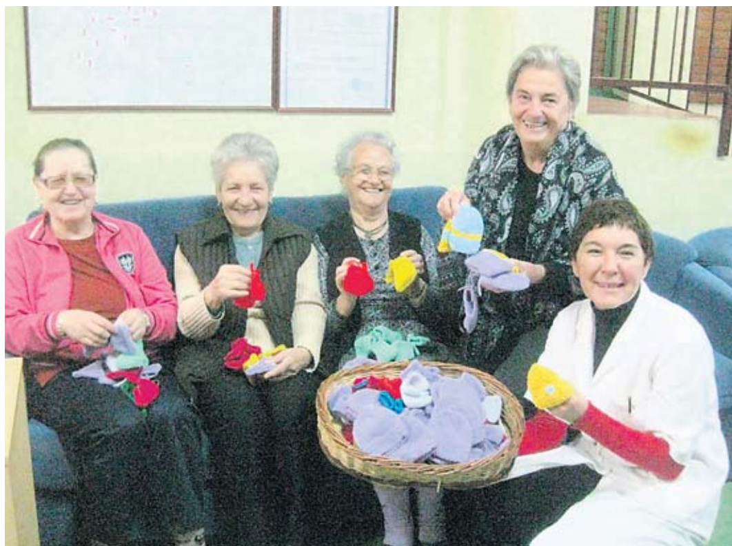
Кориснице ГЦ Бачка Паланка исплеле 50 пари чарапица и капа за Дечју болницу у Новом Саду