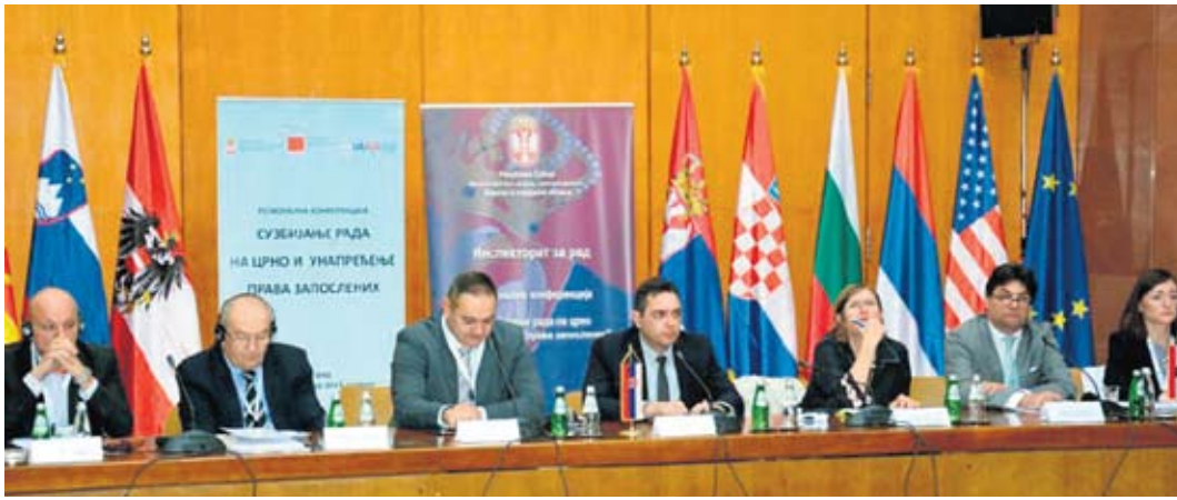
Конференција о сузбијању рада на црно у Палати Србија

промена свести и код послодавца, да би схватили да се ни њима не исплати држати непријављене раднике. Више од свега потребна је свест о значају легалног пословања и да радници тачно знају шта су њихова права.