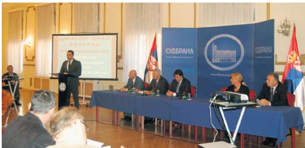
Обраћање министра Вулина на скупу у Дому Војске Србије

Пензионери који нису подносили тужбу могу једним доласком у Фонд да заврше све потребне радње, а они који су поднели тужбу требало би да повуку тужбу и одрекну се тужбеног захтева, и то документују Фонду, како би им средства била исплаћена у јануару. На тај начин, уколико се корисници војних пензија на које се одно-