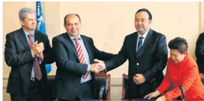
Са потписивања повеље у Ужицу

– Много тога ми можемо да научимо од наших пријатеља и побратима из велике земље која је једна од најјачих економија и најстарија цивилизација на свету. Ја сам уверен да ће нам пријатељи из Харбина, по величини десетог града у Кини, пружити