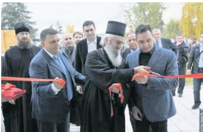
Са свечаног отварања реновираног простора Завода „Мале Пчелице“

Свечаном отварању и обележавању 43 године од оснивања Завода „Мале Пчелице“ присуствовао је ресорни министар, Александар Вулин, који је истакао да је овај завод пример на