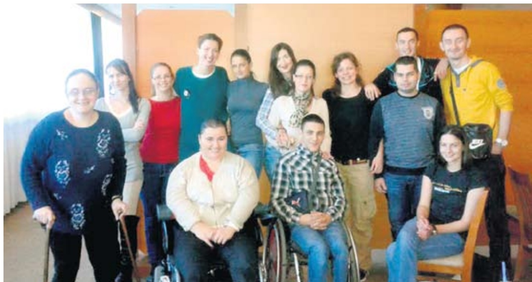
Полазнице предавања о лакшем запошљавању ОСИ

Предавачи на радионици били су представници пословног