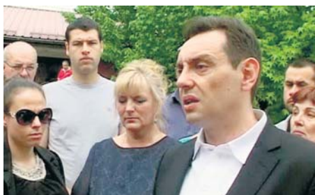
Александар Вулин у Крагујевцу

Тако ће убудуће све услуге Центра за рехабилитацију, површине 165 квадратних метара, са шест просторија, поред корисника, бити на располагању и другим грађанима. Циљ улагања Министарства у установе социјалне заштите јесте да се услови за кориснике изједначе и да они добију ква-