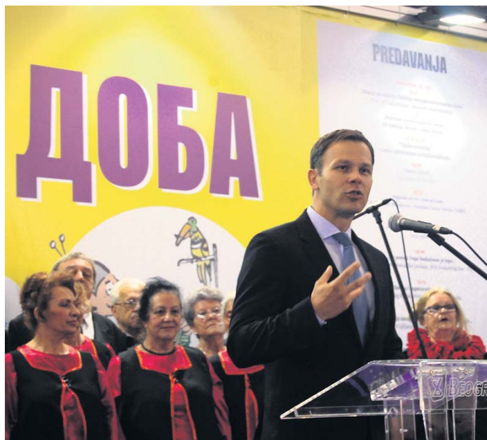
Градоначелник Београда Синиша Мали

Важно место имао Фонд ПИО на чијем су инфо пулту посетиоци могли да се информишу о остваривању права из ПИО, да добију листинг или јединствени пин код