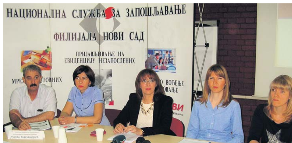
Татјана Видовић представила актуелне мере политике запошљавања

слености износи 25 одсто, лица старијих од 50 година је 26,4 посто, док је лица од 30 до 49 година 47 процената.