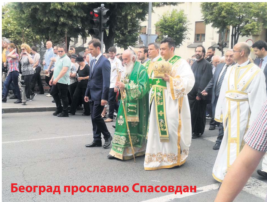
Београд прославио Спасовдан

Поводом Спасовдана, градске славе, 21. маја централним београдским улицама одржана је литија коју је предводио патријарх српски Иринеј. Он је честитао Београђанима славу, као и свима у Србији, али и целом српском народу који се стицајем прилика нашао широм света.