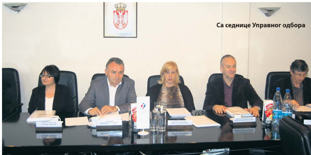
Са седнице Управног одбора

У 2014. години извршено је 12 исплата пензија за 1.739.162 корисника. Просечна пензија за све категорије корисника