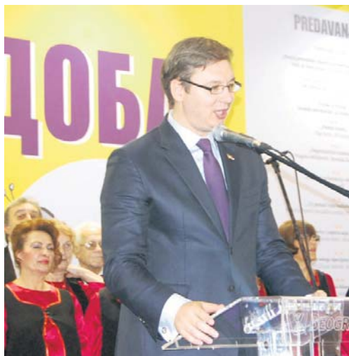
Обраћање Александра Вучића посетиоцима Сајма за треће доба

Зато ће и држава настојати да се пензионерима одужи колико год је то у могућности и чим се укаже прилика за то.