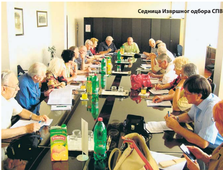
Седница Извршног одбора СПВ

На седници је одлучено да се у чланство Савеза приме два нова удружења: