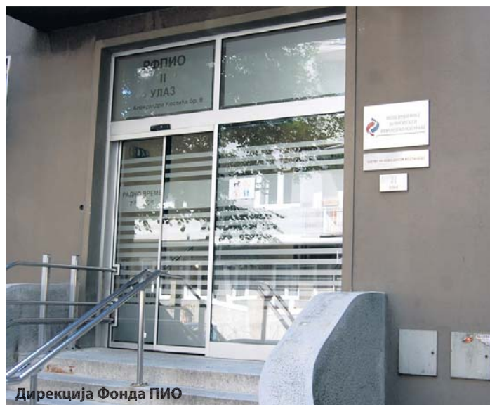
Дирекција Фонда ПИО

гураника“ је изашао 730 пута на 14.500 страница на којима је објављено око 30.000 новинарских прилога са око 20.000 фотографија. За све то заслужно је око 300 новинара – спољних сарадника.