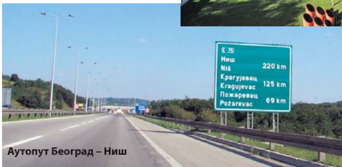
Аутопут Београд – Ниш

Према слободним проценама, тих година је у објекте широм Србије уложено више од пет ми-