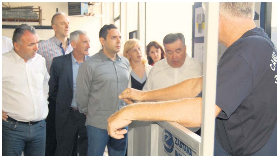
Министар Вулин са челним људима Фонда ПИО и „Заставе инпро“ у погону заштитне радионице

– Особе са инвалидитетом на овај начин обезбеђују своју егзистенцију, самопоштовање, а у стању су и да усвоје савремене технологије. ПИО фонд ће до краја године ре-