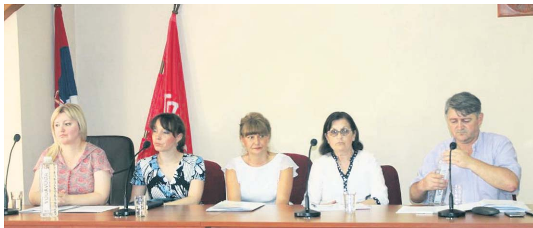
Стручњаци Филијале Шабац одговарали на питања пољопривредника у Малом Зворнику

осигурања и здравственог осигурања, између права која произилазе из ових осигурања и у погледу тога код којих организација их остварују. Представници Фонда објаснили су да уплата доприноса за пензијско и инвалидско осигурање, уколико осигураника задужује Пореска управа, није у надлежности Фонда ПИО, као што то није ни остваривање права на здравствену заштиту. Имајући то у виду, договорено је да се организује састанак коме би поред присутних, присуствовали представници Републичког фонда за здравствено осигурање и представници Пореске управе. Такође, грађанима је објашњено да се