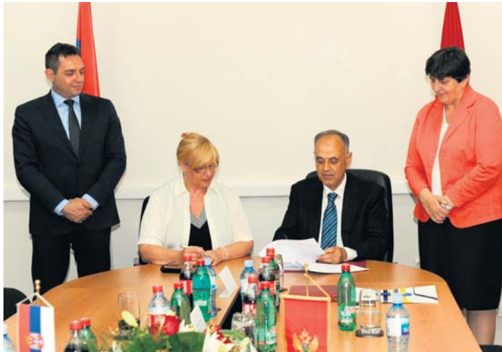
Директори потписују споразум

живе, нарочито ако се зна да се сваке године из Србије у Црну Гору уплати око 8,4 милиона евра пензија за око 5.500 корисника, док се из Црне Горе у Србију за око 4.500 корисника уплати око шест милиона