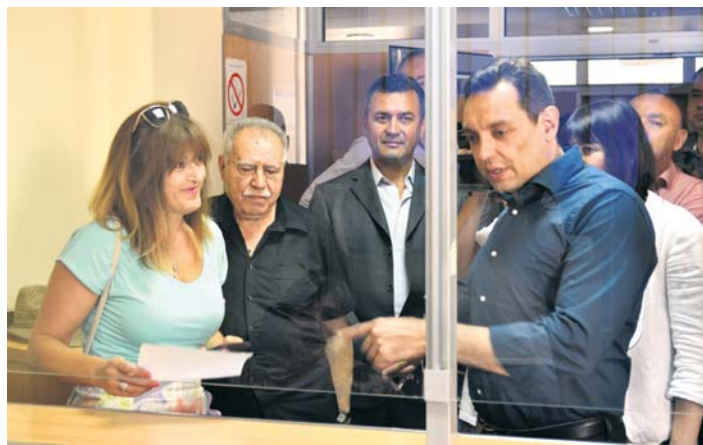
Корисници преузели поручене потврде на шалтеру Зајечарске филијале

јарди динара мање повучено из буџета Србије, а да је седам милијарди динара уплатила привреда која ради.