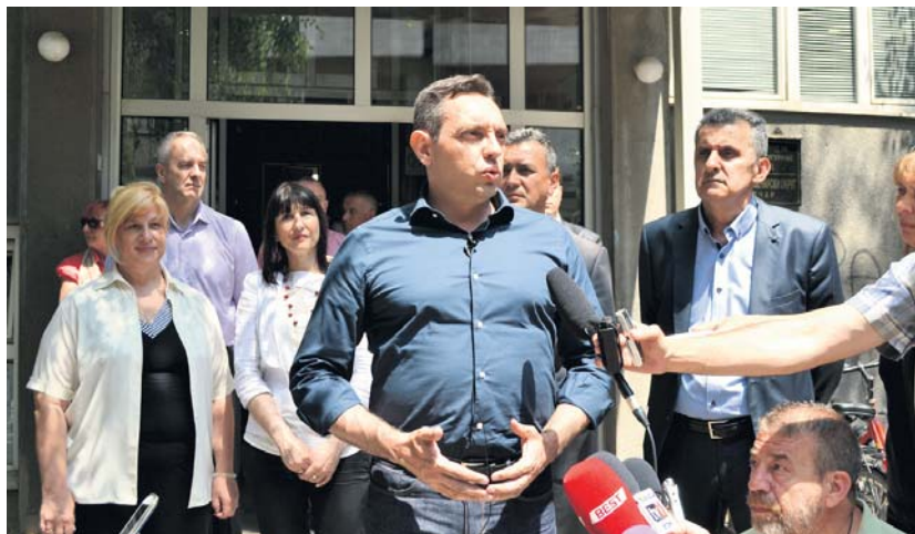
Представљању нових сервиса присуствовао министар Александар Вулин са руководиоцима РФ ПИО

иде набоље и оздрављује и да све мере које смо покренули дају своје резултате. Али оно што треба да радује све нас који јесмо и који нисмо пензионери, јесте то да се доприноси из привреде у Фонд ПИО сливају знатно већим