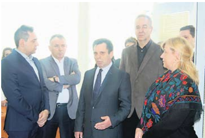
Руководство Фонда и министар Вулин на отварању испоставе