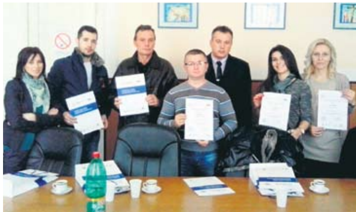
Са прошлогодишње доделе грантова

Тим поводом, у оквиру информативне кампање у Град-