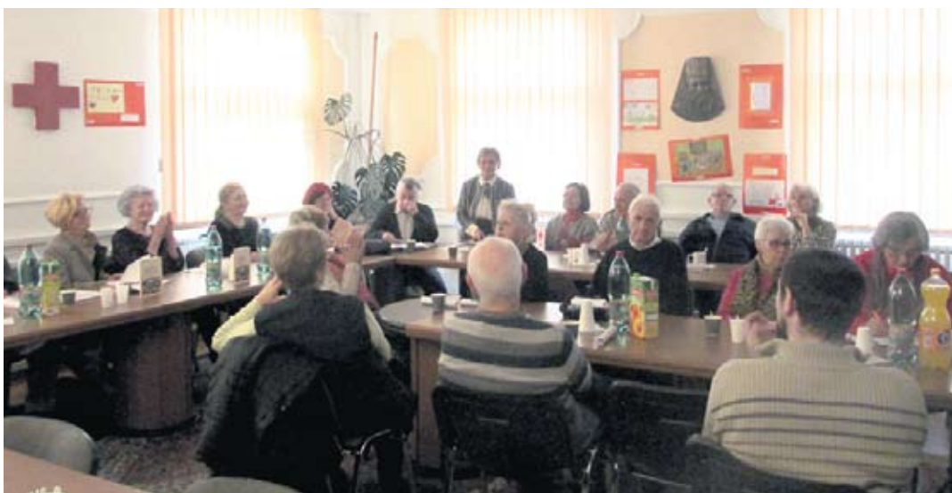
Промоција збирке песама „Пловећи животом“

Окупљени на представљању ове књиге поезије уживали су у песмама које су читали сами аутори или њихови пријатељи, а изрази на њиховим лицима су