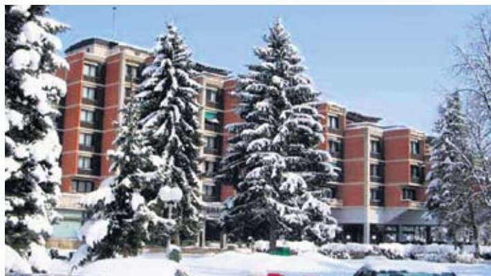
Хотел „Бреза“, Врњачка Бања

Додела ваучера трајаће до краја новембра 2016, али се препоручује да се раније искористи ова могућност пошто су прошле