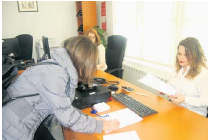
Издата прва потврда