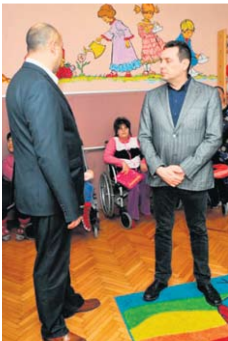
Министар Вулин посетио нишки Дом за децу и омладину „Душко Радовић“

– Институција породичног сарадника служи управо да помогне породици да се избори са проблемима, да пружи техничку, психолошку и сваку другу помоћ. Намера нам је да премрежимо Србију социјалним услугама и да свака општина у Србији има корпус бар основних услуга из области социјалне