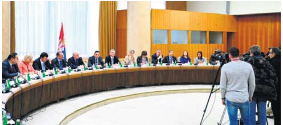
Округли сто у Палати Србија

Вулин је објаснио да ће у примени Закона бити ангажоване бројне инспекције и апеловао на раднике и послодавце да верују