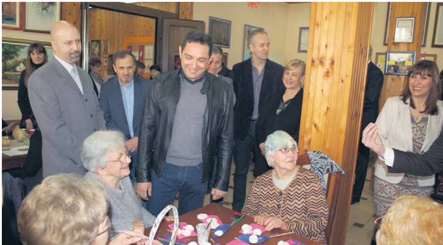
Министар Александар Вулин са руководећим људима Фонда у посети Геронтолошком центру Кикинда

У циљу побољшања квалитета у социјалној заштити старих и хронично оболелих особа, као и других особа у стању социјалне потребе, покренута је акција у којој лекари Републичког фонда ПИО викендом обављају прегледе корисника геронтолошких центара у целој Србији.