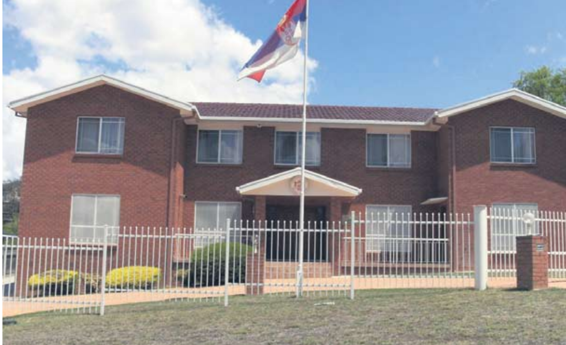
Амбасада Републике Србије у Аустралији

– Разлози што поступци остваривања права трају дуго су заиста бројни. Рецимо, процес прибављања потврде о навршеном стажу у иностранству сам по себи траје додатно дуже него када је у питању достава докумената из република бивше СФРЈ. Затим, честе су ситуације када је потребно расправити преклапање навршеног стажа осигурања у Републици Србији и иностранству, где посебан проблем представља различит начин приказивања, па и обрачуна стажа, а који се разликује од државе до државе. Примера ради, поједине државе стаж осигурања обрачунавају и приказују у данима, друге пак у недељама, треће у месецима, Француска у тромесечјима, Шведска у годинама. Све те различите потврде стажа треба прерачунати на начин који одговара нашем обрачуна стажа, односно „превести“ тај стаж у године, месеце и дане. Наравно, чести су и случајеви преклапања стажа, који понекад проистиче управо из чињенице да се стаж различито приказује, те је