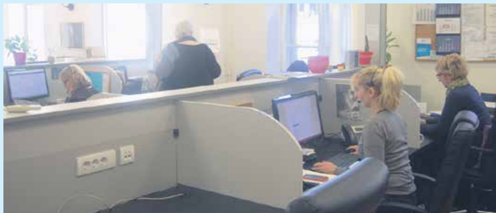
Брза, тачна и јасна информација, основни циљ рада Контакт центра

Да би правремено и тачно одговорили на сва питања, запослени у Контакт центру сарађују са свим филијалама Фонда, у целој Србији. Свака служба има овлашћена лица која у тачно предвиђеном року достављају одговоре да би странка добила квалитетну, јасну и тач-