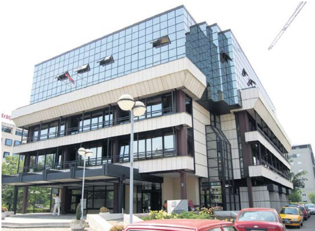
Служба Филијале за град Београд I, Нови Београд

Један од начина испитивања задовољства корисника и осигураника јесу анкете. У 2015. години Фонд је спровео 11 анкета, а укупно је анкетирано око 3.000 испитаника. Стандардна анкета за мерење задовољства корисника спроводи се једном годишње у свим филијалама Фонда. Задовољство корисника различитим аспектима услуга Фонда испитује се петостепеном скалом, а према резултатима анкете спроведене крајем 2015. године, просечан степен задовољства је висок и износи 4,23. Процент задовољних испитаника највиши је у случају љубазности запослених, па је овим аспектом услуга задовољ-