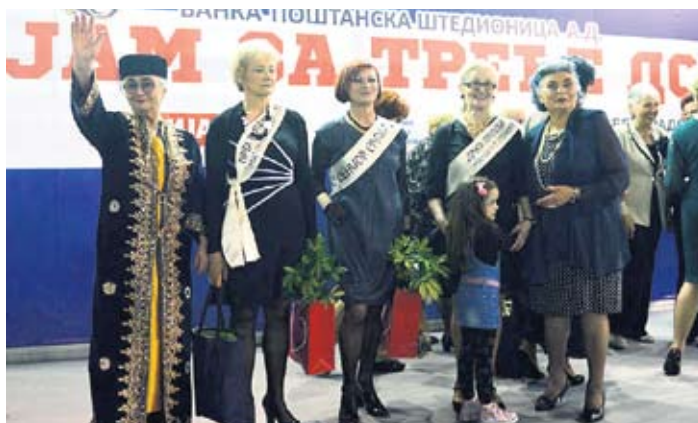
Изабране најлепше представнице трећег доба