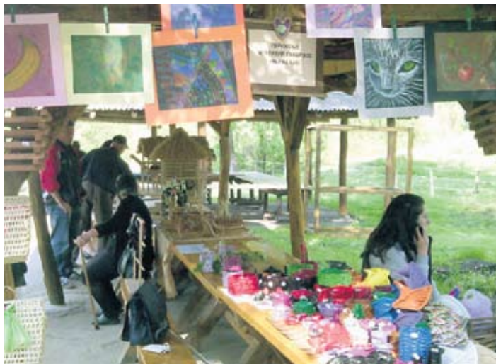
Предмети настали у радионици удружења спремни за продају

– Трудимо се да помогнемо нашим члановима и њиховим породицама у превазилажењу проблема на које наилазе због болести. Пружамо им све потребне информације и психо-социјалну помоћ, многи наши чланови учествују у креативним радионицама у оквиру удружења. Радионице су један од начина да се интегришемо у друштво, што је веома значајно и за удружење и за чланство. Од новца који зарадимо продајом радова купујемо справе и опремамо просторију за фи-