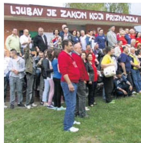
Акцијашки ветерани на зборном месту у Кикинди