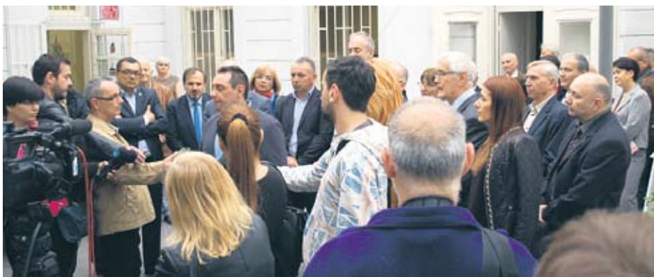
Министар у Новом Саду најавио нове видове подршке пензионерима

Министар је истакао и да је оријентација Министарства да се највећа могућа количина новца усмери непосредно корисницима, а како се буде повећавао ниво уплате у Фонд ПИО, тако ће и више људи трећег доба који су у пензији у наредном периоду ићи на опоравак у бање о трошку Фонда.