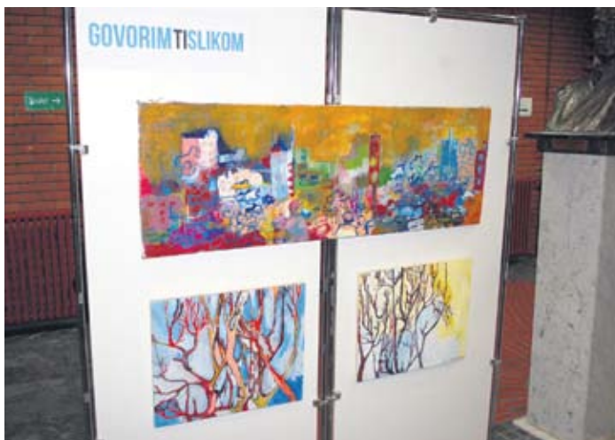
Једна од трибина посвећених уклањању предрасуда према оболелима од аутизма

Следиле су бројне активности: изложба ликовних радова младих са аутизмом „Слагалице” у галерији Рајка Мамузића, позоришна представа „Дар”,