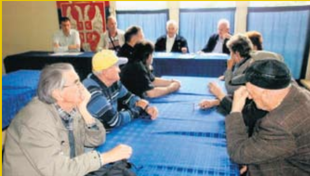
Свечана седница Месног одбора

Скупштина Удружења пензионера града Ваљева прогласила је Месну организацију пензионера „Нада Пурић“ за најбољу међу 20 месних организација. Наиме, ова МОП постигла је најбоље резултате у 2015. години, па јој је поводом тога уручена Захвалница за примерну сарадњу и помоћ у остварењу задатака Удружења, посебно у области социјалног и хуманитарног збрињавања својих чланова.