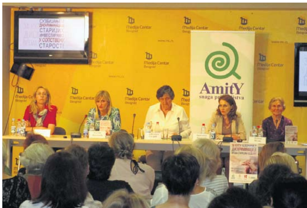
Конференција за медије: старије особе су често жртве занемаривања и злостављања

– Ови подаци су забрињавајући, при чему се овде ради о људима који су били спремни да кажу да су доживели и претрпели дискриминацију, а не говоримо о онима који још из различитих разлога не желе да признају или да прихвате чињеницу да се неко понашање према њима сматра дискриминаторним. Из тог разлога су нам овакви пројекти драгоцени. Они се реализују у локалним самоуправама у Србији и нису само усмерени на Београд,