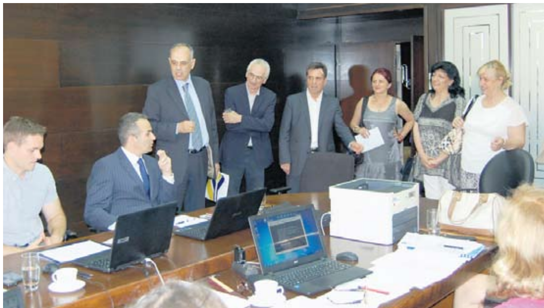
Директори српског и црногорског фонда обишли саветодавце