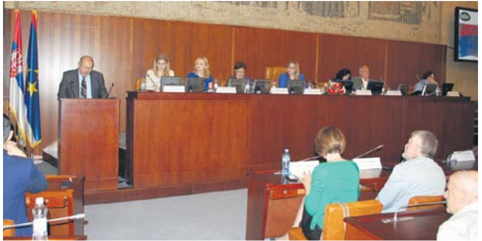
Консултативни састанак у покрајинском парламенту

Процес јавних консултација организован је с циљем укључивања свих заинтересованих актера у јавну дебату на локалном нивоу, како би својим учешћем допринели побољшању положаја жена у локалним срединама.