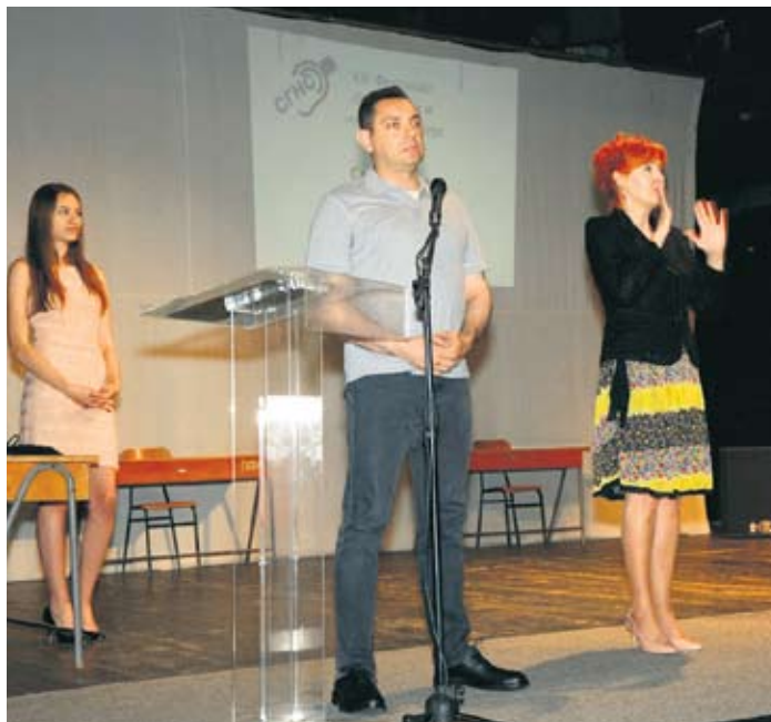
Министар Вулин говори на фестивалу у Великој Плани

– Оно што је важно и порука овог скупа, али и политике Министарства и Владе Србије, јесте да особе са инвалидитетом имају право да учествују у свакодневном животу. Они нису наш терет, већ су део наше заједнице као и сви други. Надам се да ће се и убудуће одвајати више новца, као и да ће послодавци разумети да треба да запошљавају ОСИ користећи подстицаје које за то даје држава. Трудимо се, колико је могуће, да мобилишемо и донаторе да помогну и да нађемо начина да ОСИ имају лакши живот – нагласио је Вулин.