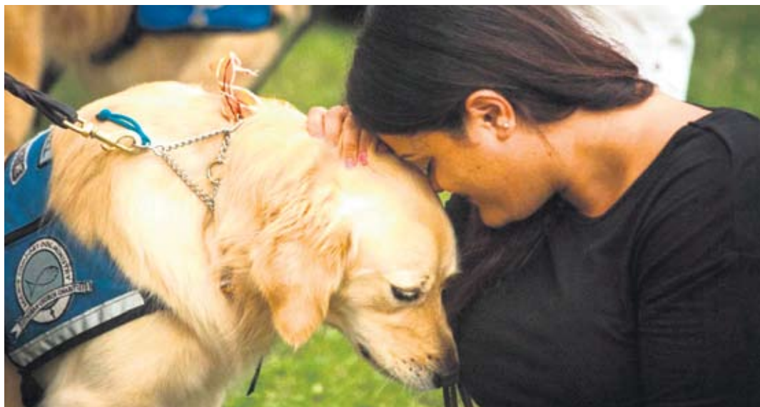
После трагедије у Орланду: подршка пријатеља

На питање зашто баш ретривери, Хецнер објашњава да су то пси добре нарави, које морате да заволите, а осим тога имају прекрасну длаку. Довољно је