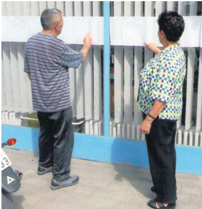
Пажљиво разгледање коначне ранг листе у Пироту

– Од 7.237 пријављених, 5.331 војвођански сениор испунио је услове из конкурса, а 1.906 њих не испуњава те услове (што је за 103 пензионера мање него прошле године). Од оних корисника пензија који не испуњавају услове из конкурса, најви-