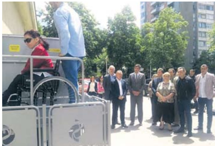
Челници Фонда и министар Вулин на пуштању рампе у рад

– Сада ће особе за инвалидитетом у Краљеву моћи да користе и ову филијалу у потпуности и више неће бити ни физичких препрека да остваре своја права и све оно што им закон гарантује – рекао је Вулин.