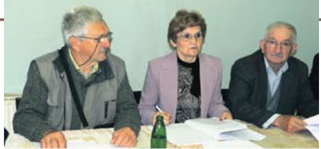
Са изборне скупштине пензионера у Љубовији