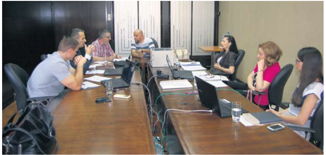
Све функционисало беспрекорно

Саветодавци из црногорског Фонда ПИО такође су били јако задовољни оваквим видом комуникације са грађанима и захвални колегама из српског Фонда ПИО што су са њима несебично поделили искуства у организовању саветодавних дана.