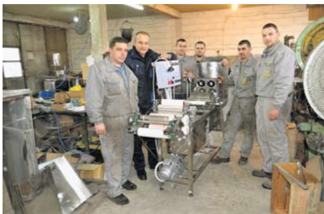
Пчеларска задруга „Рој”

Регионална развојна агенција „Златибор” из Ужица спроводи програм развоја приватног сектора у коме се унапређују могућности повећања прихода и запослености у југозападној Србији, у областима туризма и производњи традиционалних производа. Самозапошљавање је усмерено у пластеничку производњу, воћарство и пчеларство на подручју трстеничке општине.