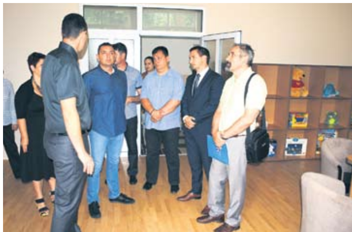
Министар Вулин присуствовао отварању сензорне собе

– Деца су приоритет сваког друштва и основни задатак сваке заједнице је очување и унапређење њиховог здравља. Сматрамо да су сензорне собе значајно терапеутско средство и да свака наша институција треба да има такву собу. Надамо се да ћемо захваљујући донацији Електропривреде Србије и других дародаваца успети то да урадимо до краја године. Министарство ће наставити са напорима да унапређује квалитет услуга у систему социјалне заштите и наравно да ћемо се посебно потрудити да развијамо и унапређујемо мале домске заједнице, попут ове у Неготину. То јесте најхуманији и најфикаснији облик бриге о деци са сметњама у развоју, уколико им је ускраћена брига биолошке или хранитељске по-