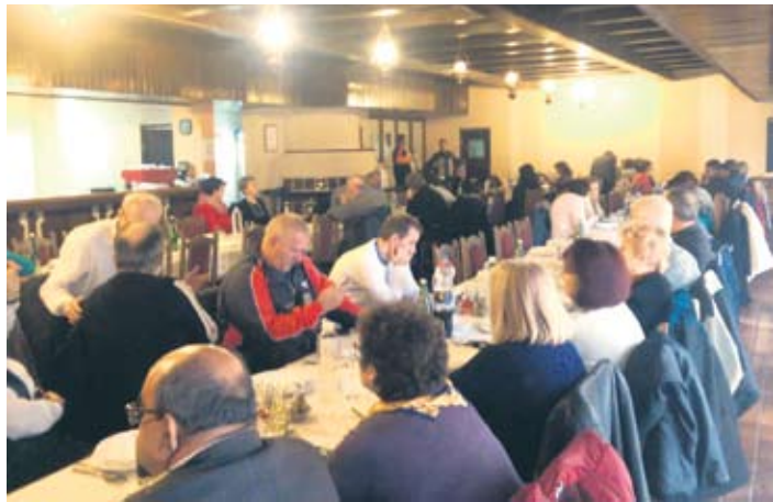
Једно од дружења у Кикинди

– Захваљујући Савету организација за особе са инвалидитетом уређени су прилази подесни за њих у Општој болници у Кикинди, у Градској библиотеци и још неким јавним службама. Уз помоћ донације НИС-а у згради