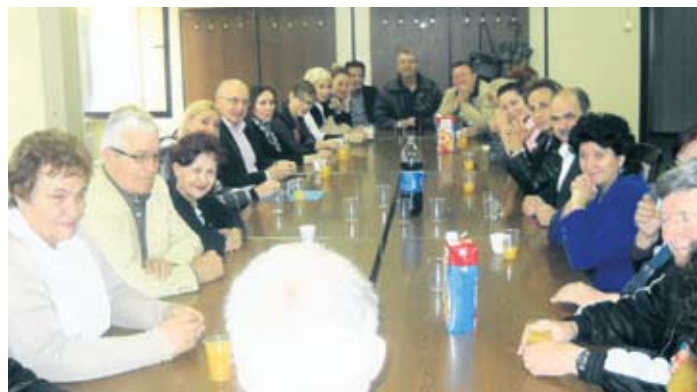
Лесковачки пензионери са гостима из других градова

– Током овогодишње 27. лесковачке „Роштиљијаде“, најве-