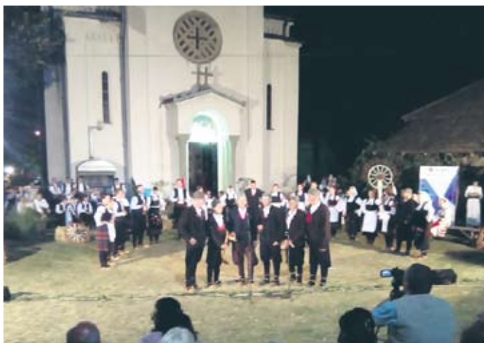
КУД „Владимир Станојевић“, Шуљковац

– Успевамо да отргнемо од заборава сваки стих, изворну песму и коло, шару на народној ношњи... Све то представља победу правих вредности над