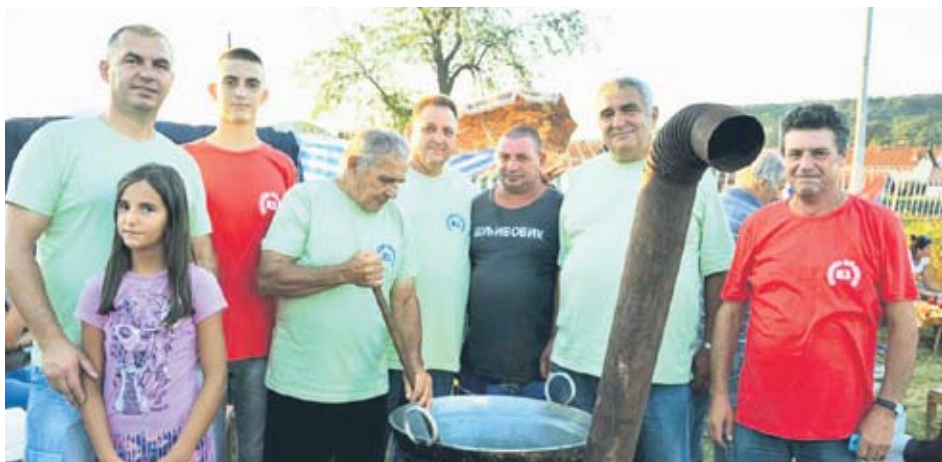
Екипа Лукавице, победник у справљању белмужа

Белмуж, сврљишки бренд, прави се по рецепту старом више од два века од младог сира и пројиног брашна. Процена је да се у три дана продало око пет тона белмужа. У справљању белмужа такмичило се 48 еки-