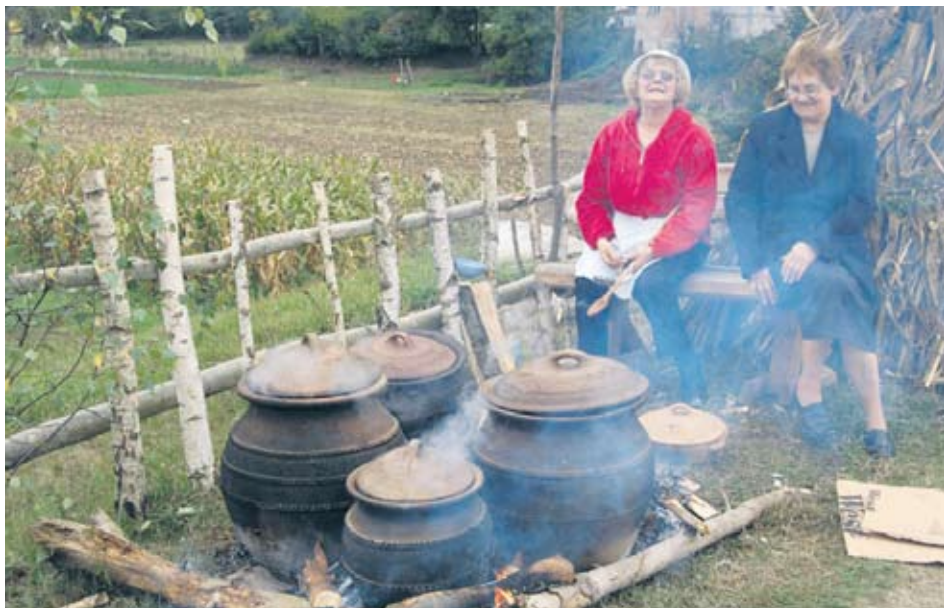
Практична употреба грнчарије

За протеклих 20 година Међународна колонија уметничке керамике у Злакуси угостила је 320 уметника из 28 земаља са свих континената. На колонији је за то време боравило и 16 ликовних критичара, неколико уметничких фотографа, археолога, архитеката и етнолога из 31 државе. Жеља организатора је да се у рад колоније укључи и што више младих уметника, па су ове годи-