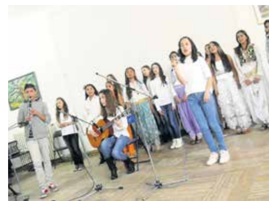
Млади Роми рано ступају у брак