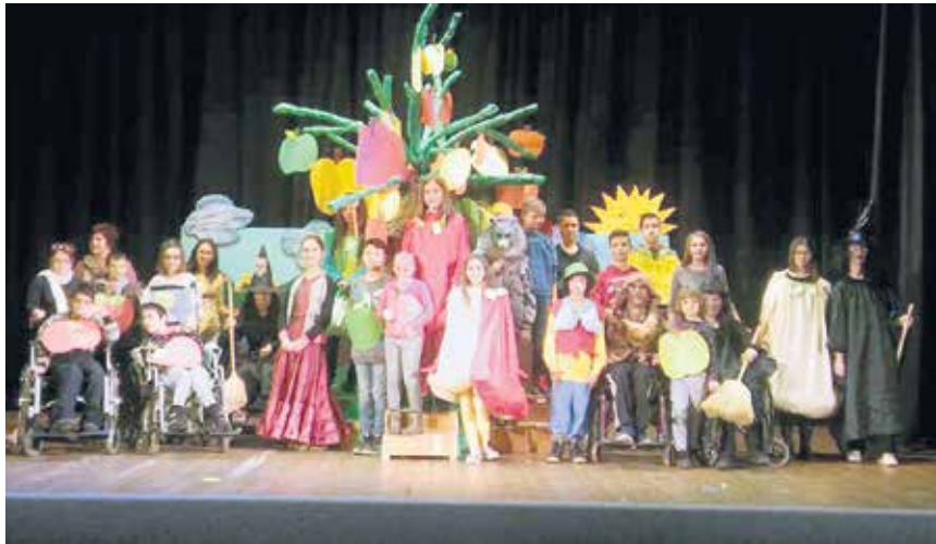
Учесници инклузивне представе „Шарене јабуке”

– Први пут је у нашем граду приказана једна оваква представа у којој су окупљена деца из редовне школске популације и деца са различитим сметњама у развоју. На овај начин смо желели да остваримо боље контакте између деце на-