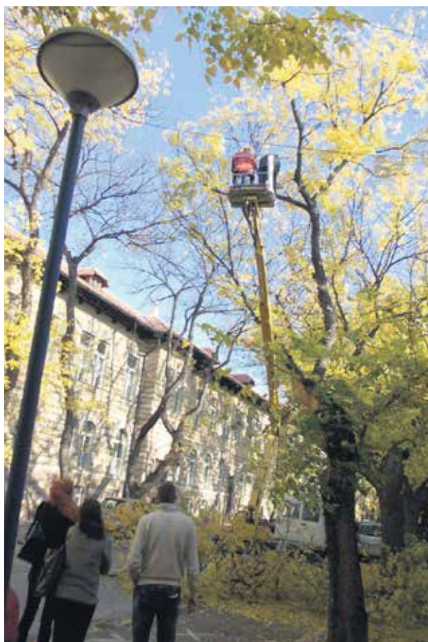
Кикиндјани брину о зеленилу

Високо признање Кикинда је добила и захваљујући широкозахватном озелењавању које се спроводи дугорочно. За то је заслужан Градски секретаријат за заштиту животне средине који је носио бројних акција у том смеру.