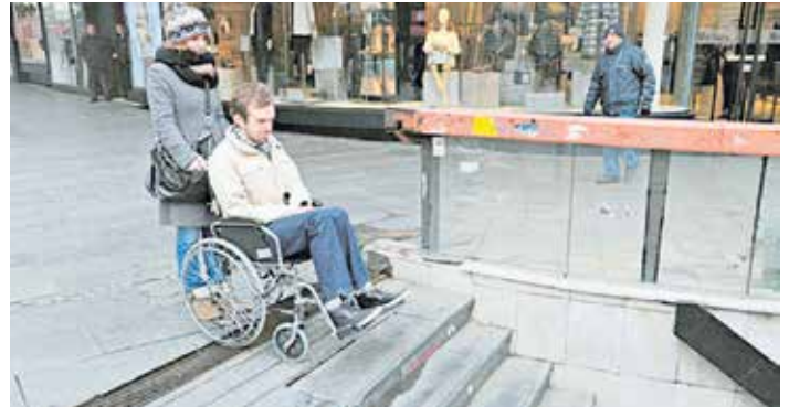
За инвалидна лица препреке на сваком кораку