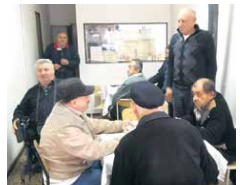
Дружење у новим просторијама

Иначе, у Сврљигу је око хиљаду лица са инвалидитетом укључено у рад два инвалидска, два пензионерска удружења и удру-