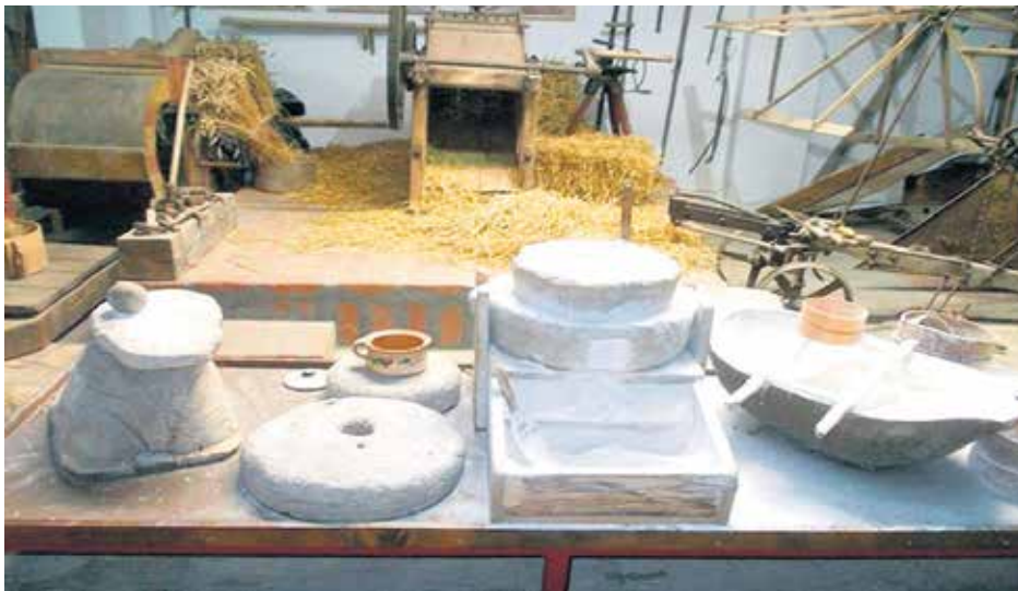
Вршалица са Старе планине у Музеју хлеба

А тај, већ чувени Јеремијин и српски Музеј хлеба, основан је 1995. у сремском селу Пећинци, ближе Шапцу него Сремској Митровици и Руми, на 1.200 квадрата затвореног и 600 квадрата отвореног простора. У