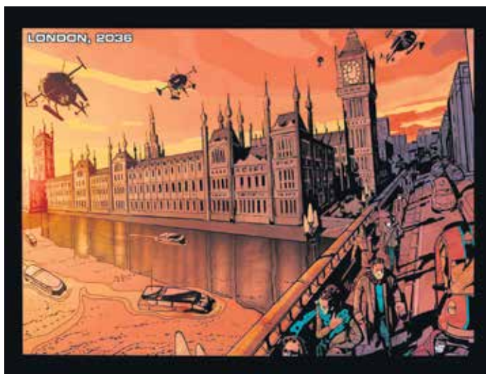
Мрачна визија: Илустрација из стрипа „Доктор Икс“

У атмосфери којој је тон изуметности давала и чињеница да се сасвим ретко пред скуп на највишем нивоу износи здравствена проблематика (последњи пут у случају еболе, а пре тога ХИВ вируса), представници 193 државе чланице донели