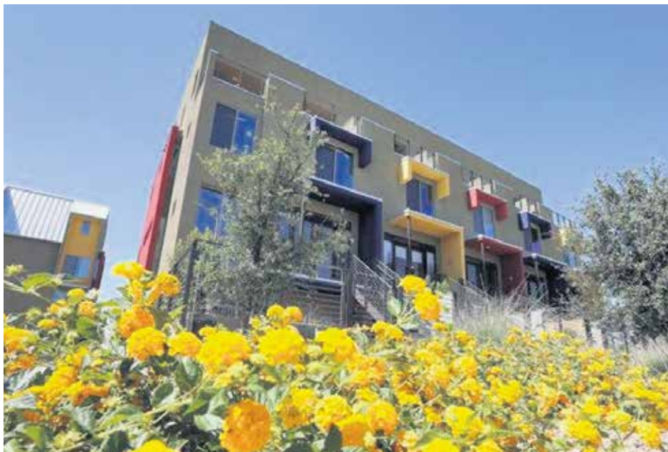
Зграда у Булевару деспота Стефана 686 има најлепше срећени улаз у Београду

Она је казала и да ако нико од станара не жели да се бави управничким послом, онда имају могућност да унајме професионалног