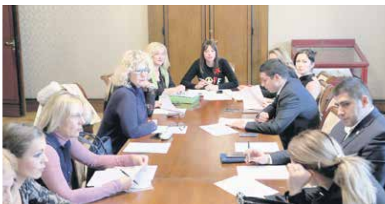
Савет за родну равноправност града Београда

На седници Савета за родну равноправност града Београда усвојен је извештај о формирању радних група у оквиру Савета за родну равноправност. Савет је формирао радне групе за борбу против насиља у породици, за родну равноправност у складу са Европском повељом, за економско оснаживање жена, за превентивну здравствену заштиту, као и за анализу стања радно-правног статуса запослених жена. Радне групе ће у оквиру својих мандата и задатака остварити континуирану сарадњу са релевантним телима, институцијама, установама и организацијама.