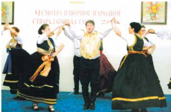
Гости из КУД „Александрово“ са буњевачким колом

Овог пута поново су наступили представници Удружења пензионера града Новог Сада, кикиндског КУД „Еђшег“ који изводи мађарски мелос, затим хор и фолклор Клуба Геронтолошког центра у Кикинди, и