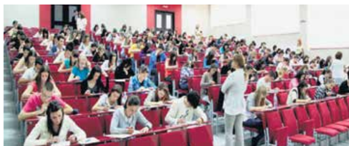
Студенти очекују стипендије

Град Ужице ће и даље стипендирати студенте, али на другачијим основама. За текућу школску годину критеријум ће бити тај што ће се у стипендирање укључити и привредници, а стипендије ће бити усмерене према јасно дефинисаним потребама ужичких фирми. По завршетку школовања, стипендисти ће одмах добити и посао у