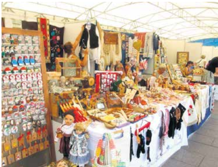
Рукотворине изложене у Нишу

У просторијама Удружења пензионера града Ниша приређена је изложба ручних радова чланица пензионерске организације Месне заједнице „Божидар Аџија“ из нишке општине Медијана и Активна жена Удружења пензионера Сврљига. Ово је прва зајед-