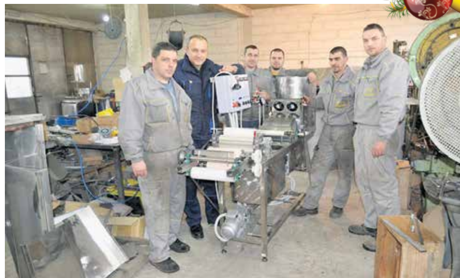
Пчеларска задруга Рој