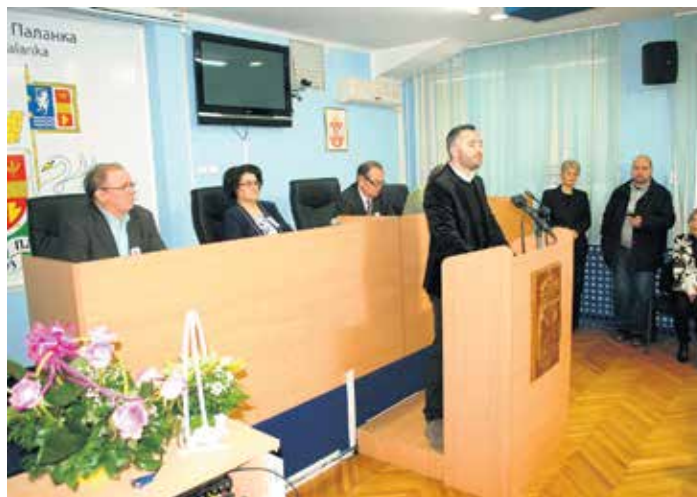
Руководство СИР и покрајински секретар