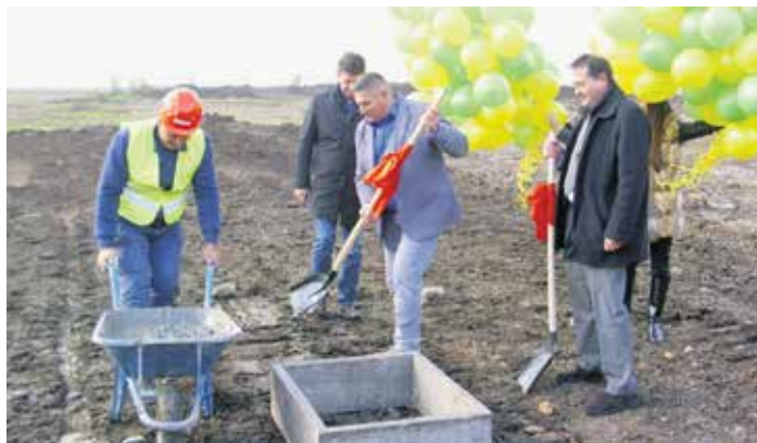
Полагање камена темељаца за изградњу погона италијанске компаније „Ла Линеа Верде“

– Специфичност наших погона је што смо једном ногом у пољопривреди, а другом у индустрији. Свако пољопривредно газдинство може бити наш