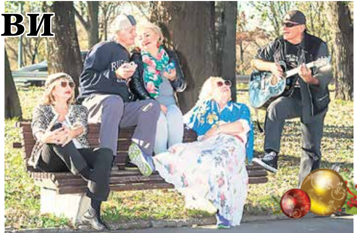
Са снимања за календар

Календар је замишљен тако да његову продукцију чине сениори активисти у споју са професионалном фотографијом. Тема календара су сениори у улози младих у разним активностима карактеристичним за млађу популацију. За ситуације су одабране оне које највише представљају данашњу омладину.