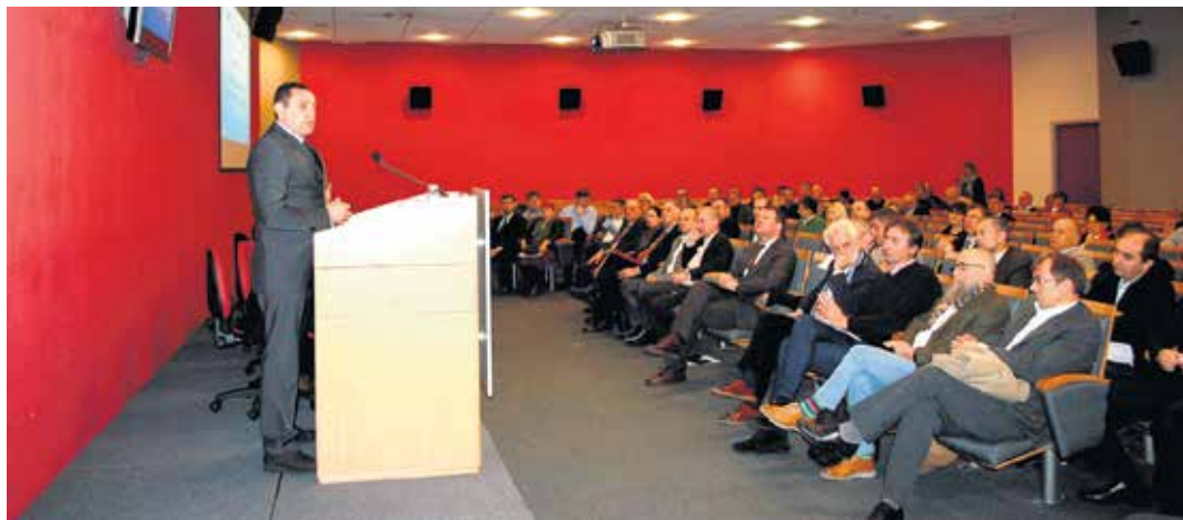
Александар Вулин, министар за рад, запошљавање, борачка и социјална питања, говори на Конференцији