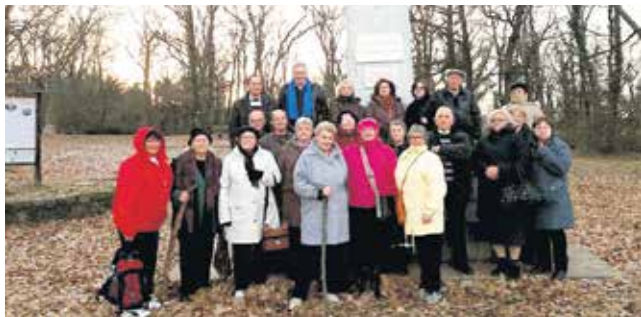
Пензионери савладали успон до Стражилова