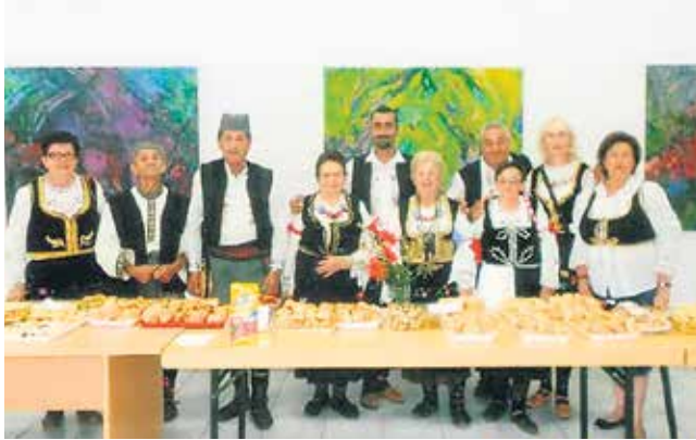
Певачка група „Рибница“

Корисници Дневног центра за старе у Берановцу код Краљева, њих педесетак, средином децембра били су у посети пензионерима у Дому старих у Матарушкој бањи.