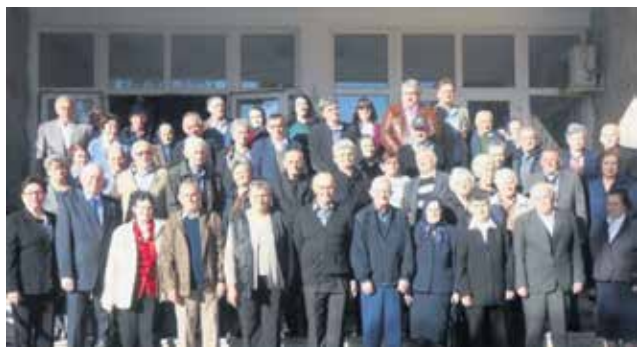
Заједничка фотографија слављеника

У Културном центру „Драинац“ у Блацу организована је девета „Златна свадба“. Том приком окупило се тридесетак брачних парова који су се венчали пре пола века, 1966. године.