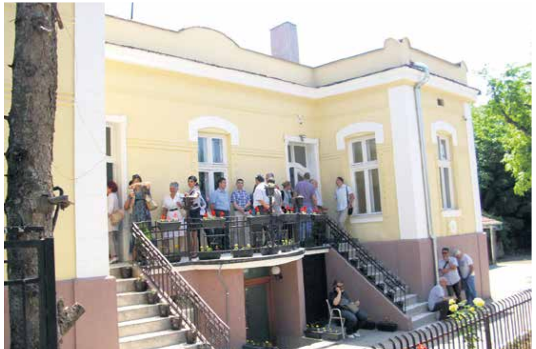
Гужва пред лесковачком Сигурном кућом

– Током 2016. године уочиште у Сигурној кући у Лесковцу, која се налази у центру града и видео-надзором је повезана са Полицијском управом, пронашле су 33 жене, 28 деце и три старије малолетнице из лесковачког краја. Наша сигурна кућа је углавном опремље-