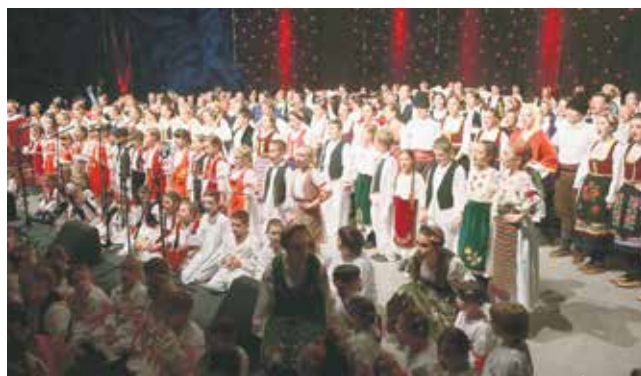
Велелепни приказ са гале приредбе „Гусала“