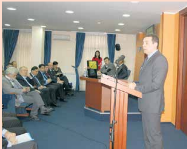
Министар Александар Вулин у Новом Саду

12.000 таквих лица ове године. Он је истакао и да је избрисано из АПР 19.144 предузетника, што је за 49,25 посто мање него у истом периоду лане и да је и то доказ да држава ствара бољи пословни амбијент, да су послови одрживији и да је то разлог што имамо повећану запосленост.