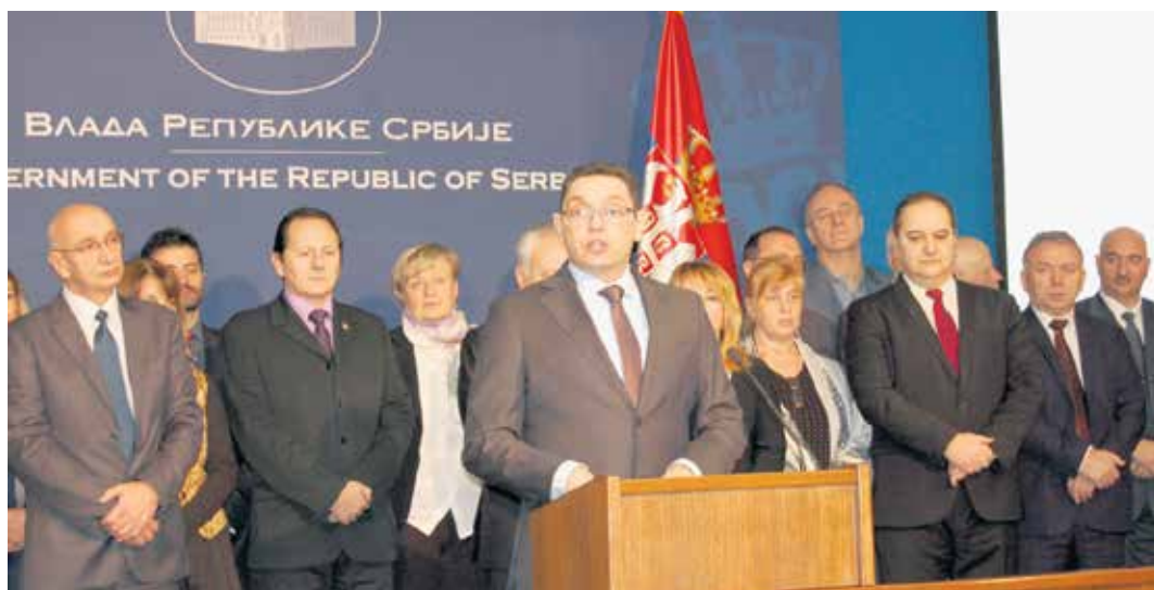
Са конференције за новинаре у Влади РС

Том приликом министар Вулин је, представљајући рад Министарства за рад, запошљавање, борачка и социјална питања у 2016. години, рекао да је то резултат опоравка привреде, јер би друга чи држава морала да дода тих 13,26 милијарди динара. Министар Вулин је овом приликом изјавио и да је у периоду јануар-новембар ове године са евиденције НСЗ посао добило 232.245 лица. Такође, и да је у Фонд ПИО ове године уплаћено 15 милијарди динара више него лане. Као важну чињеницу навео је унапређење рада Фонда увођењем нових електронских сервиса и за грађане и за послодавце. Осигураници и корисници сада могу да са својих рачунара електронским путем подносе захтеве за остваривање својих права, да прате кретање свог предмета и да помоћу калкулатора на сајту израчунају када стичу услов за пензионисање. Послодавци су први пут ове године могли електронски да достављају Фонду образац М-4 са подацима о зарадама и стажу својих запослених и нису морали да због тога чекају у редовима пред шалтером. Према речима министра Александра Вулина, током 2016. године у Фонду је примљено 35.000 М-4 образаца више него у 2015 (када је примљено 120.000). Захваљујући промени начина пријаве, ове године доказ о уплаћеним порезима и доприносима послодавци су