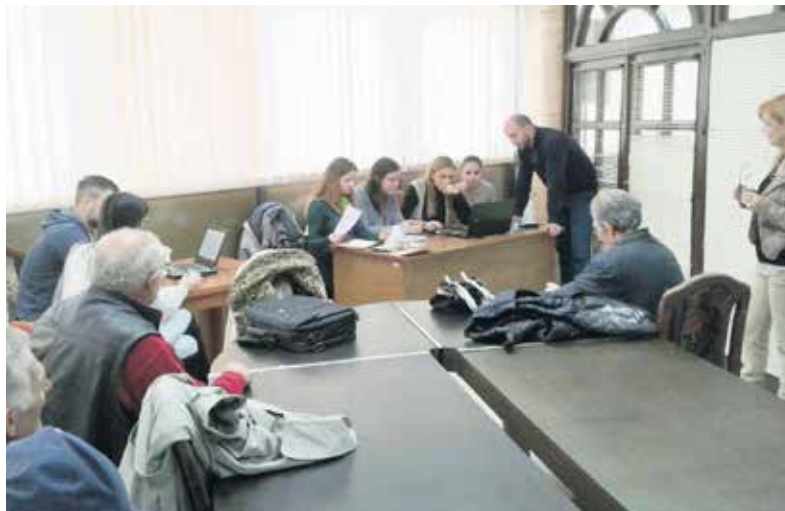
Међугенерациска солидарност: студенти помажу пензионерима да лакше замене здравствене легитимације

– Искористили смо погодност наше пословне зграде која је део Дома пензионера у Ваљеву и налази се у строгом центру града. Испланирали смо да се ови послови за наше најстарије суграђане обављају у простору клупске библиотеке Градског удружења пензионера. Ипак, и поред добре воље, најтеже је било обезбедити опрему. По-