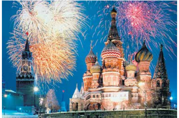
Величанствени ватромет у Москви

У Индији Нову годину најсвечаније дочекују у регионима у којима живе превасходно хришћани. Више од четвртине становништва индијске савезне државе Гоа чине католици. Тамо тог дана пролазе краљевске поворке, по свом обиму својствене за Индију. На улица-