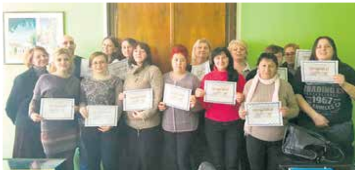
Неговатељице успешно савладале обуку

Након завршене обуке, акредитацију Републичког завода за социјалну заштиту добило је 14 неговатељица и геронтодомаћица које ће пружати услуге старијим суграђанима и особама с инвалидитетом (ОСИ), којима је потребна сва-