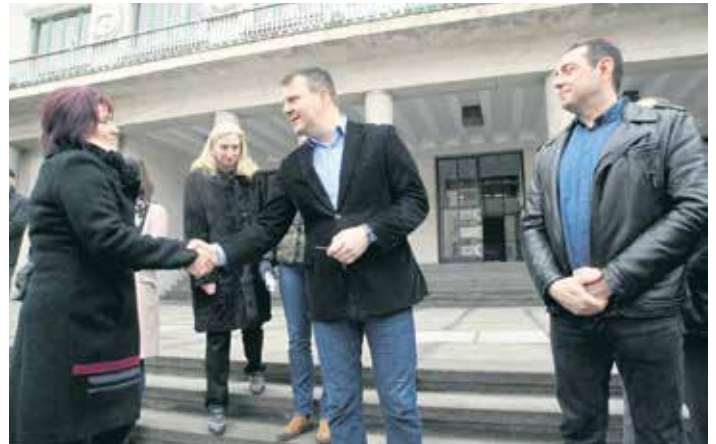
Игор Мировић и Александар Вулин приликом уручења кључева од донираних санитарних возила

Игор Мировић, председник Покрајинске владе, такође је истакао да је реч о важној донацији, која ће омогућити сигурнији и бољи транспорт, пре свега корисника услуга геронтолошких центара, али и других корисника у општинама у које су возила упућена.