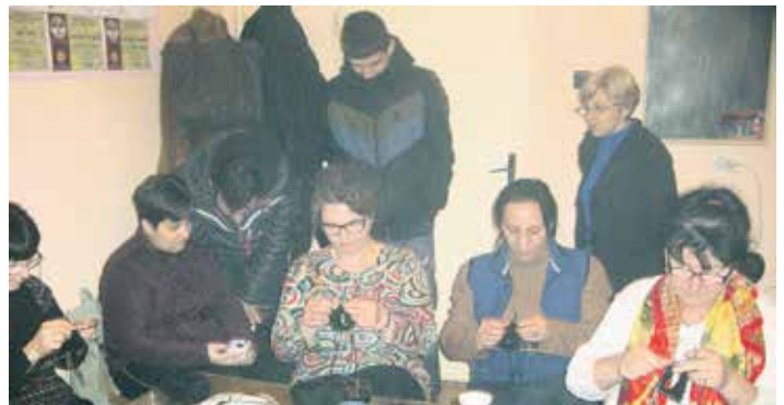
Као некада на сеоским прелима

Рготски КУД окупља младе раднике, студенте, средњошколце, ученике. Представљају Зајечар и Тимочку крајину на многим смотрема у земљи и иностранству, добијају признања, поносе се својим селом у коме је прво певачко друштво зачето још давне 1927. године. Касније, већ првих дана по ослобођењу, 1945. основано је Културно-просветно друштво „Боривоје Миленковић Срђа“, касније, седамдесетих