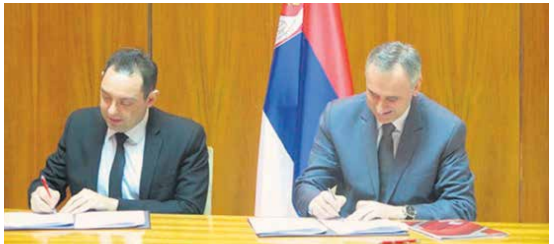
Александар Вулин и Зоран Мартиновић потписују Споразум

Зоран Мартиновић је изјавио да је НСЗ у 2016. години у активне мере укључила 146.000 незапослених лица, што је знат-