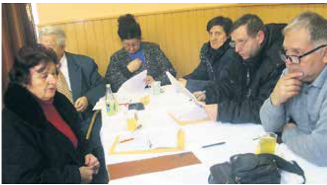
Са скупштине Удружења пензионера из Бајине Баште