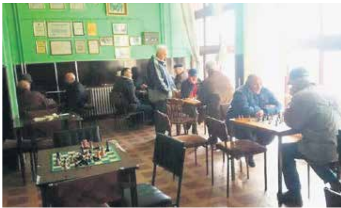
Добри услови у просторијама нишког удружења

Н изак животни стандард и сиромаштво, уз које често иде и болест, највише погађају пензионере па је један од задатака да се и ове године, у сарадњи са локалним самоуправом и ресорним институцијама, мења однос према тој популацији и заустави сиромашење, поручују из Удружења пензионера града Ниша. Кажу, тачно је да су пензије мало повећане, али, нажалост, материјални статус већине пензионера у граду је алармантан. Велики број је на ивици егзистенције, са пензијама које омогућавају тек пуко преживљавање. Није мали број ни оних пензионера који су социјални случајеви и да није народне кухиње били би гладни. Удружење пензионера Ниша улаже огромне напоре да се, у сарадњи са локалном самоуправом и надлежним органима, промени однос према најстаријој популацији и да се заустави даље сиромашење.