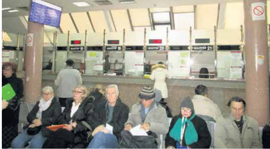
Шалтер сала београдске филијале