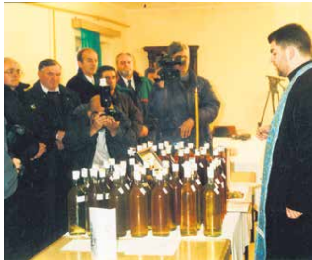
Ове године оцењивана 204 узорка вина

Удружење винара и виноградара „Шасла“ у Ићошу, селу у кикиндској општини, основано је 2001. године. Прво надметање у производњи квалитетних вина одржано је на сеоском нивоу да би потом прерасло у општинско и већ дуже време је војвођанско. Ово такмичење винара у част Светог Трифуна пропраћено је низом пригодних програма што доприноси развоју туризма у овом поднебљу. Ове године уприличено је