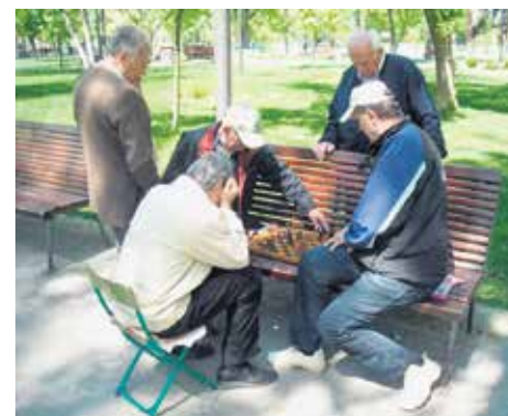
У очекивању дневних клубова

У очекивању брзог почетка рада дневних клубова, око 29.500 чачанских пензионера надају се да ће ускоро почети и изградња првог дома за старе у овом граду, који је приоритет локалне самоуправе већ двадесетак година. Међутим, ове године се озбиљније припремама, а из буџета су већ издвојена три милиона динара за израду пројектне документације и идеја је да један такав објект буде подигнут у делу садашње касарне где већ годинама нема војске.