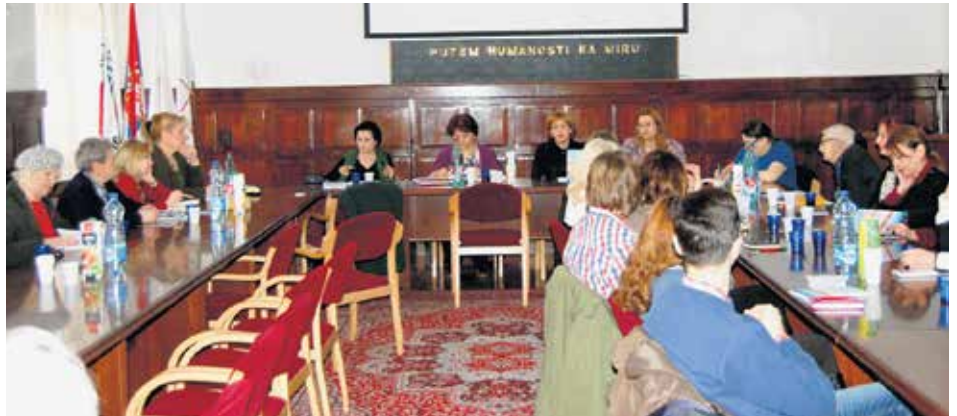
Скупштина Геронтолошког друштва Србије

Истраживање је спроведено у две фазе. Прва фаза представља истраживање медијских садржаја које је пратило пет најутицајнијих дневних новина у Србији током целе 2015. године, од оних озбиљнијих јутарњих до вечерњих и таблоидних, како би се сте-