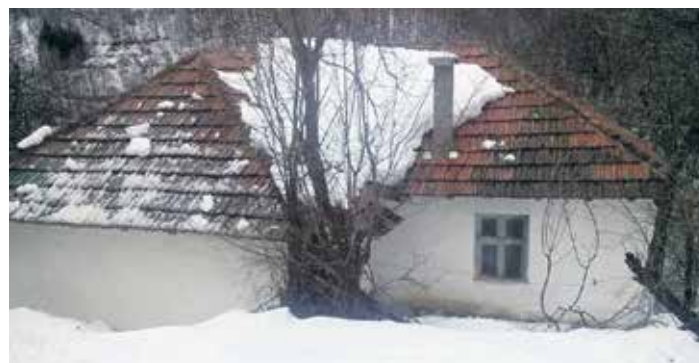
Детаљ из села Козила

Нема тачног податка када је настало ово село (помиње се 1885. година када је саграђена прва кућа покривена сламом, али се зна да су становници дошли из Црне Траве, а можда су се из Доброг Поља раселили по околним пределима).