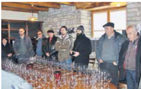
Крајински винари код колега у Истри и Випавској долини

Студијска група из источне Србије је у Истри посетила и Развојну агенцију Истре – ИДА која је развила знак квалитета – Istrian Quality (IQ), удружење „Винистра“, које окупла више од сто произвођача вина и са којима реализују заједничке домаће и ЕУ пројекте, као и Институт за винарство и туризам у Поречу, где су се упознали са уском пове-