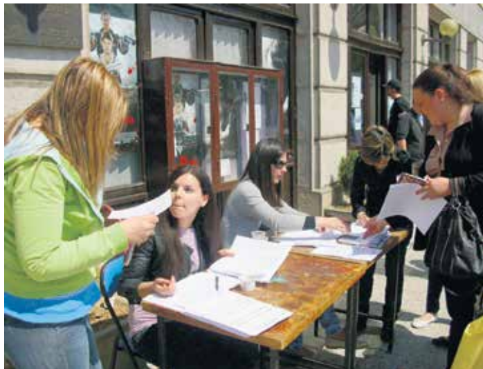
На сајмовима запошљавања највише младих

Кроз програм подстицаја запошљавања и мере подршке за по-