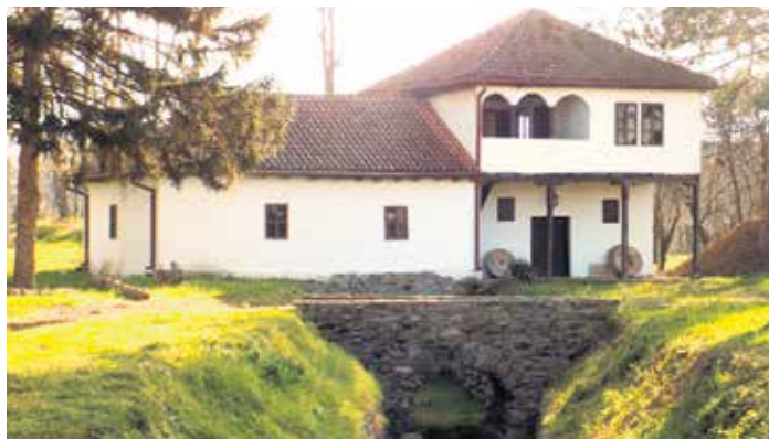
Обновљени стари млин

У последње три године овде се доселило неколико породи-