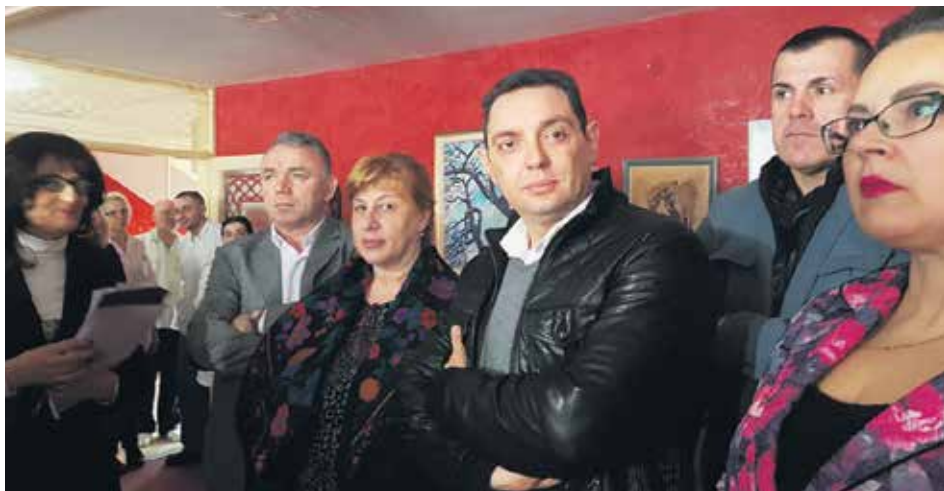
У ГЦ Крушевац

Министарство за рад, запошљавање, борачка и социјална питања издвојило је у претходне три године више од 37 милиона динара