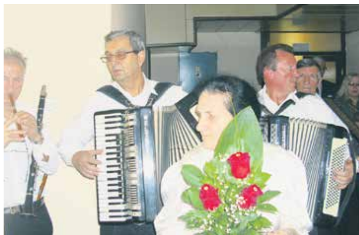
Дочек гостију из других клубова у Лесковцу

– То је прилика да са нашим колегама из суседних општина