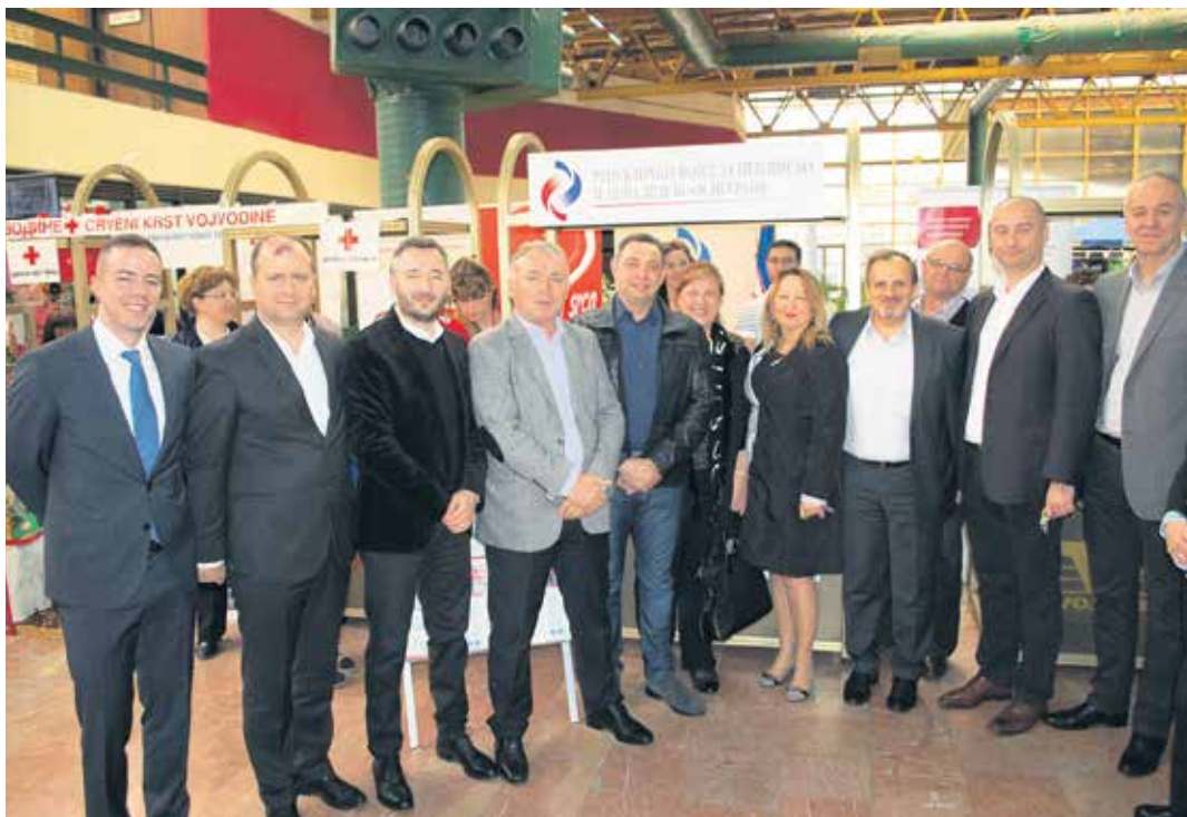
Министар Вулин са руководством Фонда и представницима Министарства

– Када се помогне деци ометеној у развоју помогло се и њиховим породицама и пријатељима, а подршка која се пружа старијима, не пружа се зато што су сиромашни већ зато што су у годинама када су им потребни помоћ и додатна пажња и поштовање. Социјална заштита у Србији се развија и у тој области никада нису била већа давања. Само ове године издво-