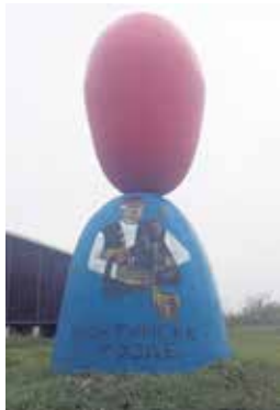
Споменик ускршњем јајету на улазу у Мокрин