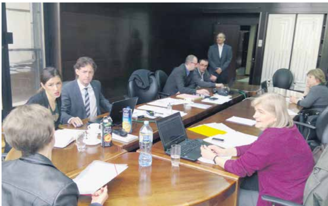
Саветодавци у разговору са странкама

– У старосну пензију отишла сам 2002. године са 54 године, а аустријску сам остварила 2004. године. Нисам дуго радила у Аустрији, око 17 месеци. Чула сам у нашем Фонду ПИО да ћу тек накнадно, кад напуним 60 година, добити аустријску пензију. Међутим, то се није догодило, него сам добила превре-