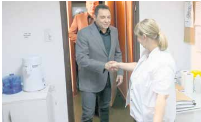
Министар Вулин у ГЦ Обреновац

Приликом посете Геронтолошком центру Обреновац, министар за рад, запошљавање, борачка и социјална питања Александар Вулин навео је да је захваљујући бољој запослено-