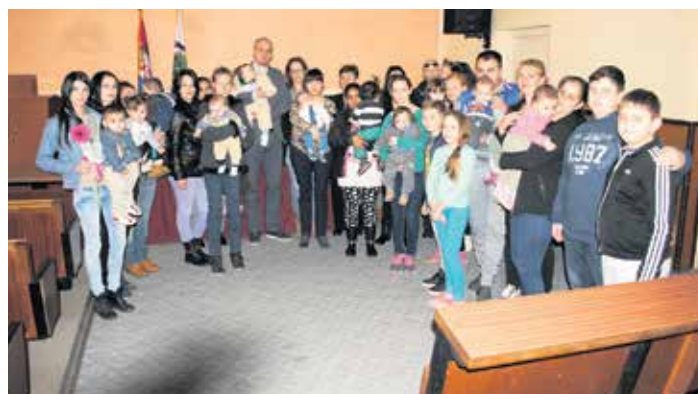
Општина обезбедила финансијску подршку