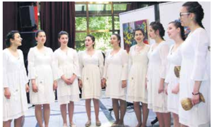
Гошће фестивала младе Румљанке

На концерту у Културном центру у Руми уз музику и препознатљиве песме хора из Шпаније, публика је запевала, а домаћини су и заиграли. Диригент шпанског