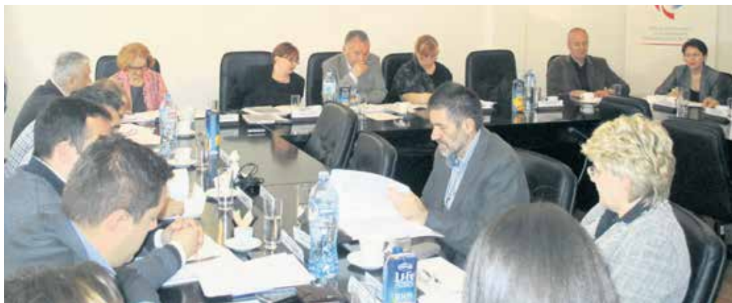
Са последње седнице УО РФ ПИО

Спровођење пописа је веома сложен посао, а да би био обављен ажурно, свеобухватно и квалитетно, формирано је више од 40 комисија за попис у организационим јединицама Фонда,