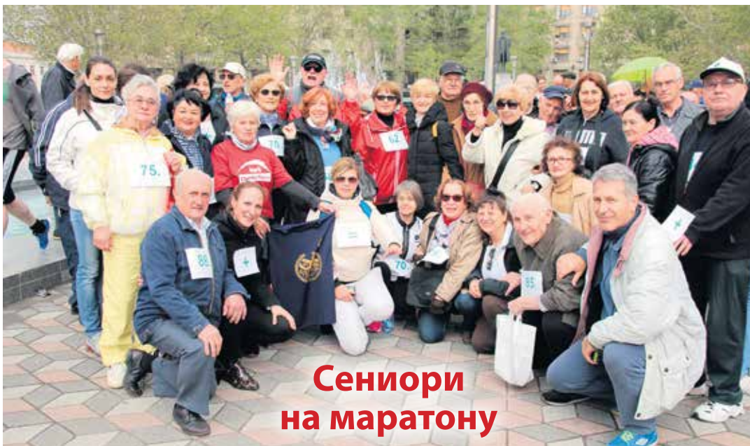
Сениори на маратону

Током три фестивалска дана било је и заједничких концерата, креативних радионица, размене знања и искуства, кулања, радних акција, као и такмичења у плесу, драмском и уметничком стваралаштву и дружења уз музику, све на тему међугенерациског зближавања. У фестивалским активностима и програмима су уз кориснике услуга домова и дневних клубова и центара учествовали и Школа за дизајн из Београда, основне школе „Влада Обрадовић Камени“ и „Раде Кончар“, XIII београдска гимназија, вртић „Принцеза Оливера“, затим културно-уметничка друштва „Србија 011“ и „Димитрије Туцовић“, „ПОД театар“ и остали многобројни сарадници. Д. Г.