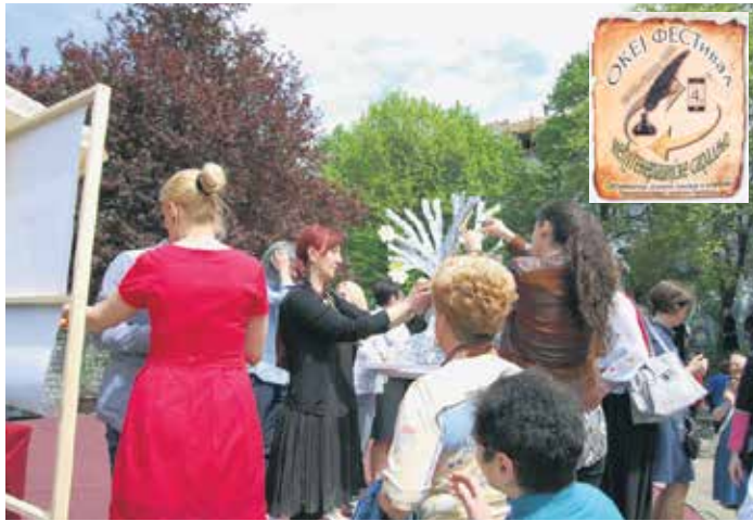
Оживљавање скулптуре дрвета

Циљ „Океј“ фестивала јесте унапређење међугенерациске толеранције и емпатије кроз