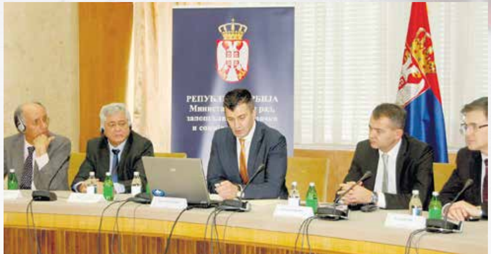
Министар Зоран Ђорђевић на конференцији за новинаре

У следећој години Министарство за рад, запошљавање борачка и социјална питања располагаће са 149,2 милијарде динара које ће наменски бити утрошене за оства-