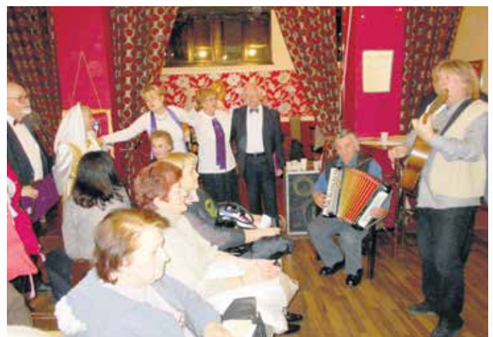
Весело уз музику

На великој сцени „Театра 78“ своје умеће показали су: фолклористи, певачи, глумци, рецитатори... Програм је изведен професионално и на највишем уметничком нивоу што потврђују аплаузи упућени извођачима. Сви заједно још једном смо доказали колики потенцијал имају грађани у позном добу и