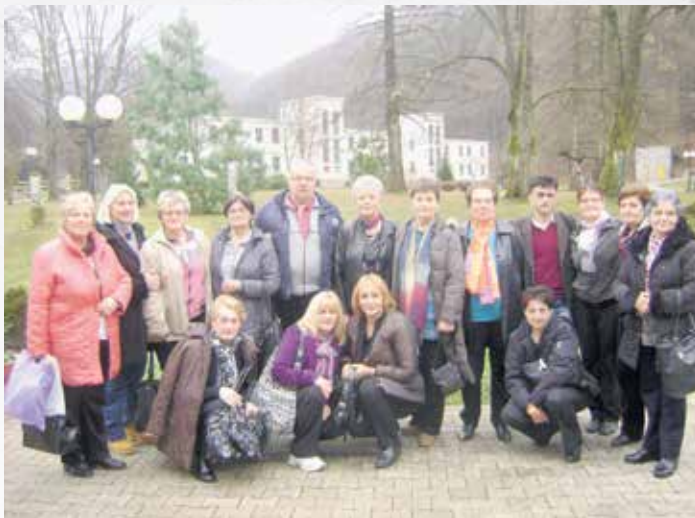
Са путовања у Републику Српску, бања Врућица Теслић

– Успели смо да најсиромашнијим пензионерима, без обзира на то да ли су чланови удружења или не, поделимо пакете помоћи, а општина Чајетина нам помаже и на друге начине. Наши пензионери путују, обилазе Србију и одлазе на дружења са пензионерима из дру-