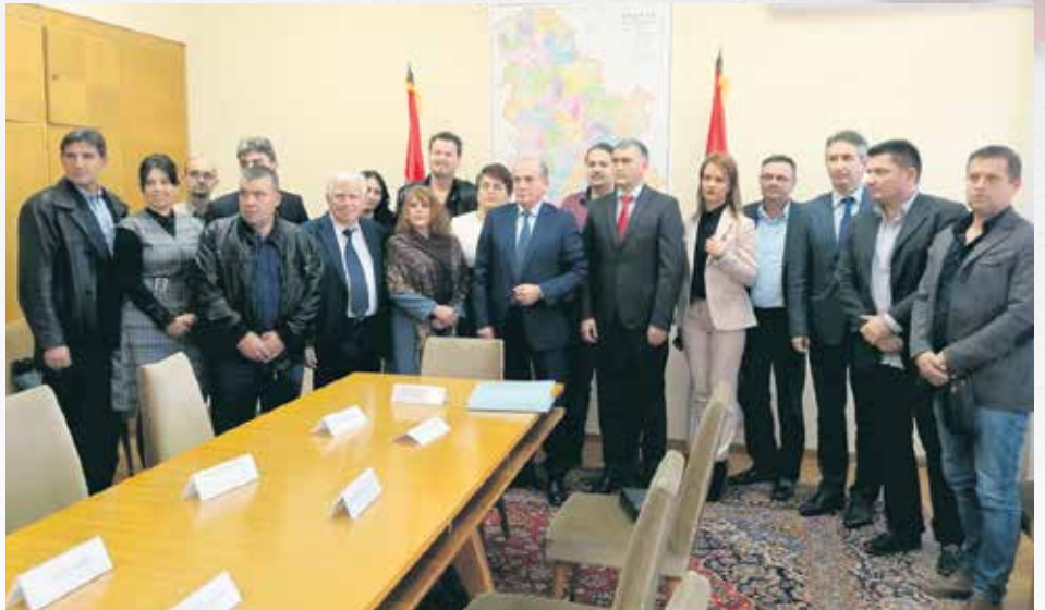
Свечаност у Палати „Србије“ приликом потписивања уговора

Произвођачи неће бити препуштени сами себи. „Сврљижанка“ има 217 задругара и они ће овом инвестицијом добити нови стимуланс за већу производњу за сада за домаће купце, а о извозу треба размишљати када задруга стане на здраве ноге и почне да производи и веће количине према захтевима страног тржишта. На сврљижким пољима и њивама највише засада, близу 800 хектара је под шљивом, вишња је засађена на око 200 хектара, а јагода, лешник, купина, малина, јабука, крушка на мањим поседима. Произво-