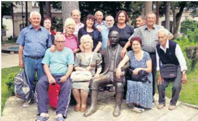
Прва месна организација пензионера Крушевца у Рибарској бањи