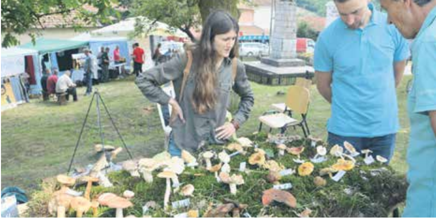
ГРБАВЧЕ КОД СВРЉИГА