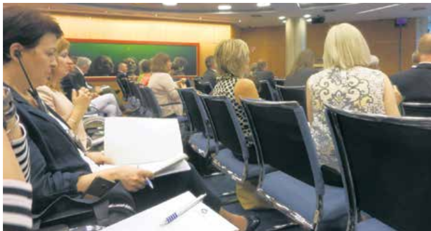
Скупу у Бечу присуствовали и представници РФ ПИО

ва и сл.) прелива се на инвестицију за јачање персоналног саветника. Пример негативних решења, која се не доносе у поступку, већ се подразумева разговор подносиоца захтева са персоналним саветником, резултирао је са 40 одсто мање поднетих жалби него у упоредном периоду када није постојала могућност личног контакта странке и саветника. Такође, добар ефекат личне комуникације показују саветодавни