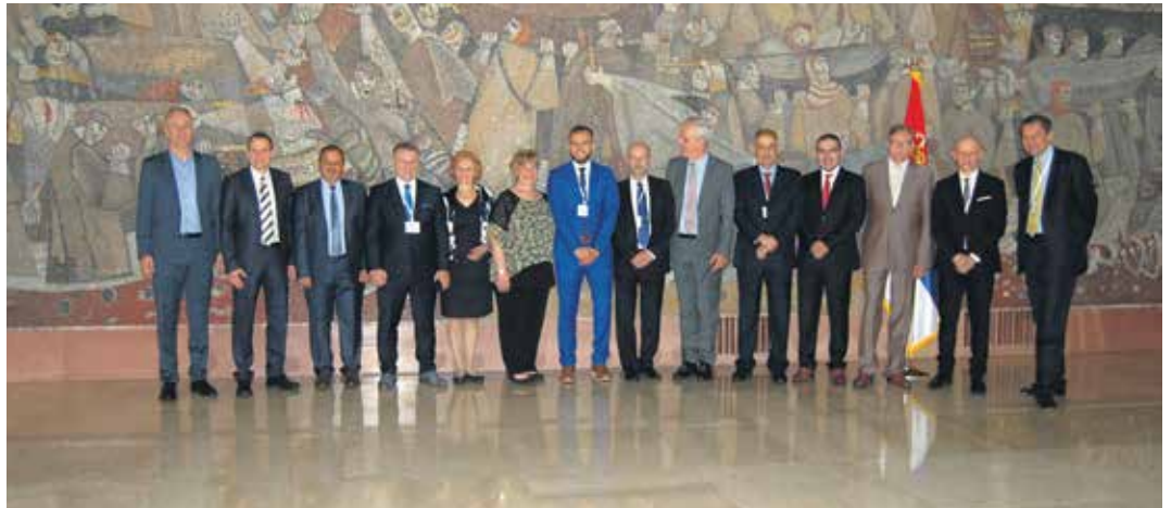
Директори фондова и завода за пензијско и инвалидско осигурање

На сусретима се традиционално разматрају питања ефеката електронске размене података, информације о новинама у законодавству и проблеми у реализацији споразума о социјалном осигурању