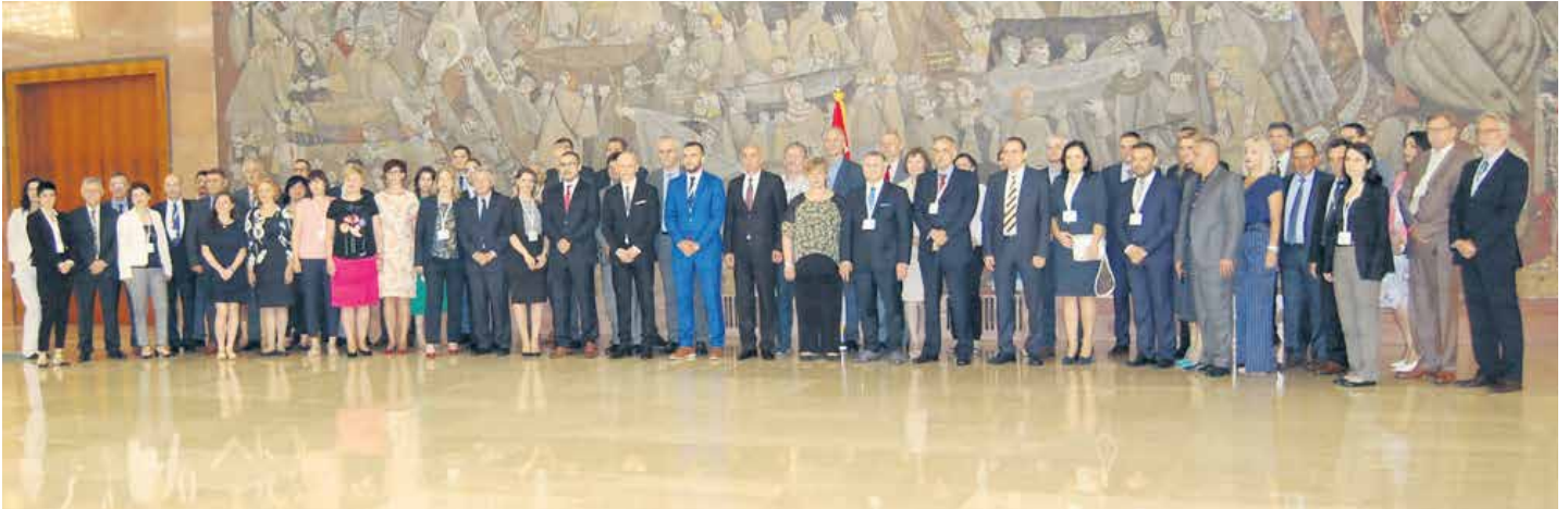
Сви учесници скупа

сусрета. Значајан је податак да је 1. марта 2018. године ступио на снагу нови Закон о пензијском/мировинском и инвалидском осигурању којим су измењени услови за остваривање права из пензијског и инвалидског осигурања и промењен начин обрачуна пензија у Федерацији Босне и Херцеговине.