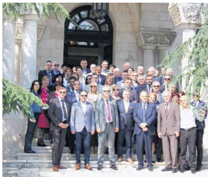
У посети Краљевском двору