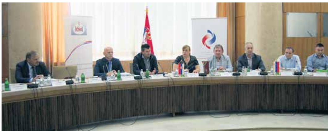
Министар Зоран Ђорђевић поздравио учеснике сусрета

И на овим сусретима су, што је већ традиционално, разматрани ефекти до сада успостављене електронске размене података, али и информације о новинама у законодавству и проблеми у реализацији споразума о социјалном осигурању. Поред тога, и овом приликом учесници су разменили информације о изменама прописа у области пензијског и инвалидског осигурања које су наступиле од одржавања претходног