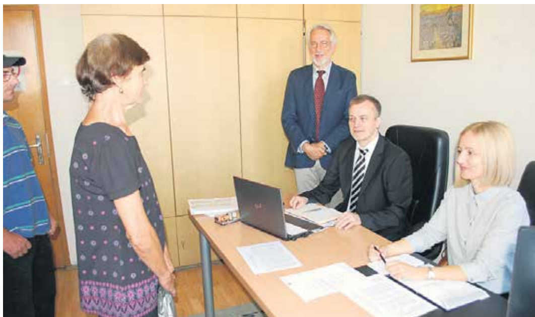
У Новом Саду било изузетно интересовање за дане разговора

Разговорима у Новом Саду присуствовало је укупно 128 странака, првог дана 65, другог 63, а од тог броја петнаест странака је дошло и без претходно закажаног термина. Најважније