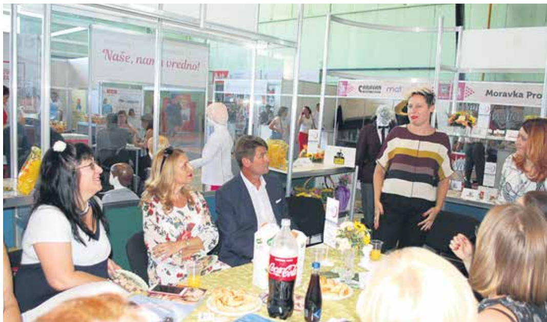
Презентација на штанду за женско предузетништво

– После лепих вести из Пекинга, могу да кажем да све што смо радили на промоцији Зрењанина као доброг места за привређивање и инвестирање,