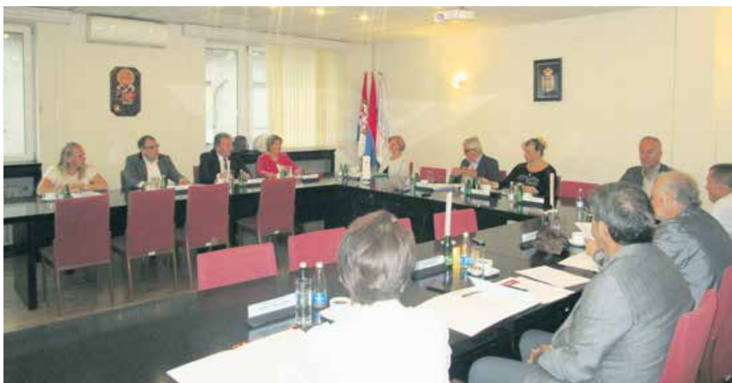
Са седнице УО РФ ПИО