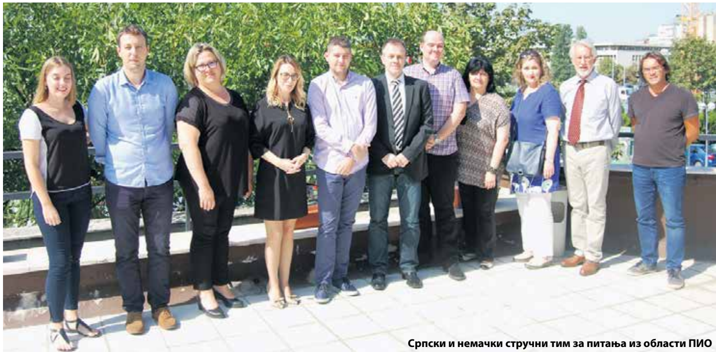
Српски и немачки стручни тим за питања из области ПИО

Овогодишњи, седми по реду, саветодавни дани између представника фондова пензијског осигурања Србије и Немачке успешно су одржани 18. и 19. септембра у Новом Саду и 20. септембра у Београду. Три тима саветодаваца била су на услузи грађанима који су дошли по информације и правне савете у вези са остваривањем права у ове две државе.