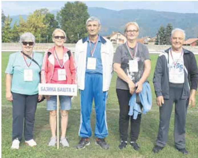
Победничка екипа Бајине Баште на Мини олимпијади

– Удружење пензионера из Бајине Баште заслужује све похвале за рад. Једно је од најактивнијих у Србији. Посебно бих похвалио ентузијазам и ангажованост његовог председника,