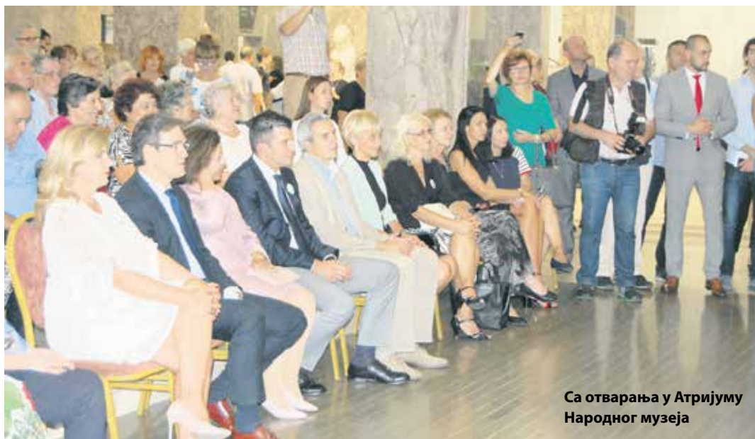
Са отварања у Атријуму Народног музеја

Он је истакао да су старије особе један од приоритета Владе Републике Србије и да ће Ми-