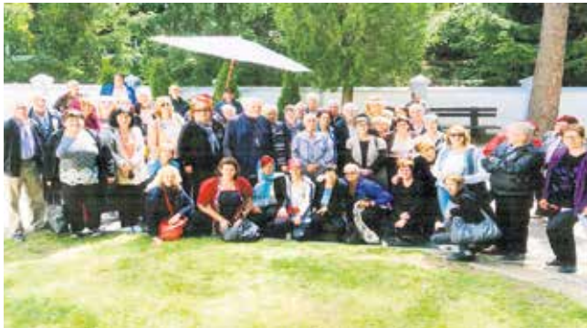
На путу за Сокобању

Удружење пензионера из Тополе у оквиру својих активности организује бројне излете. Од марта до септембра пензионери из овог удружења обишли су многа места у Србији. Најчешће се посећују бање, манастири и друге знаменитости Србије. Са ових путовања пензионери носе лепе успомене.