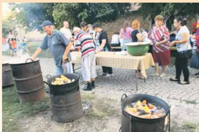
Кувани кукуруз право из казана

Иначе, Бубалице су пролећни народни обичај за забаву младих. Некада у време седмонедељног ускршњег поста није