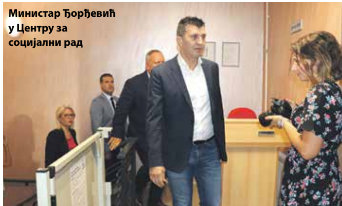
Министар Ћорђевић у Центру за социјални рад

Министар Ћорђевић је најпре посетио недавно реновиран Центар за социјални рад, где је представио планове Министарства за наредни период који се односе на начин изградње нових установа и њихово функционисање, и који ће се једнако примењивати у целој Србији, у циљу пружања најбољих услуга грађанима. Како је нагласио, објекат Центра за социјални рад у Лесковцу сада спада у ред најмодернијих у земљи, а решен је и проблем његове приступачности за особе са инвалидитетом.