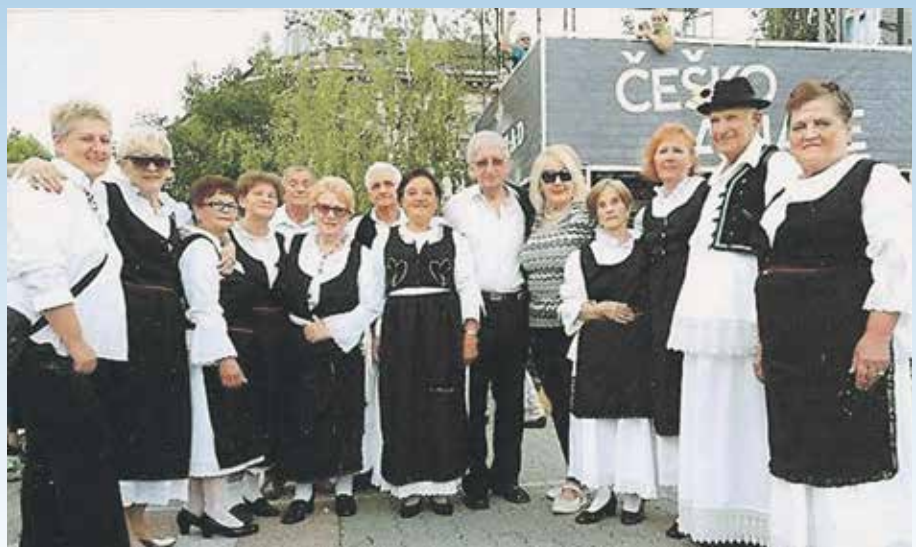
Успомена са вршачког Грожђебала

У оквиру КУД-а „Пензионер“ делују фолклорна, рецитаторска и литерарна секција, као и хор. Како каже председница, члановима је заједнички рад начин да