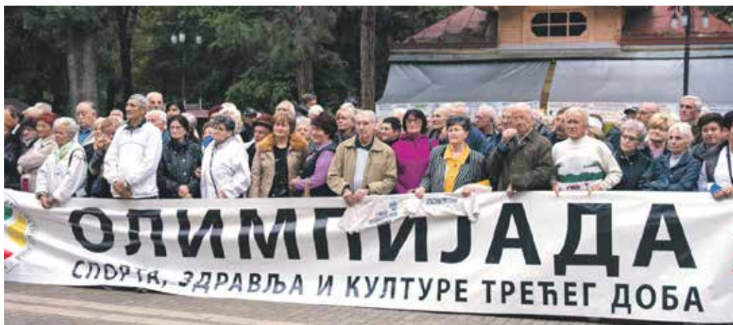
Са отварања прошлогодишње Олимпијаде