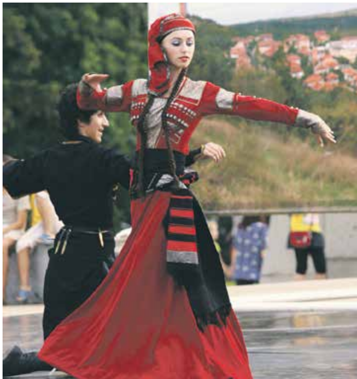
Наступ фолклорне групе из Русије

Током трајања фестивала сва фолклорна друштва наступила су на градском тргу и дефиловала градским улицама приказујући ношње и културну баштину земаља из којих долазе. За време трајања фестивала организован је етно базар, изложба радова примењене