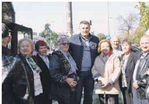
Пред полазак на једно од путовања

Поред позајмице, најугроженији пензионери могу рачунати на помоћ у храни и хигијенским средствима.