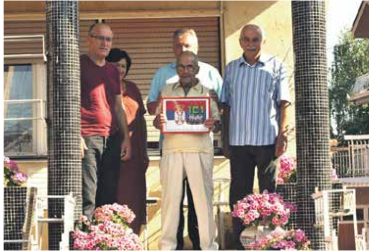
Слављеник са гостима и својим цвећем