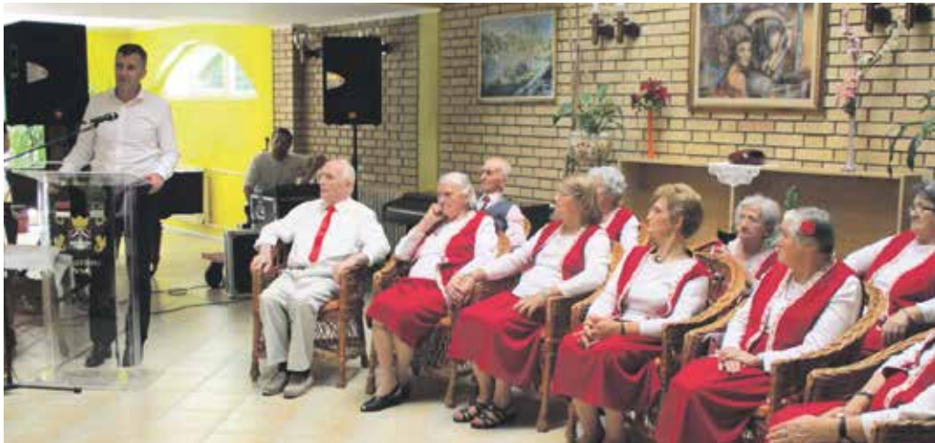
Министар Зоран Ђорђевић у ГЦ „Срем“

Средином августа званично је отворен комплетно реновиран објекат Геронтолошког центра „Срем“ у Руми, а поводом окончања реконструкције, установу је посетио министар за рад, запошљавање, борачка и социјална питања, Зоран Ђорђевић, као и представници локалне самоуправе.