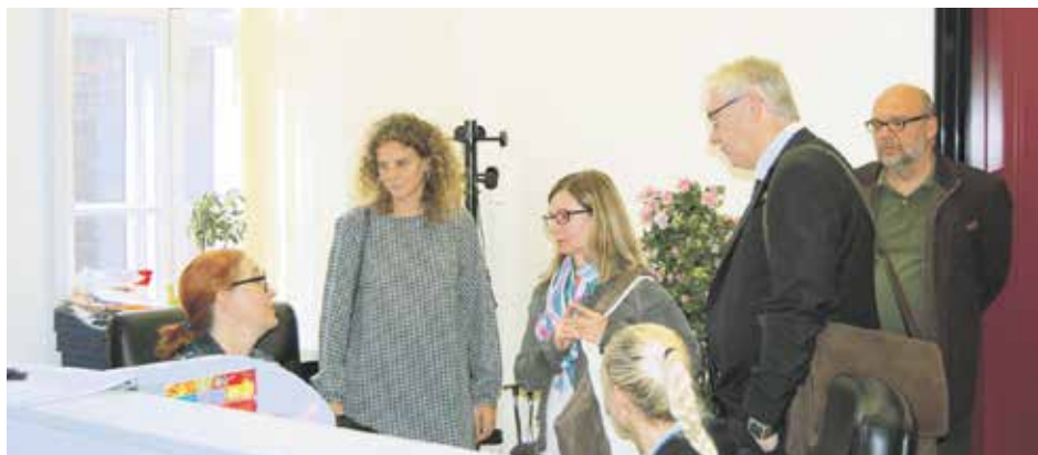
Гости из аустријског Завода у Контакт центру РФ ПИО

Гости из Аустрије су имали и доста питања, посебно у вези са начином остваривања права из ПИО, електронском провером стажа осигураника и подношењем захтева за пензију електронски. Према њиховим речима, у аустријском Заводу за пензијско осигурање од 2006. године спроводи се пројекат чији је циљ да се сви документи из папирног облика пренесу у електронски. Наиме, када осигурано лице поднесе захтев у папирној форми, тај захтев се скенира и апликација аутоматски податке из захтева пребацује у одговарајуће базе. То значи да референт не мора више да се бави подацима из захтева, него то чини сама апликација. Главни циљ пројекта, за који очекују да ће ускоро бити постигнут, јесте да када осигурано лице поднесе захтев, већ за неколико сати електронски добије повратну информацију о томе шта евентуално недостаје, шта треба да достави, која права испуњава и др., а цео тај процес обављаће искључиво апликација.