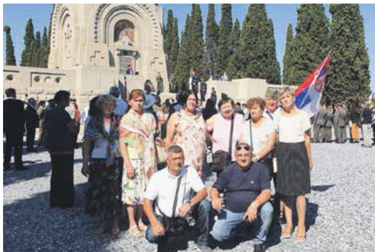
Српски пензионери на Зејтинлику одали почаст српским ратницима

Како је рекао, сведоци смо да данас поједине земље покушавају да ревидирају историју и да то не смемо да дозволимо, те да су Крф и Солун места која најбоље сведоче шта се дешавало са српским народом у прошлости.