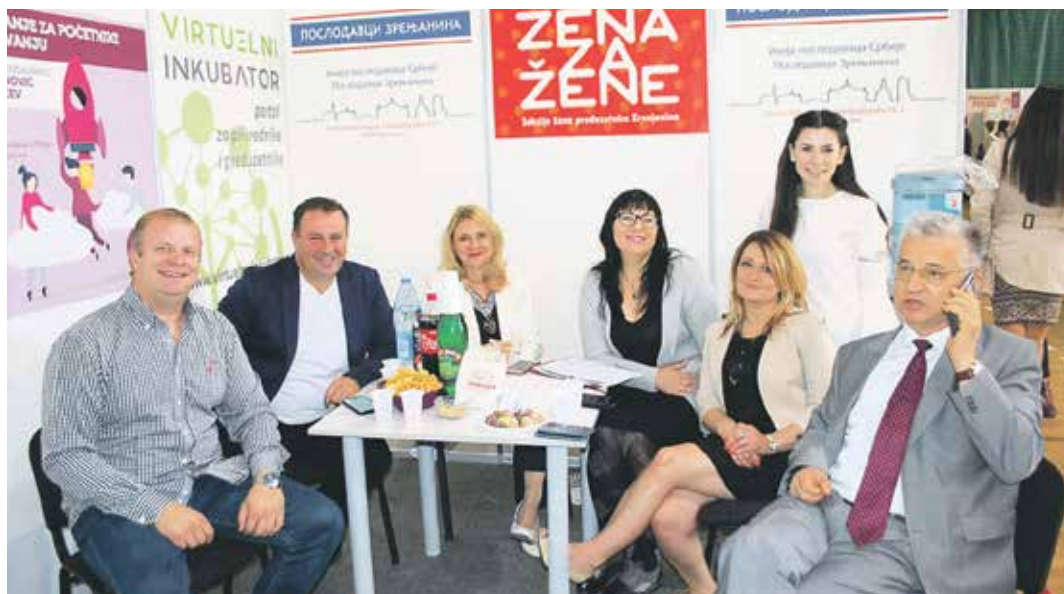
Атмосфера на штанду Уније послодаваца Србије – Послодавци Зрењанина